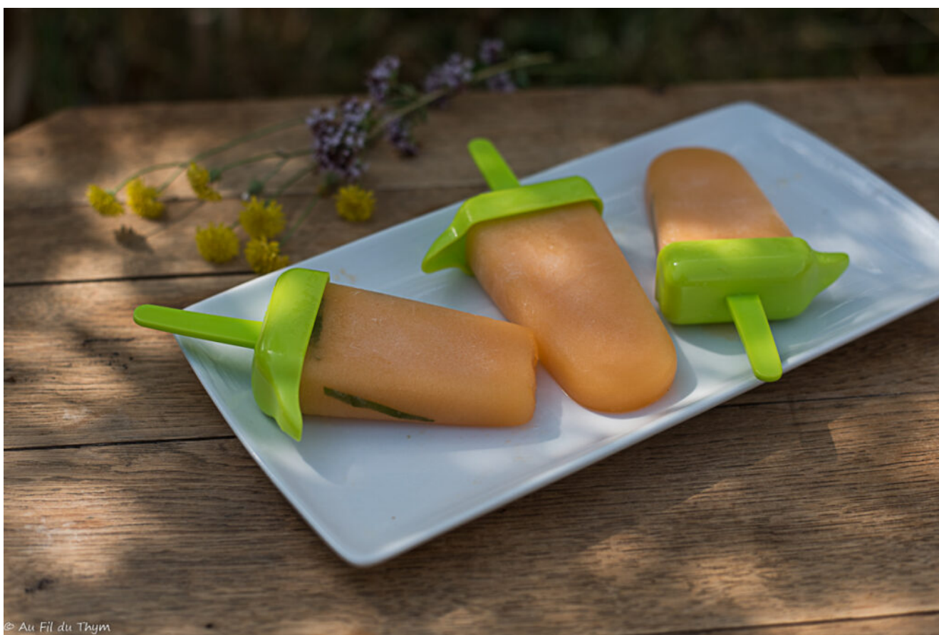
Esquimaux melon sans sorbetière