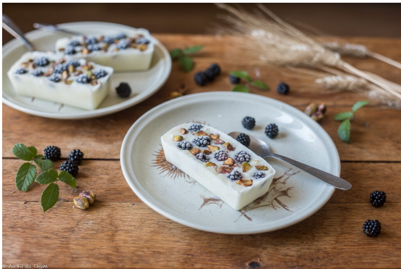
Glace au yaourt, mûres et pistaches