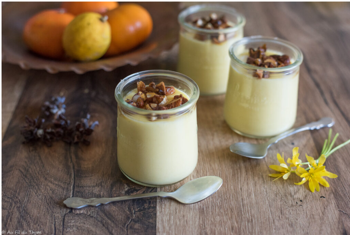
crèmes de citron et amandes caramélisées