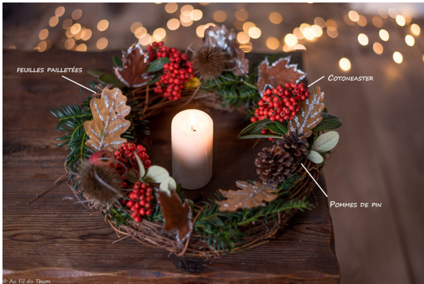
Couronne de Noël Champêtre

C'est ici que je clos cette rétrospective 2021. N'hésitez pas à partager vos petits bonheurs en commentaire, que l'on finisse tous l'année dans la bonne humeur et avec un peu de satisfaction. ☐