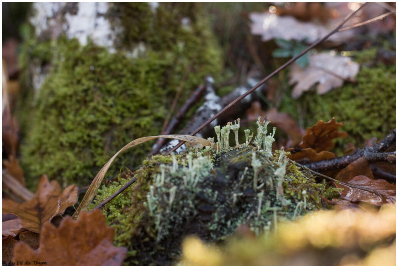
Grimpons dans la lumière du matin