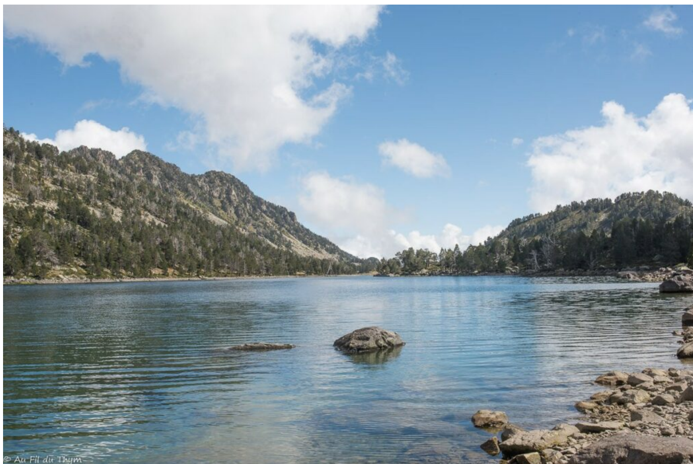
Nous nous y posons quelques minutes, faisons le tour, picorons quelques