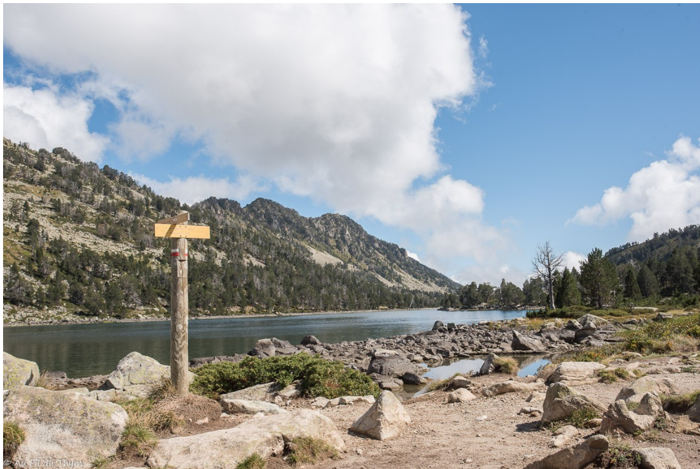
Eaux cristallines des lacs d'altitude.