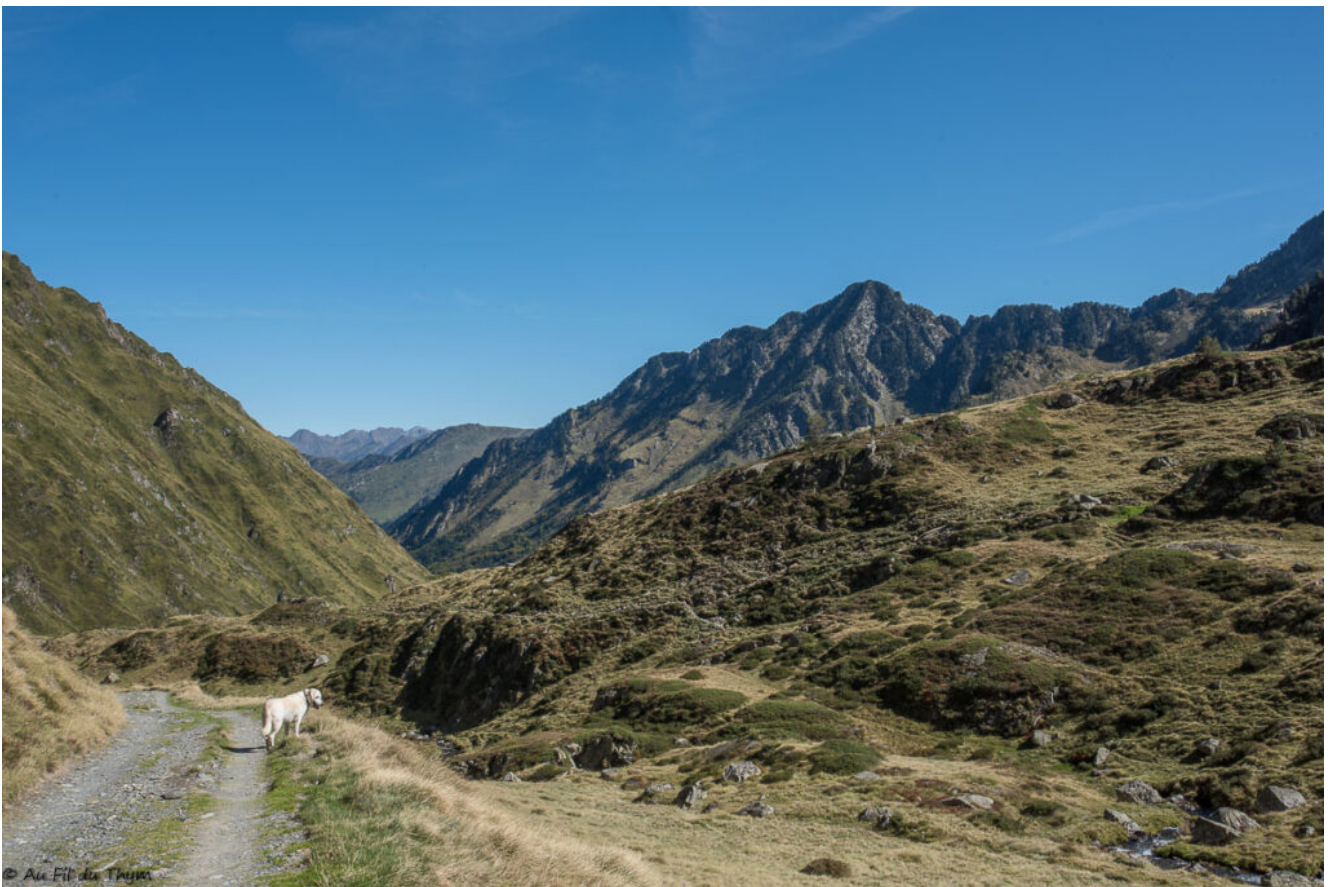
Arrivée de nouveau au niveau du « mur » affronté tout à l'heure j'ai un sourire. Il y a un peu de fierté a avoir