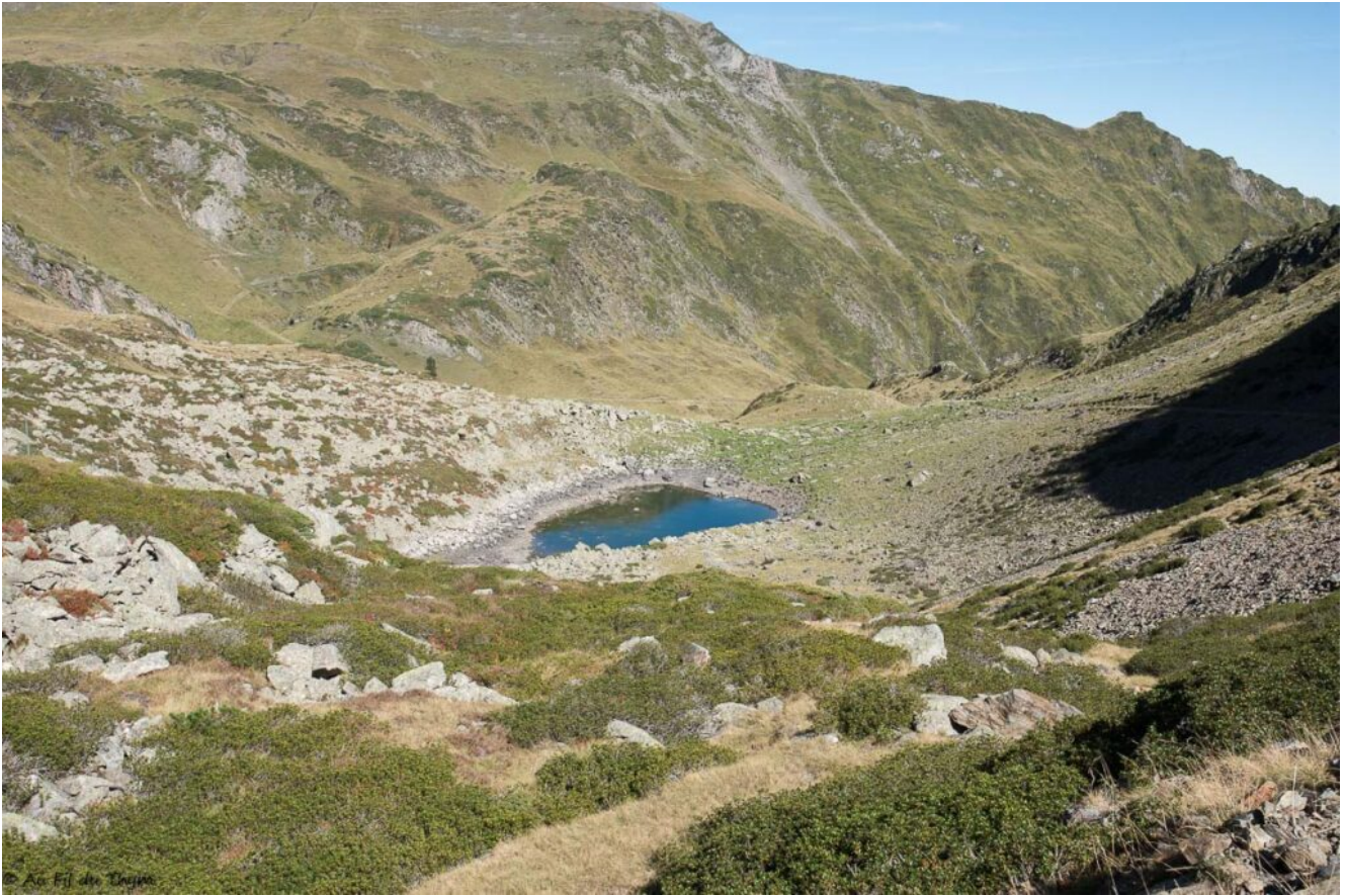
Le paysage vers le point de départ porte à perte de vue..