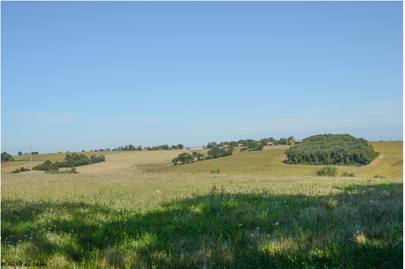
Poursuivre à travers champs