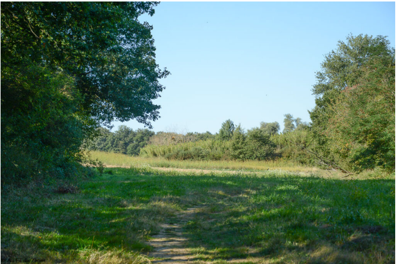
Au bout de chemin, à l'ombre, une jolie fleur blanche attire mon attention et je tombe nez à nez avec du sarrasin en fleurs