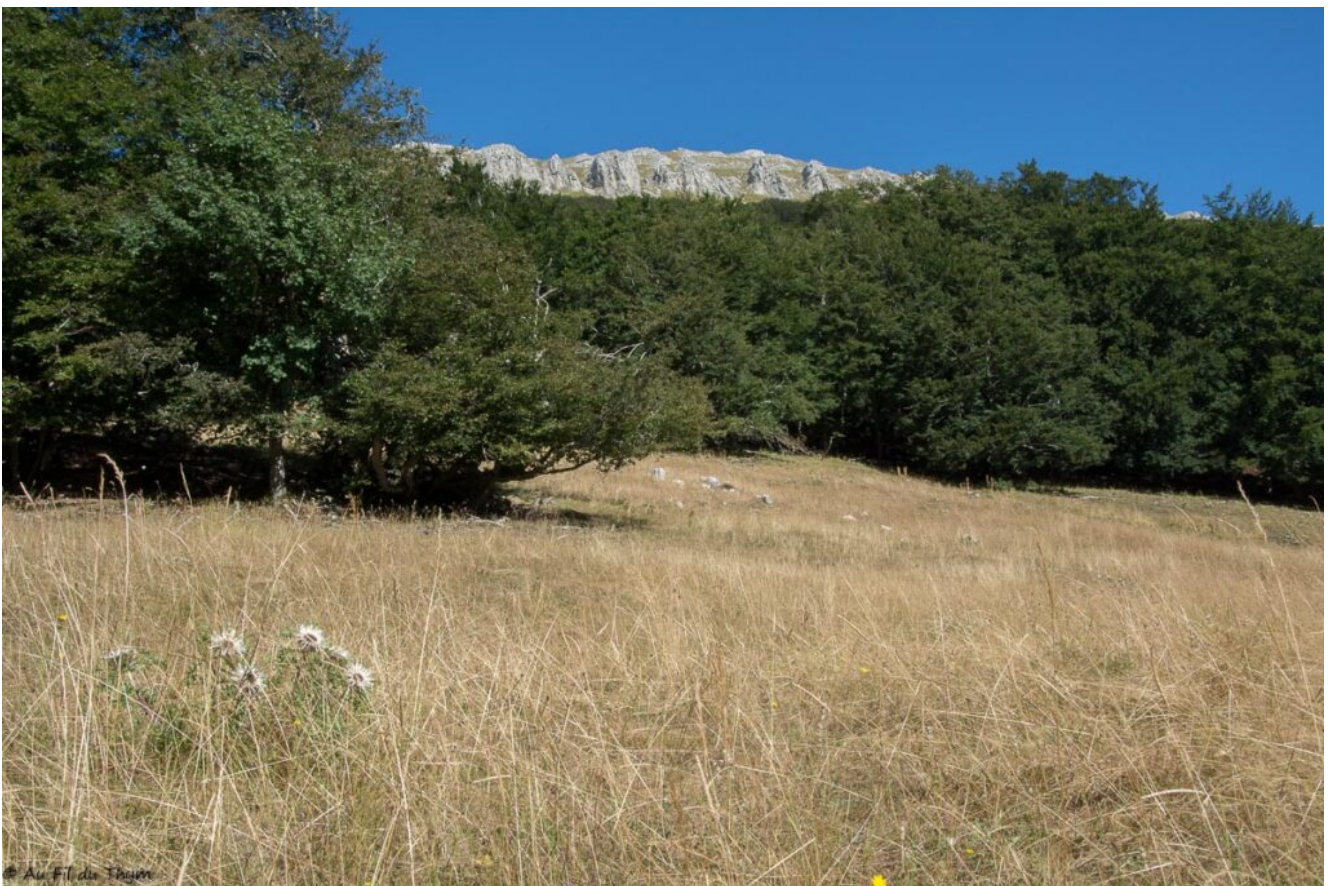
Au loin, au delà des forêts, nous pouvons apercevoir le Grand Veymont, « chaîne de monts » la plus haute du Vercos.