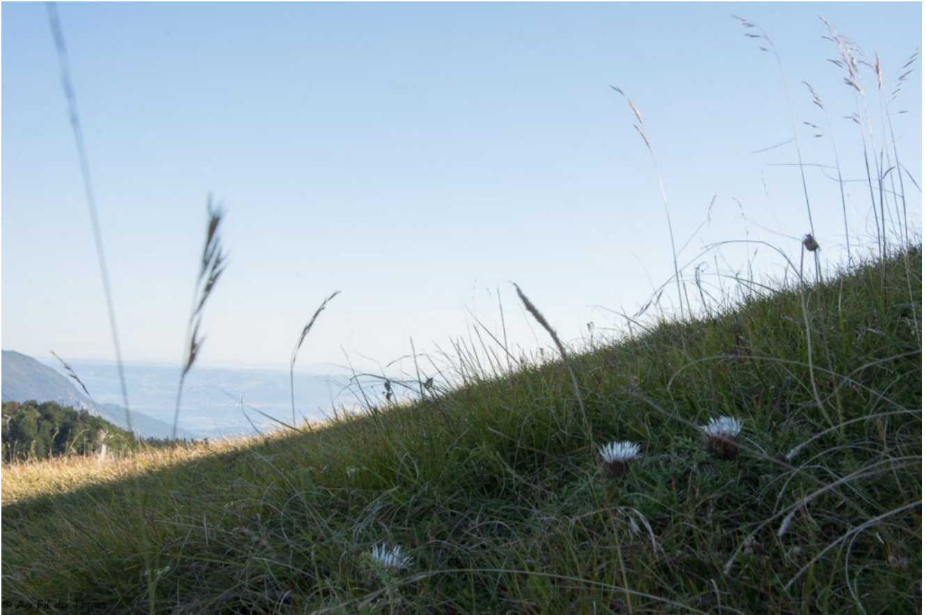
Le soleil se lève sur la vallées