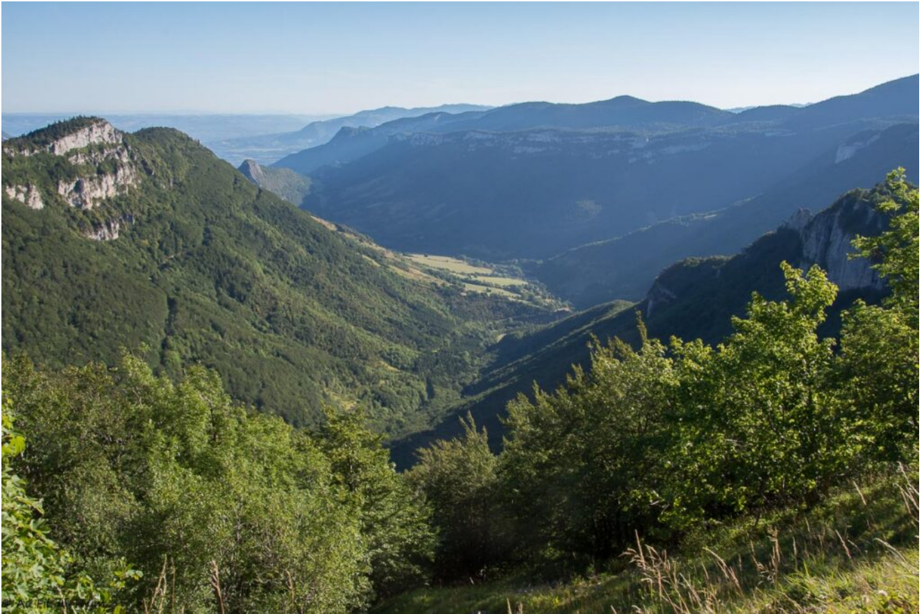
Avec les douces teintes du matin