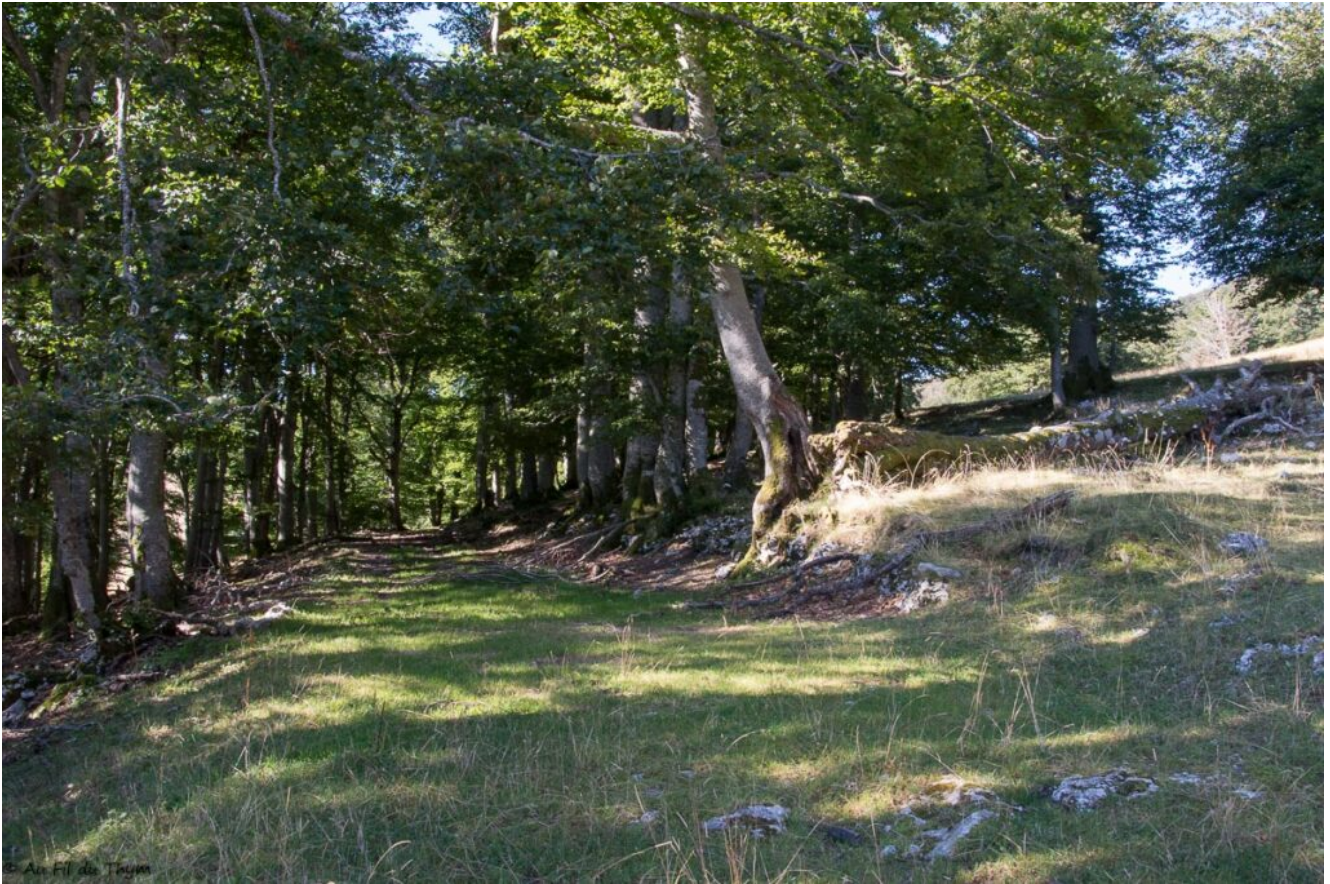
Avant d'arriver dans les Alpagnes d'Ambel séchés par l'été