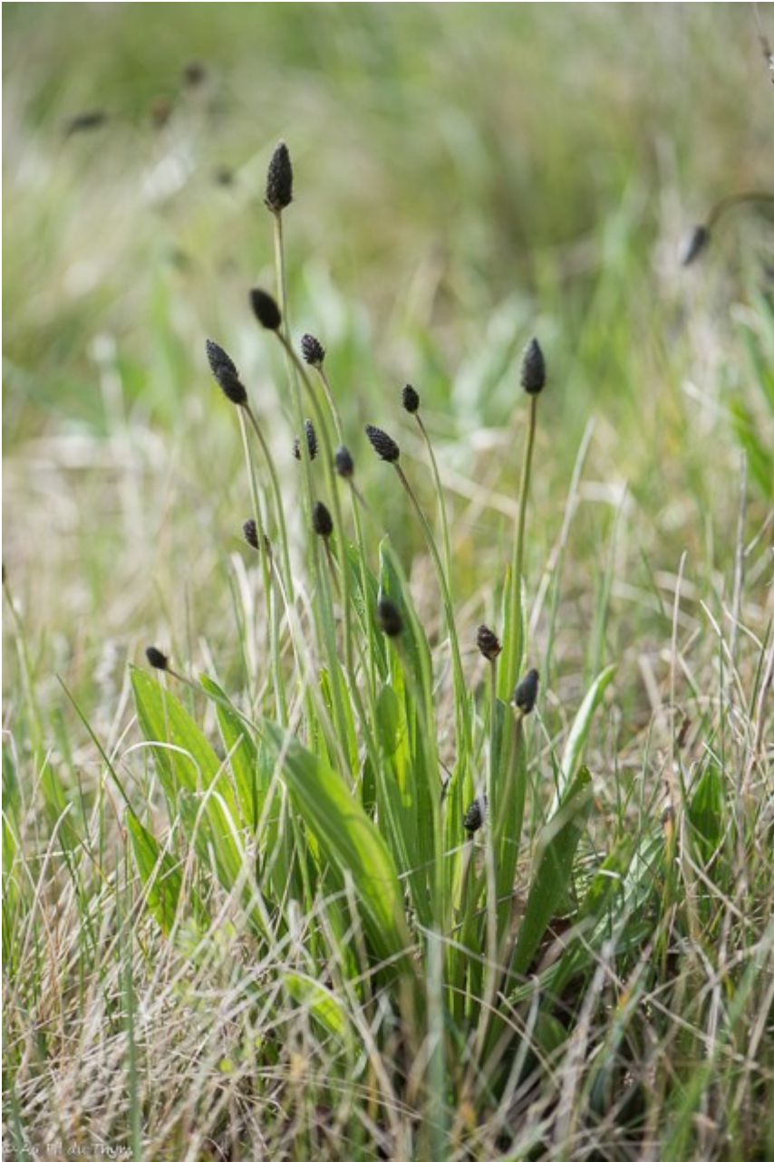
Plantain lancéolé (mars)