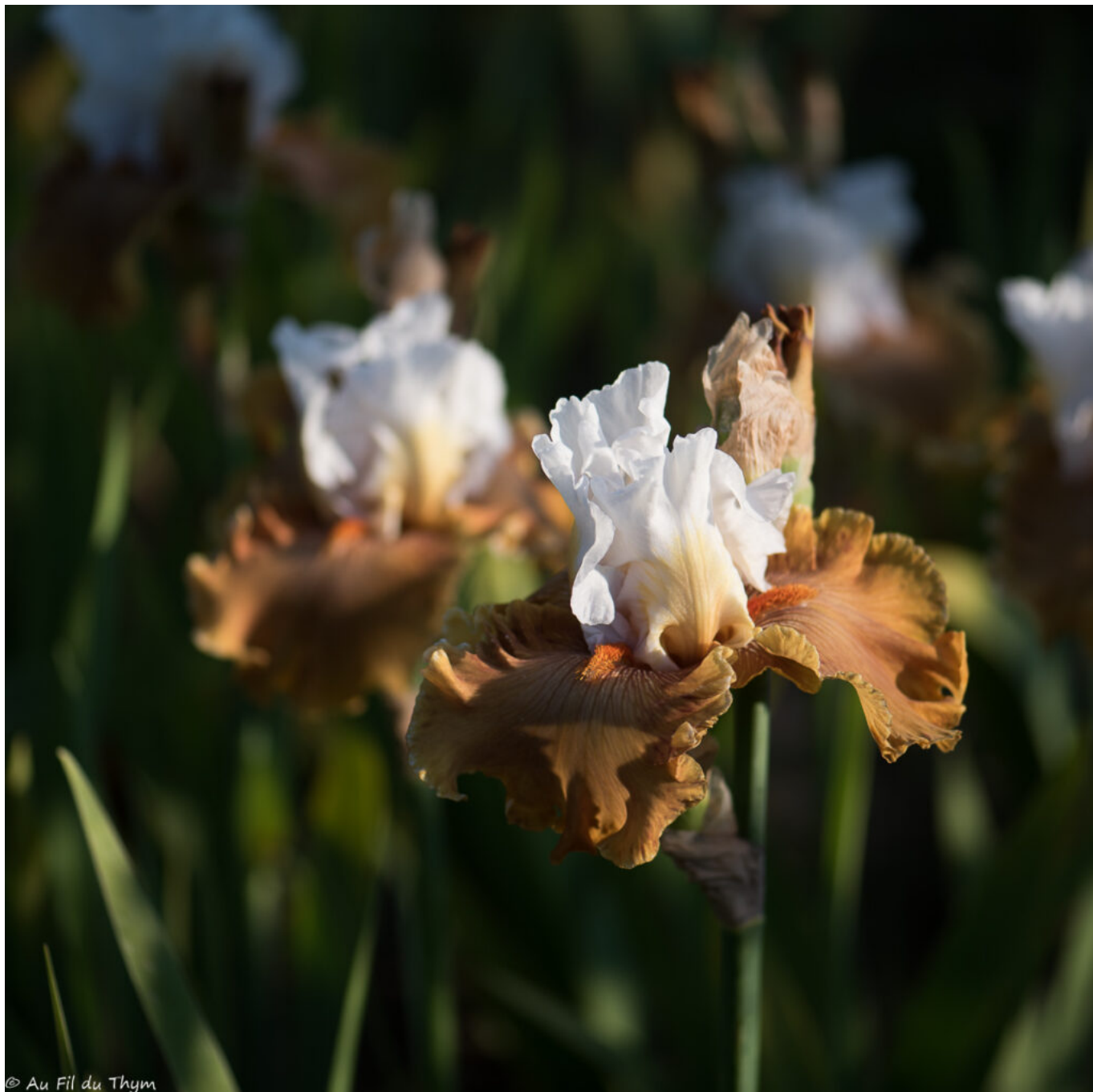
URBAN COWGIRL (?)