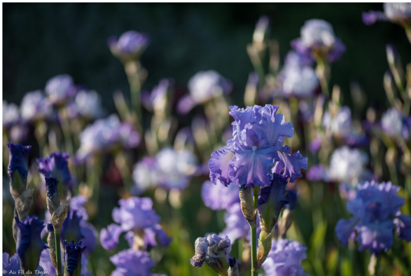
« Ciel mon mari »

Dans les photos ci-dessous, j'ai tenté de retrouver quelques noms de variétés, mais sans être sûre de moi. N'hésitez pas à consulter le site web des Iris pour les détails.