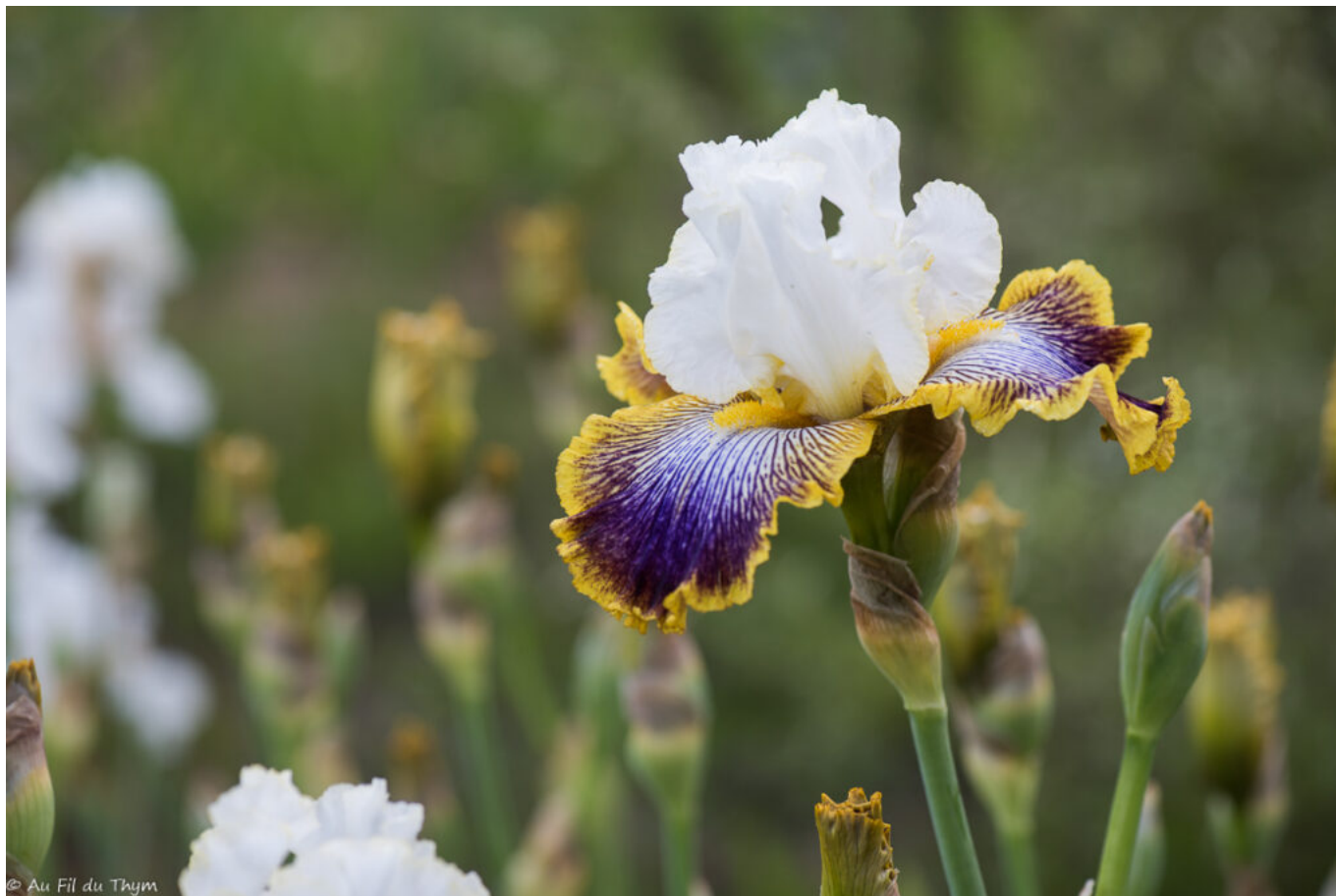
PATCHWORK PUZZLE (?)