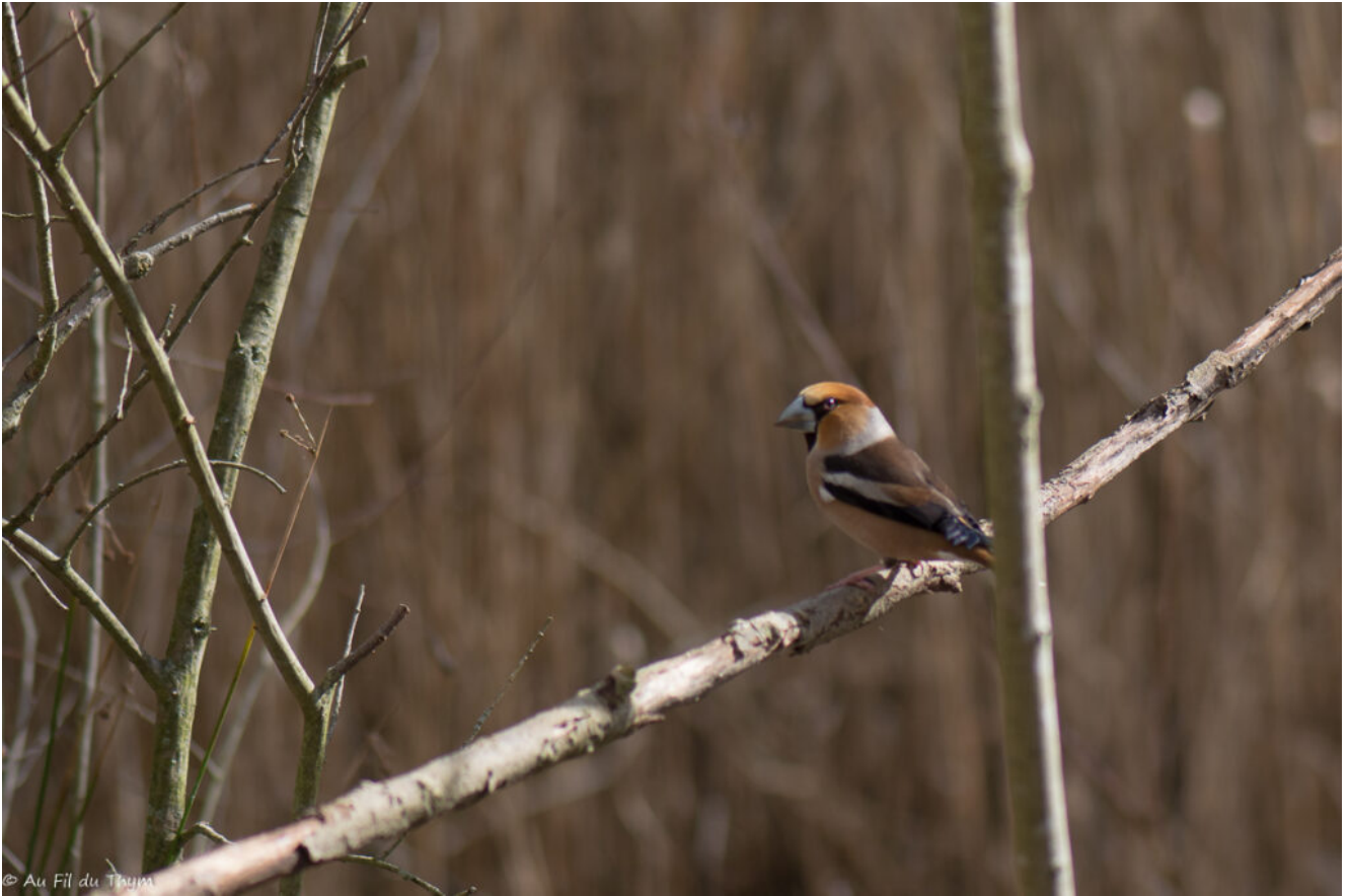
Arrivée du gros Bec