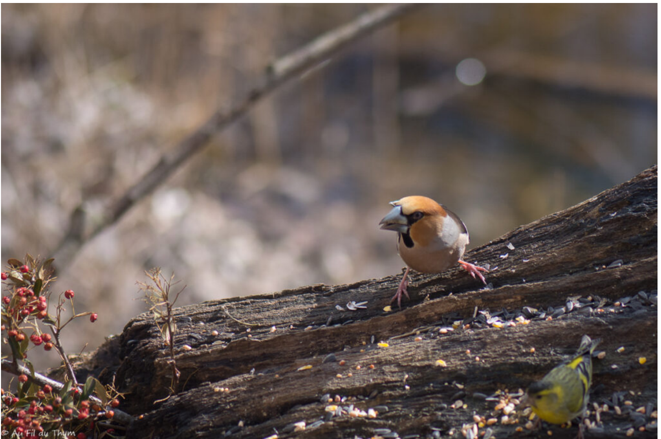
Jouer au dur