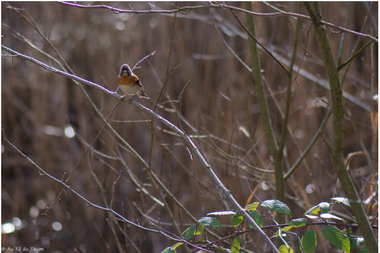
Pinson du Nord