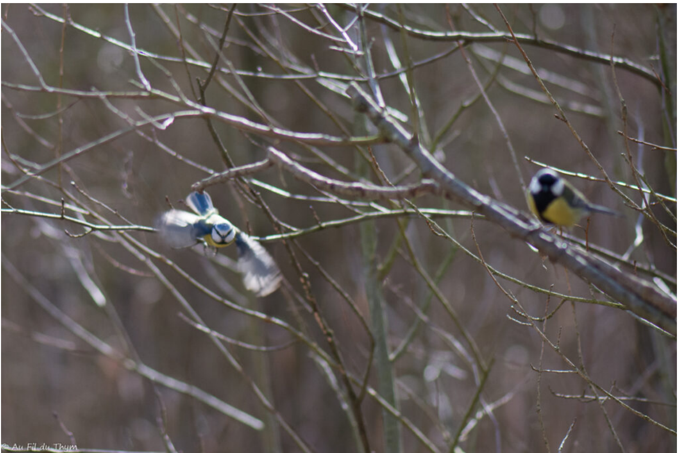
Petite boule de plume