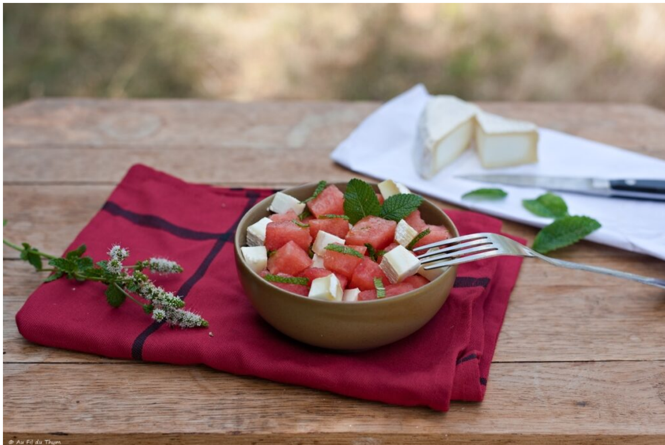
Salade pastèque chèvre menthe