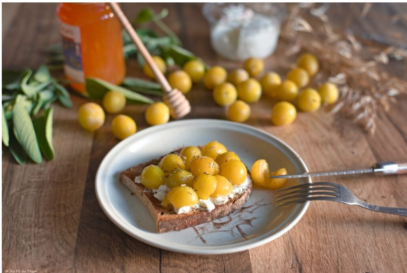
Tartines mirabelles, chèvre, miel