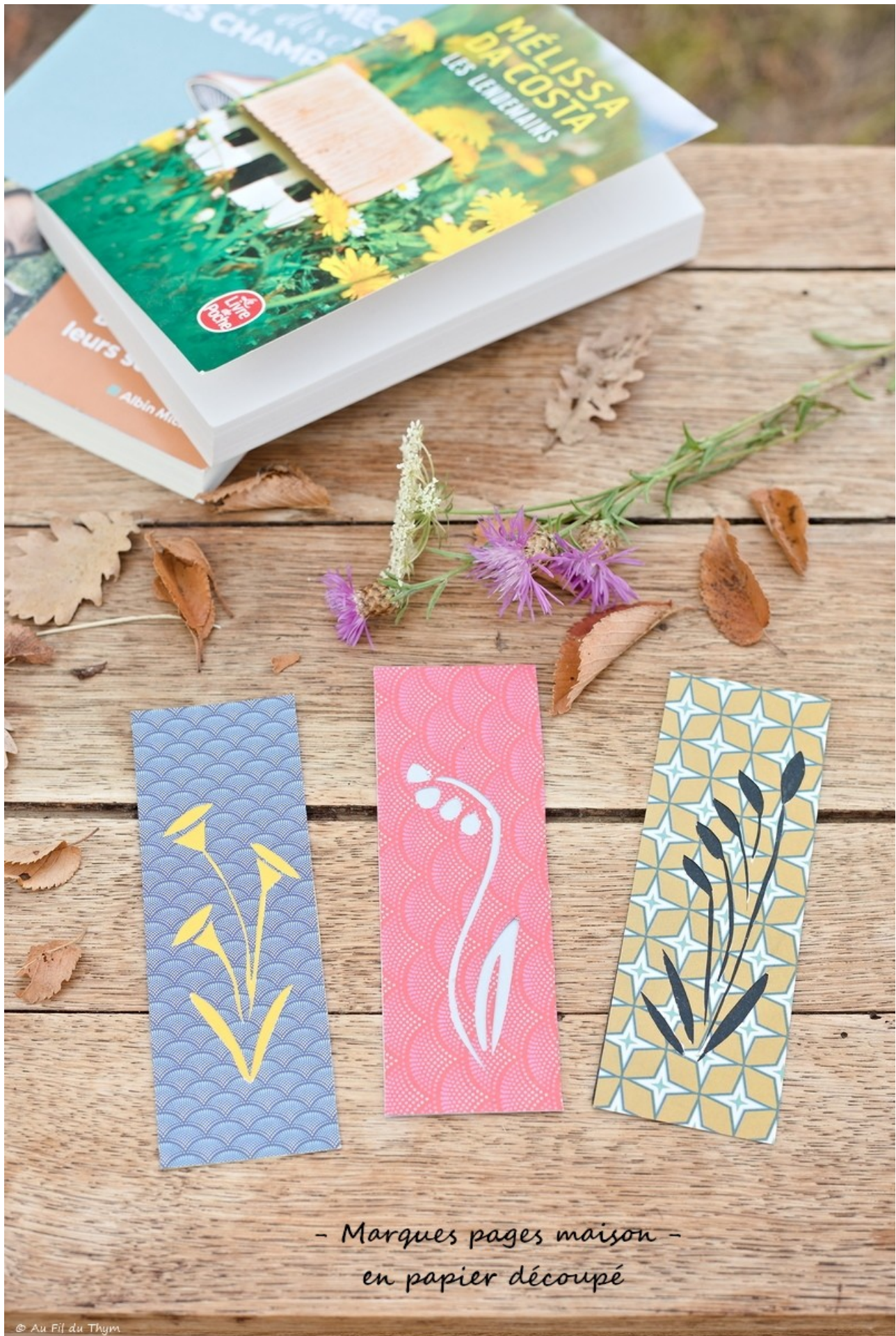
- Marques pages maison - en papier découpé