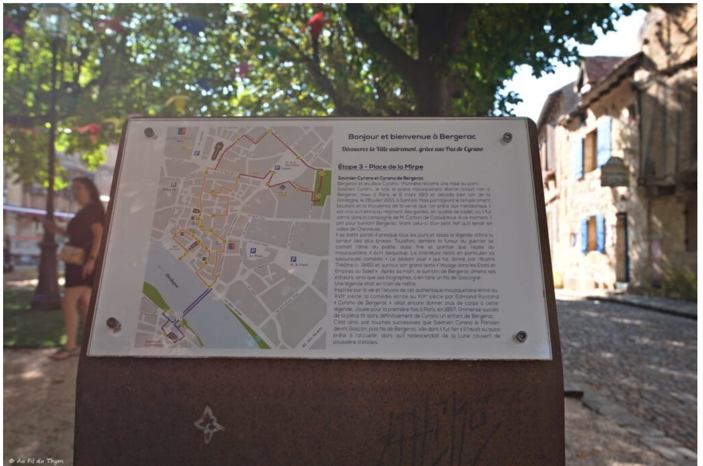
Un dernier regard sur la place, un dernier hommage au Cyrano et nous retournons au coeur de ville tout en flânant.