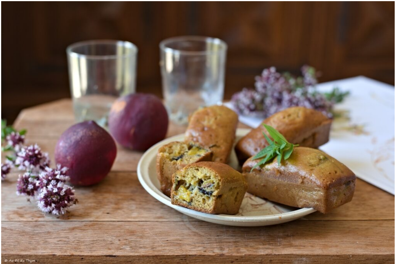
Petits cakes nectarine et verveine

raison de la présence de fruits dans le cak,e la durée de conservation est réduite par rapport aux cakes de voyage tels que le 4 quarts.