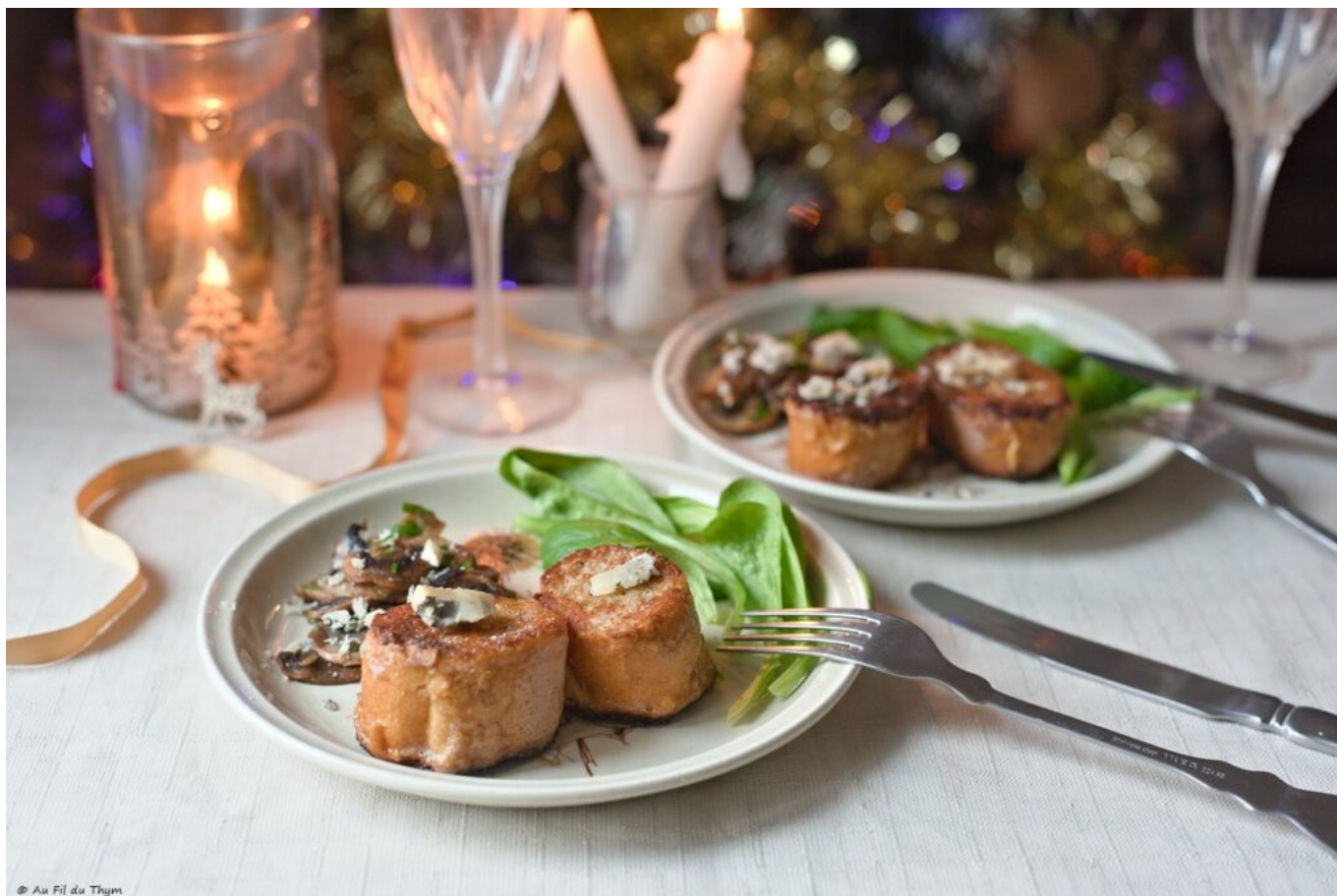
© Au Fil du Thym Pain perdu salé, champignons, mâche noix.