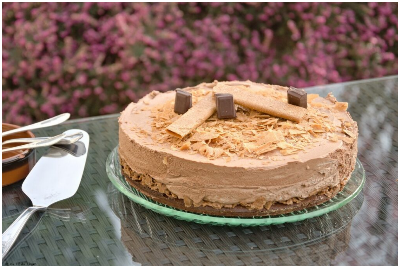
Trianon au chocolat