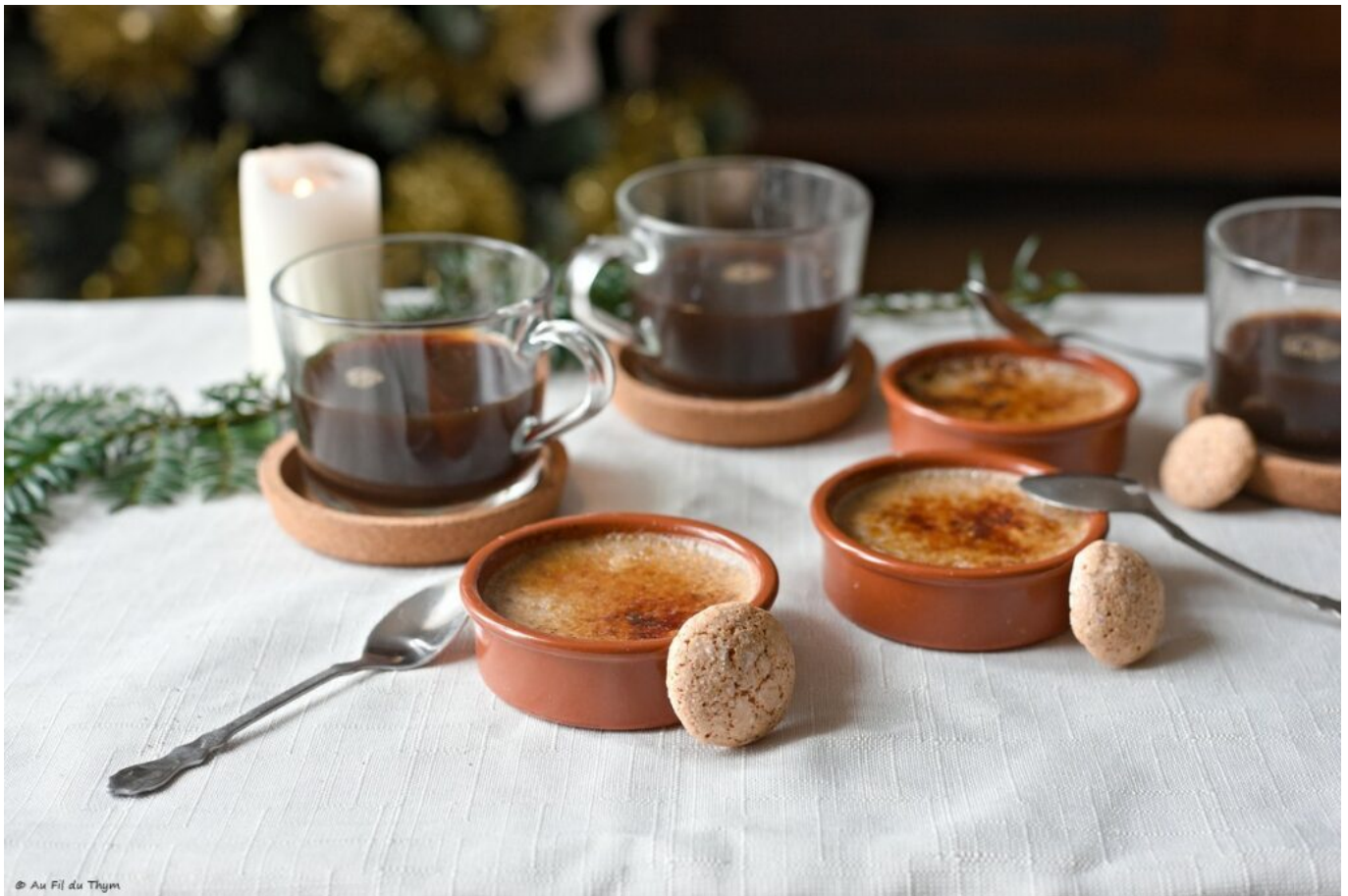
Crèmes brûlées pain d'épices