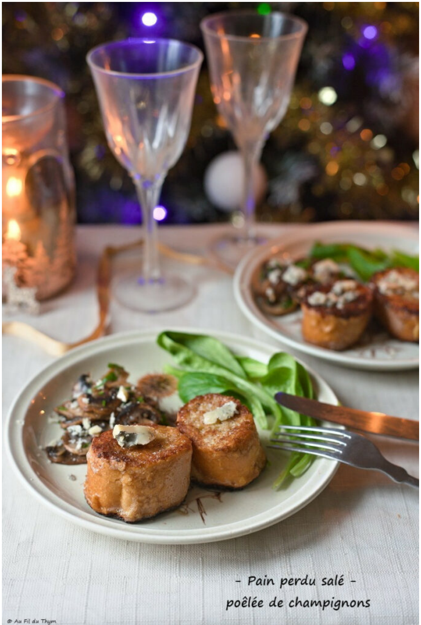
- Pain perdu salé - poêlée de champignons