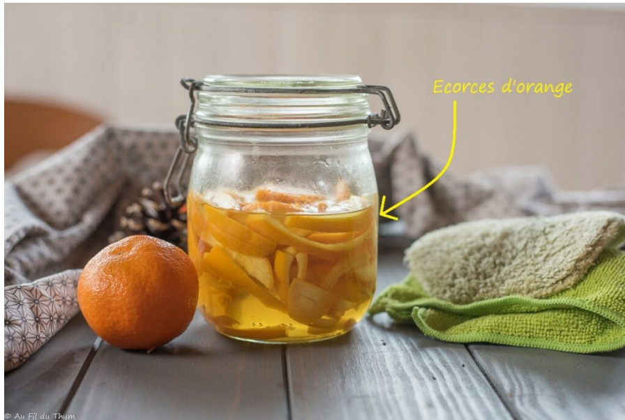
Décapant Orange zéro déchet