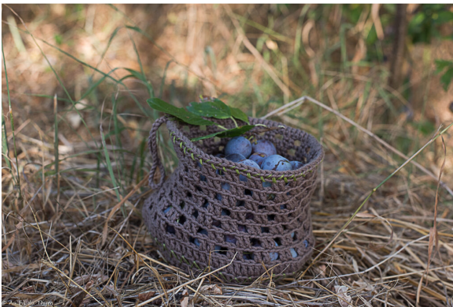
DIY – Panier cueillette en crochet (fait maison)