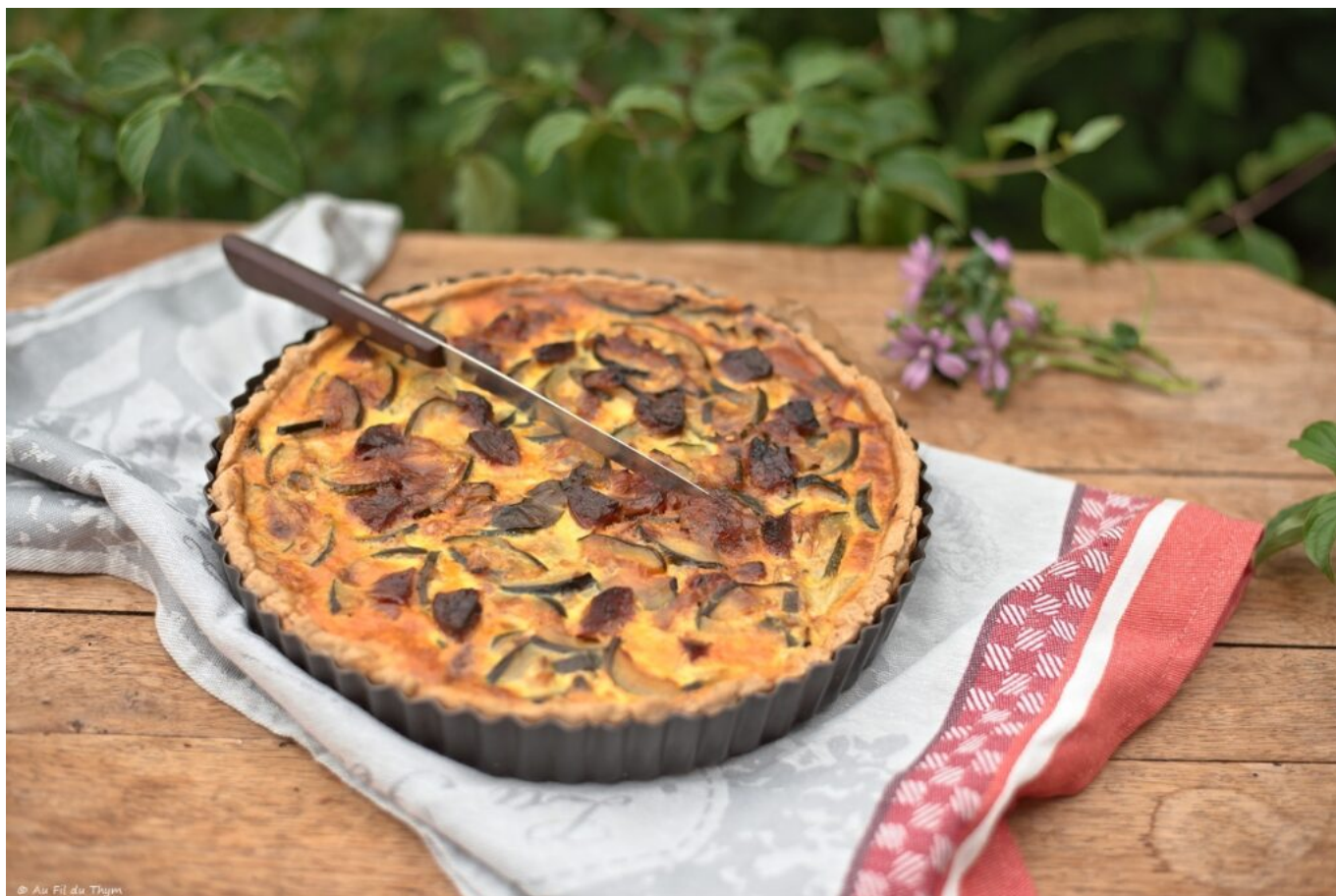
Quiche courgettes chorizo

Et comme chaque année, c'est en juin que vous avez pu retrouver le traditionnel billet des 50 nuances d'orchis , clôturant une saison de chasse aux orchidées sauvages ☐