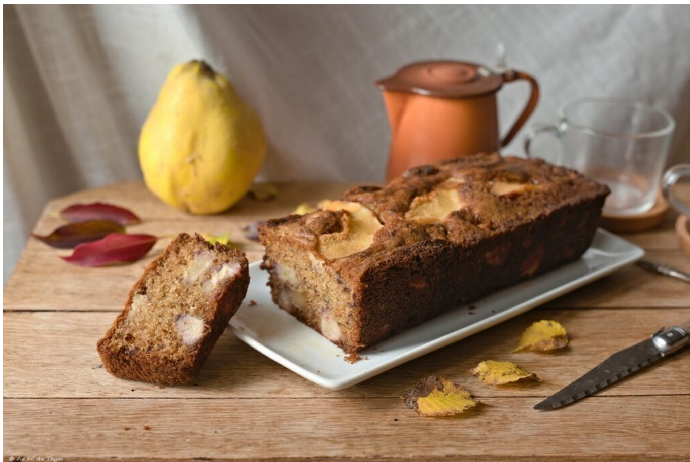
Cake aux coings et épices