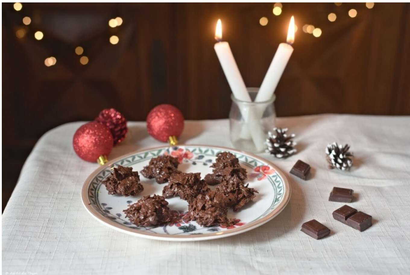
Rochers chocolat amande

Et voilà, une rétrospective 2025 (rapide) de l'année sur Au Fil du Thym. En l'écrivant, je me dis que nous nous sommes bien baladé, avons vu plein de fleurs et de paysages, nous sommes aussi bien régalez avec des nouvelles recettes... Donc au final l'année a quand même eu de nombreux côtés « chouette ». ☐