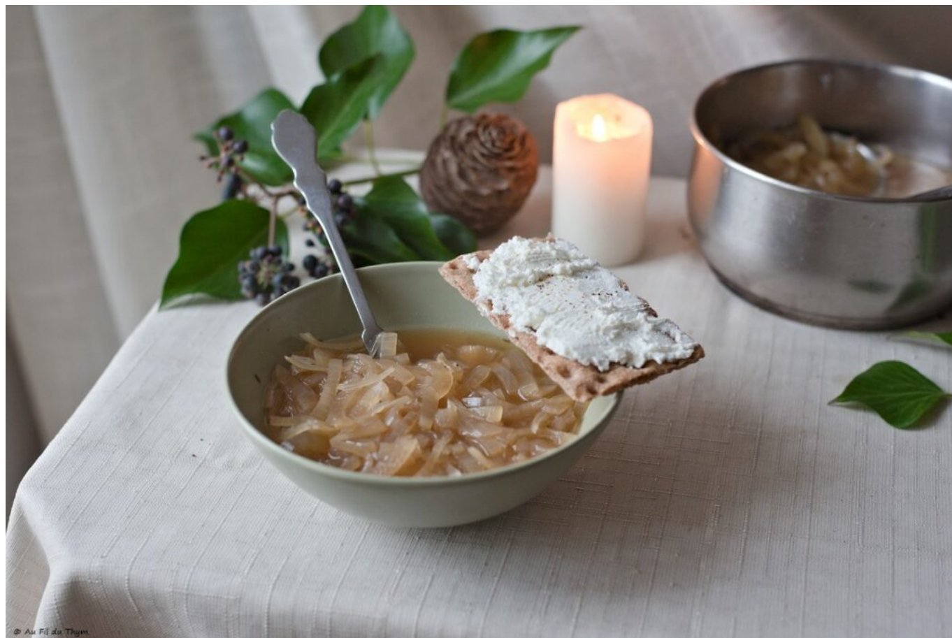
Soupe oignon, tartines fromage frais