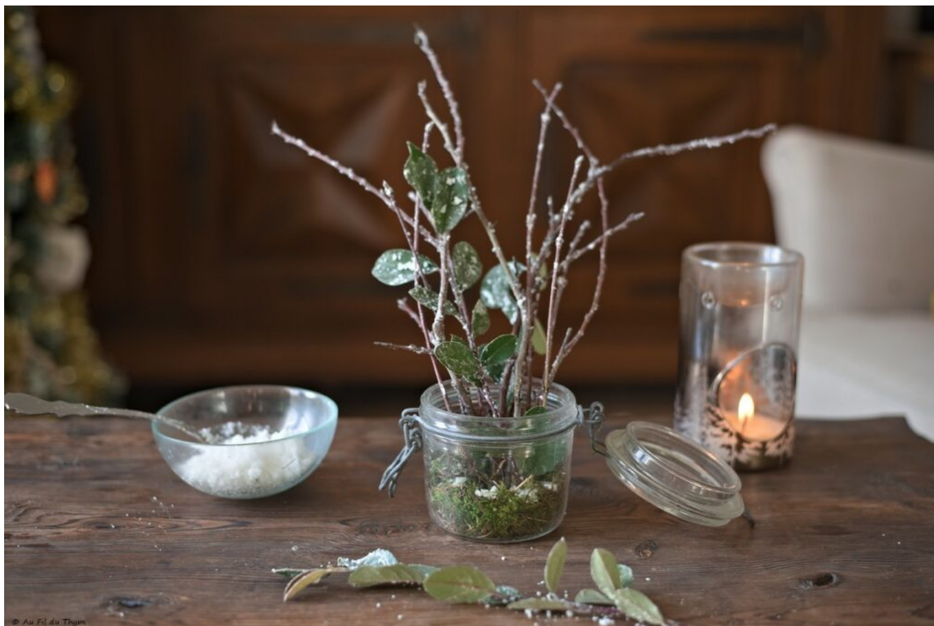
DIY : Branches givrées maison