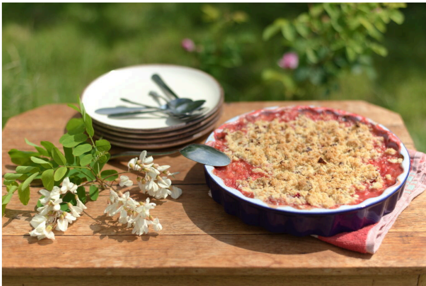
Crumble rhubarbe fraises