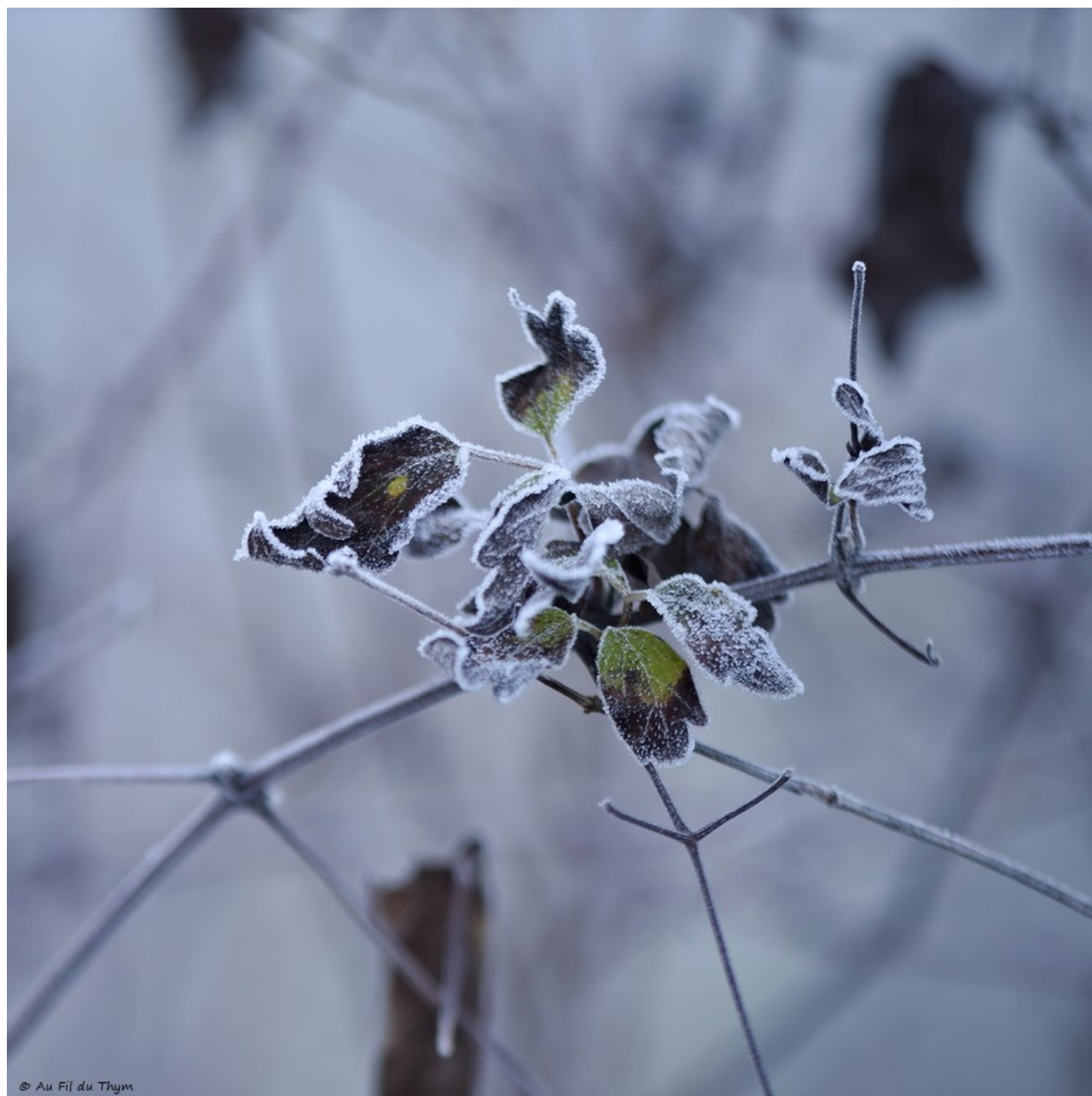
Givre dans les clématites vigne blanche (Janvier 2026)

Si vous vous promenez en hiver et tôt le matin, sans doute regardez vous le givre . Il colore la campagne de blancs révèle les détails. Lors des rayons de soleil rasant, il donne une teinte brillante aux herbes et aux branches ( Exemples en photos lors d'une promenade ). Les jours nuageux, il se teinte d'un discret bleu -violet tout à fait charmant. Pour les photographes amateurs, c'est le moment d'aller à la chasse des merveilles de la Nature.