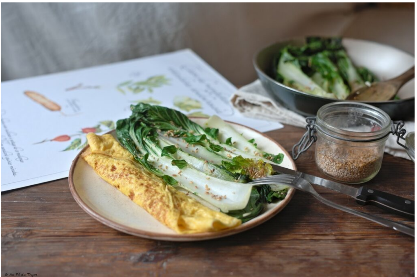
Bok Choy sauté au sésame et Omelette