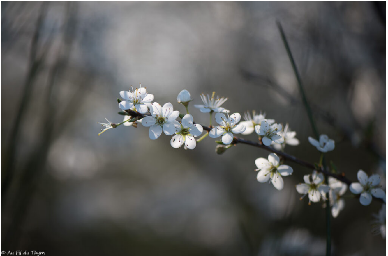
Prunier de Damas

domestica subsp. domestic (ou pruniers de damas), miroboans et prunelliers offrent un bal de fleurs blanches qui scintillent au soleil. Ils sont aussi attractifs que leurs congénères des villes et – si la météo est clémente – nous le retrouverons en fin d'été chargés de fruits. (Ceux des pruniers de Damas se consomment ; ))