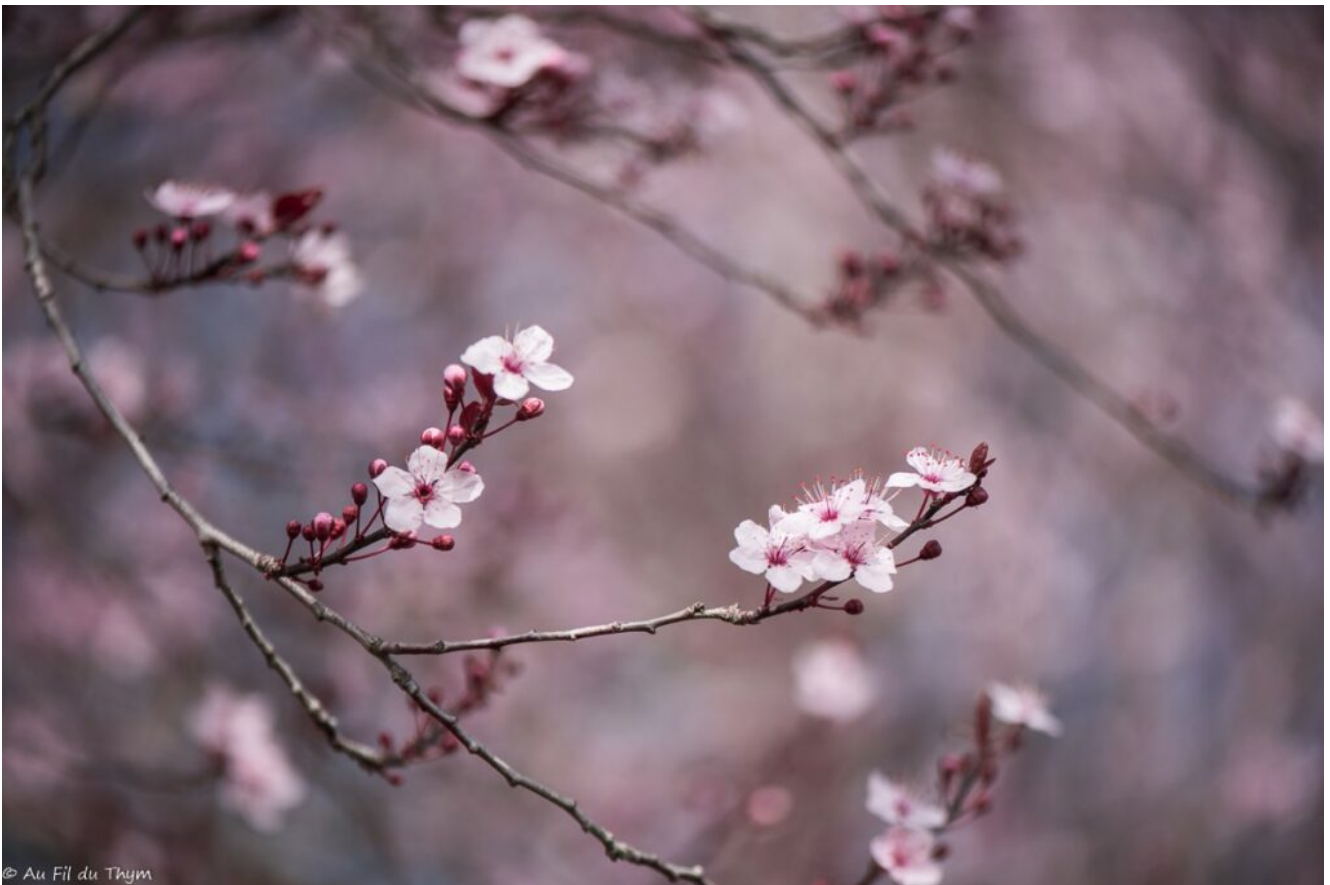
Symphonie de rose