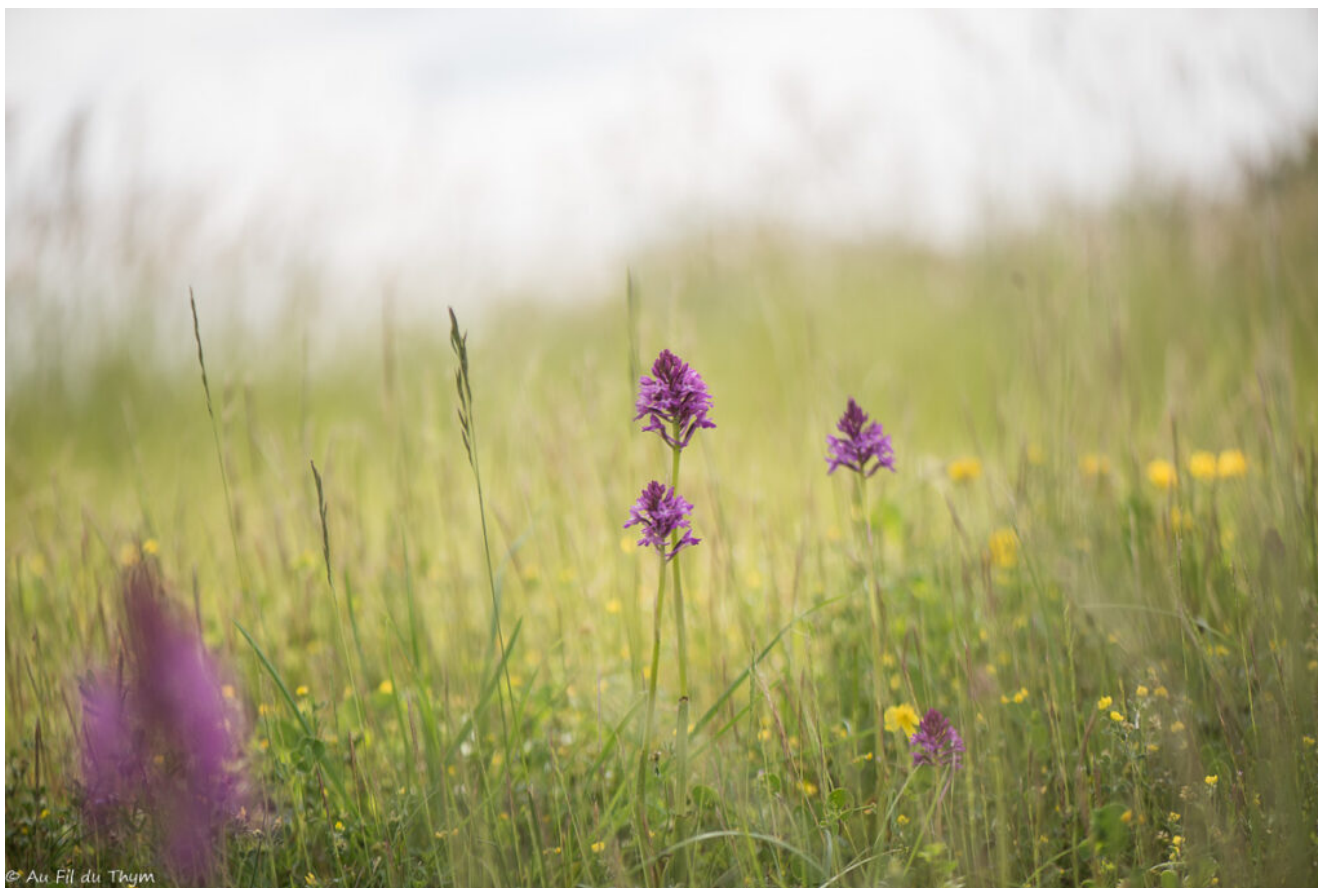
Anacamptis pyramidaux (fin mai)