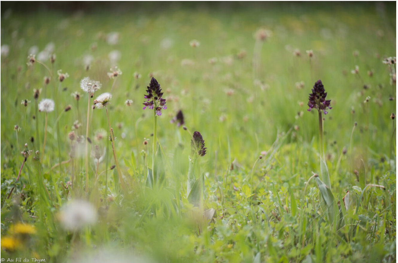
Orchis pourpre(début avril)

Avril voit le foisonnement des grands orchis pourpres dans les prairies sèches. Dans celles plus protégées, on peut découvrir cachés dans l'herbe les petits orchis bouffons et orchis peint . Pour qui sait regarder, on peut sur la fin du mois aussi apercevoir ainsi que les orchis homme pendu , aux teintes vertes mais à la forme si caractéristique.