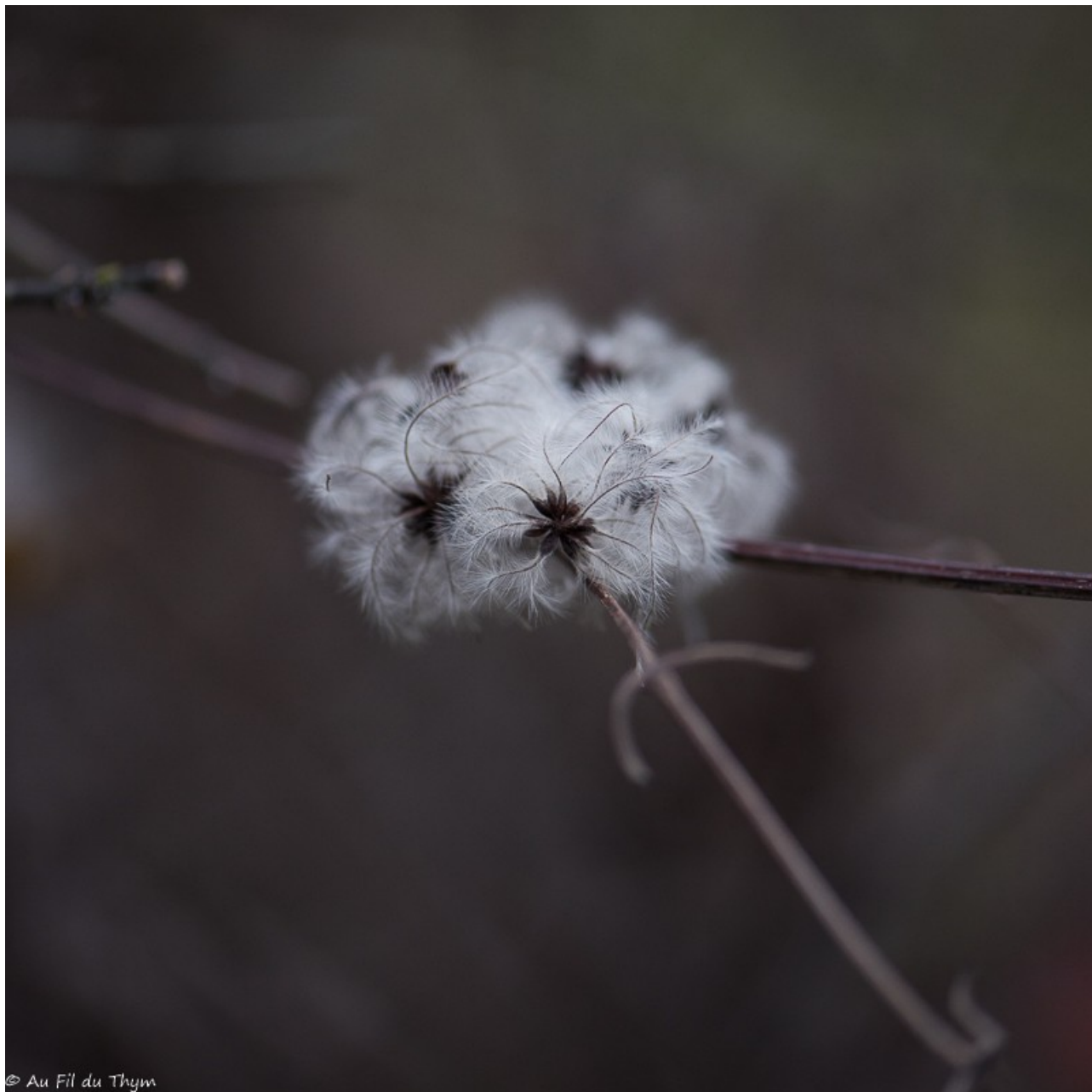
Finesse des plumes