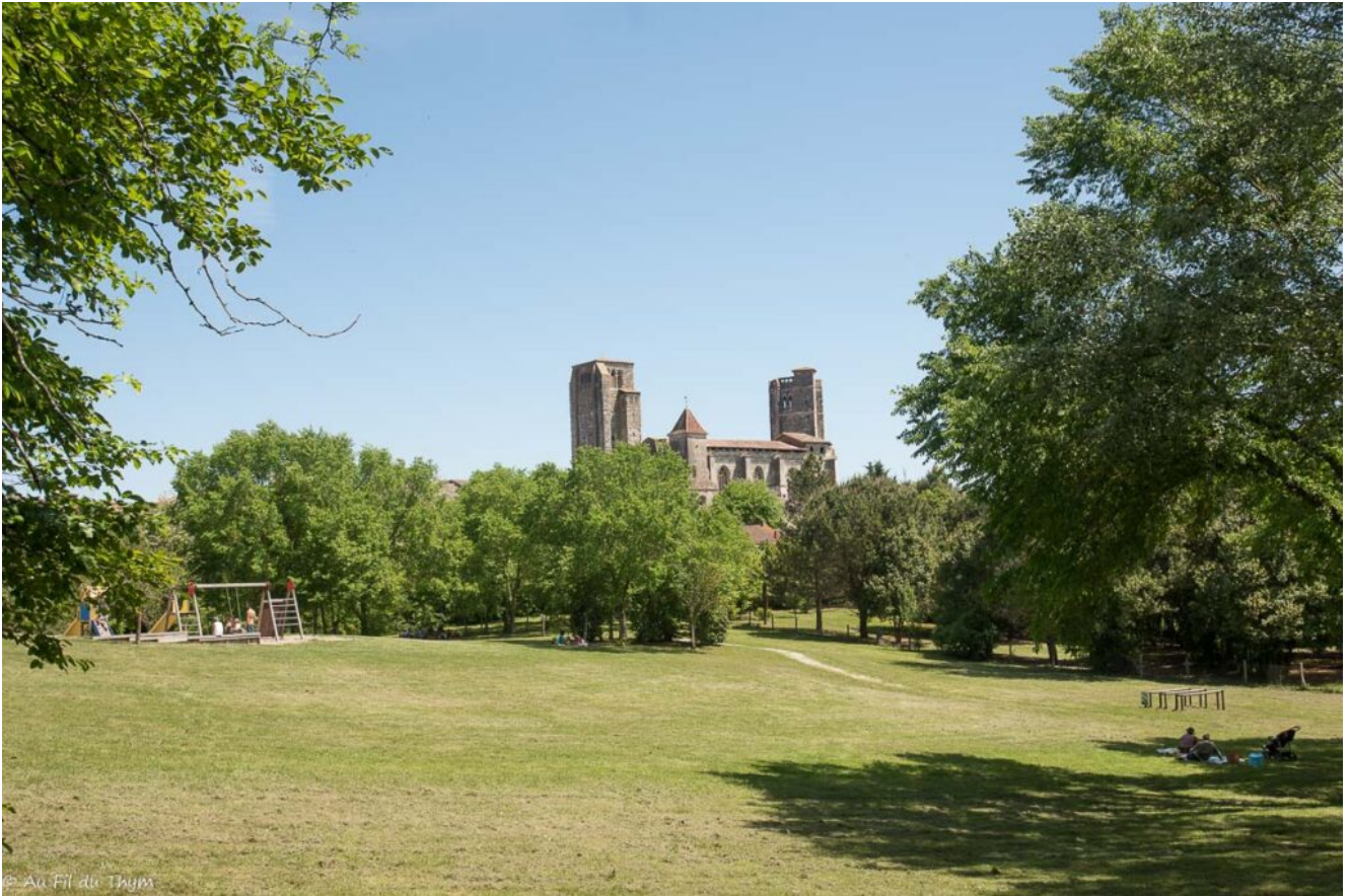
Vue sur la Romieu