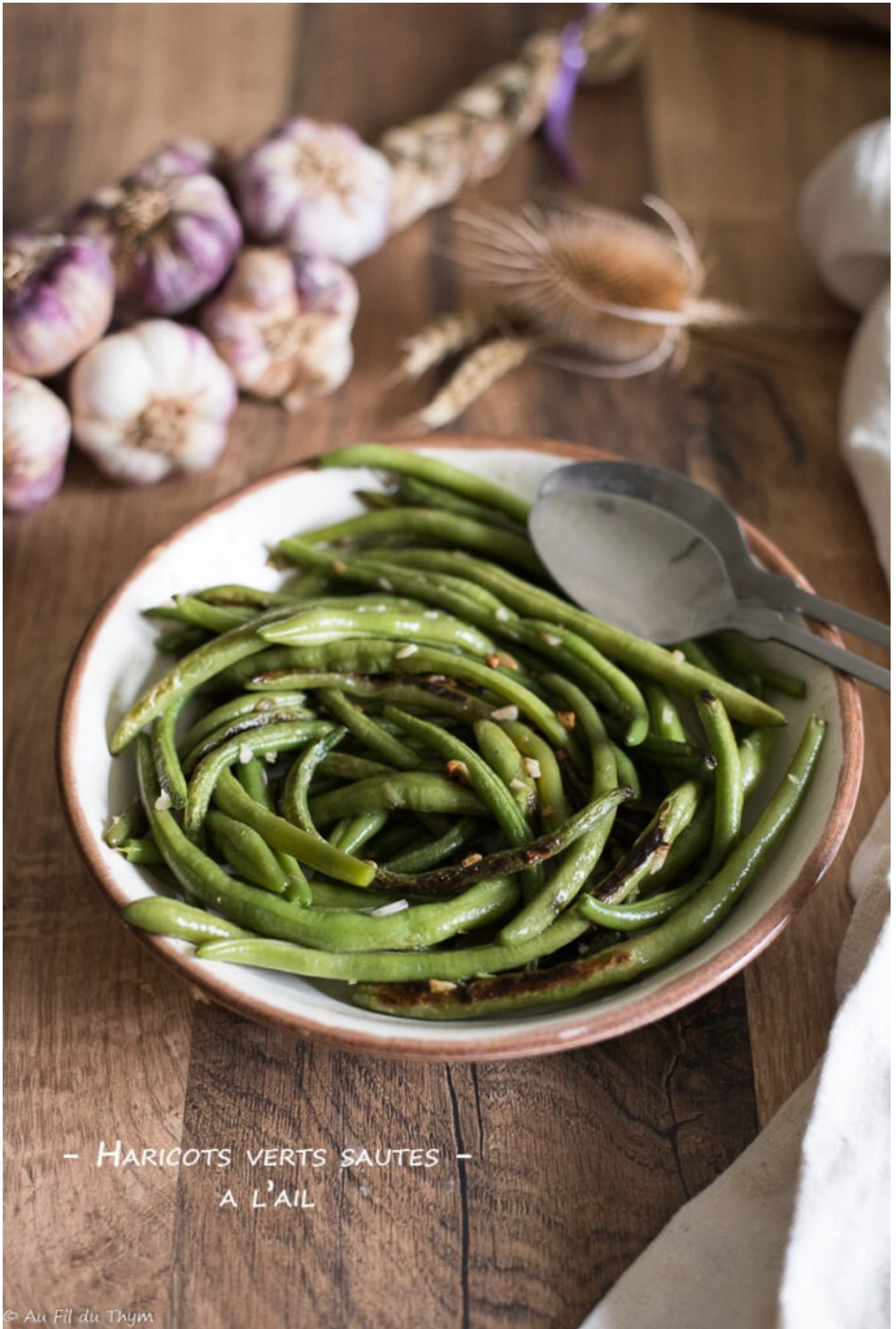
— HARICOTS VERTS SAUTES — A L'AIL