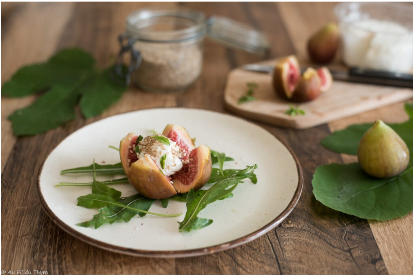
Figues farcies chèvre et sésame