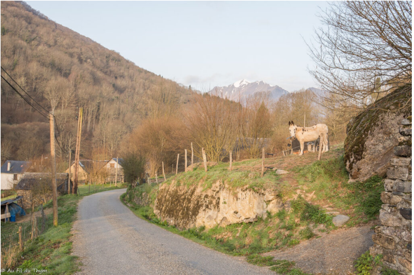
Passer sur l'autre flan de Vallée de Biros révèle les petits hameaux endormis, cachés entre les arbres..