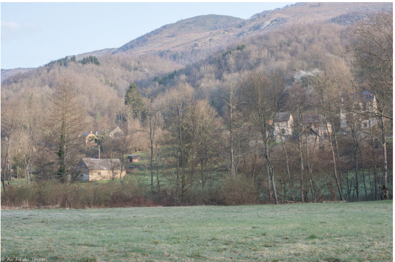
Ce matin, il a gelé. Mon regard est vite attiré par les