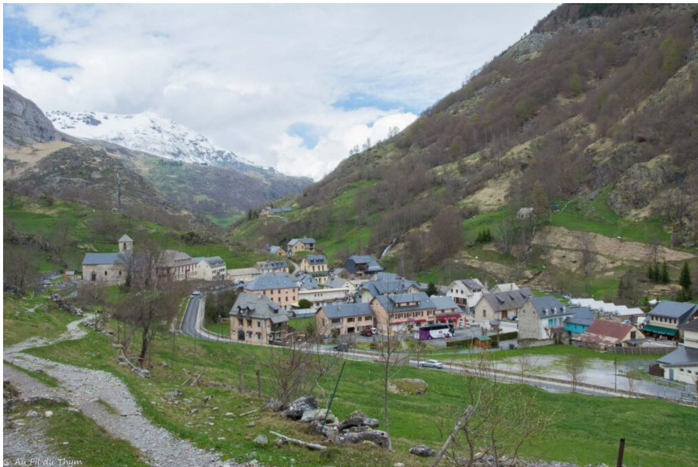
Vue sur le village de Gavarnie