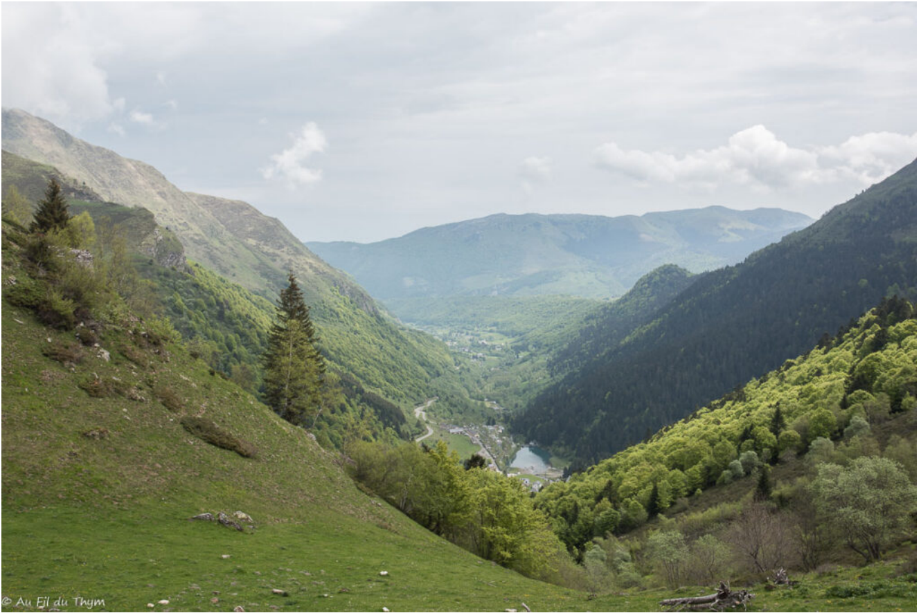
La route en arrivant sur un plateau