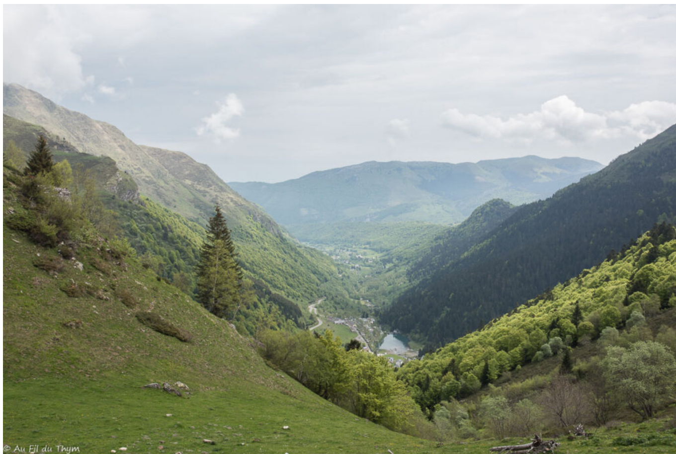
La route en arrivant sur un plateau