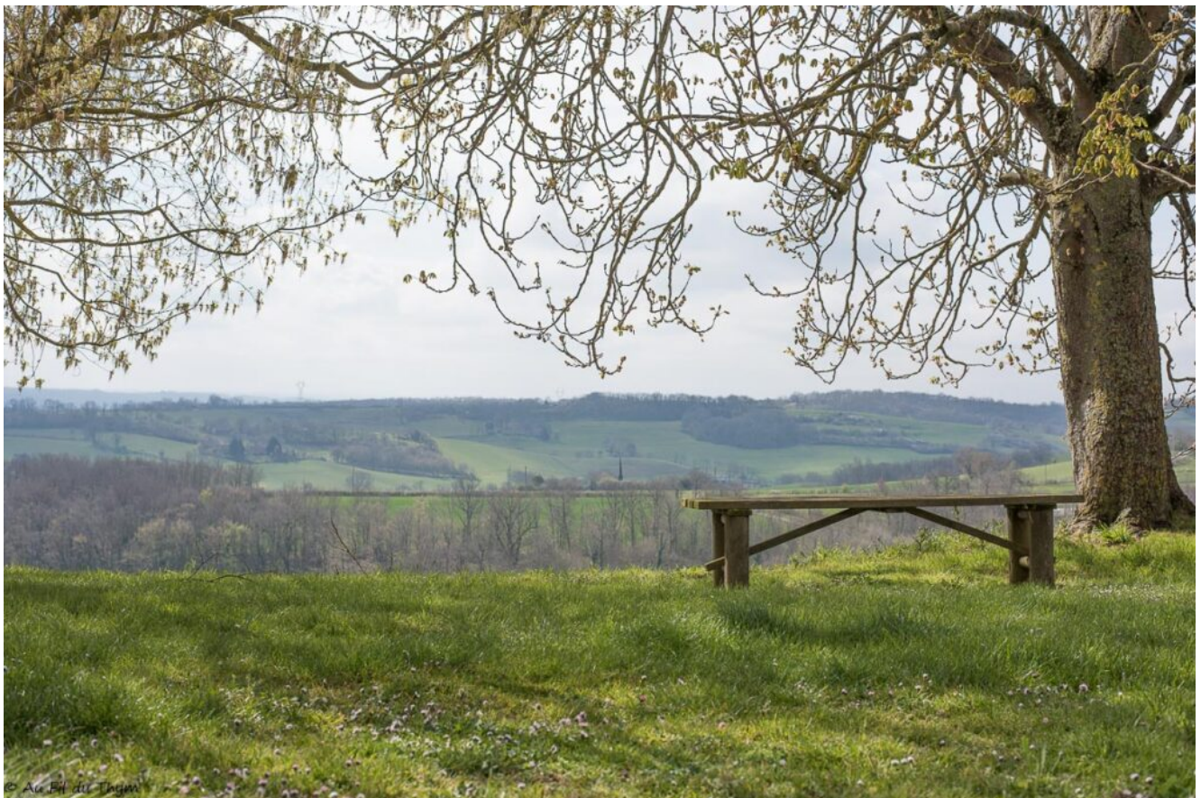
Point de vue depuis Tournan

Je vous propose de partir en balade aujourd'hui, à la découverte de deux curiosités du Gers. En fait, juste avant que les « mesures de freinage renforcées » (du covid19) ne se mettent en place, nous avons profité d'une journée de week-end (presque) ensoleillée pour faire une sortie en famille. J'avais repéré les Yané et Kazé des « land art » c'est à dire des œuvres artistiques d'extérieur, utilisant des matériaux naturels comme idée. N'étant pas très loin, ils devaient nous permettre de nous évader sans faire trop de voiture. Je vous invite avec nous, à leur découverte.