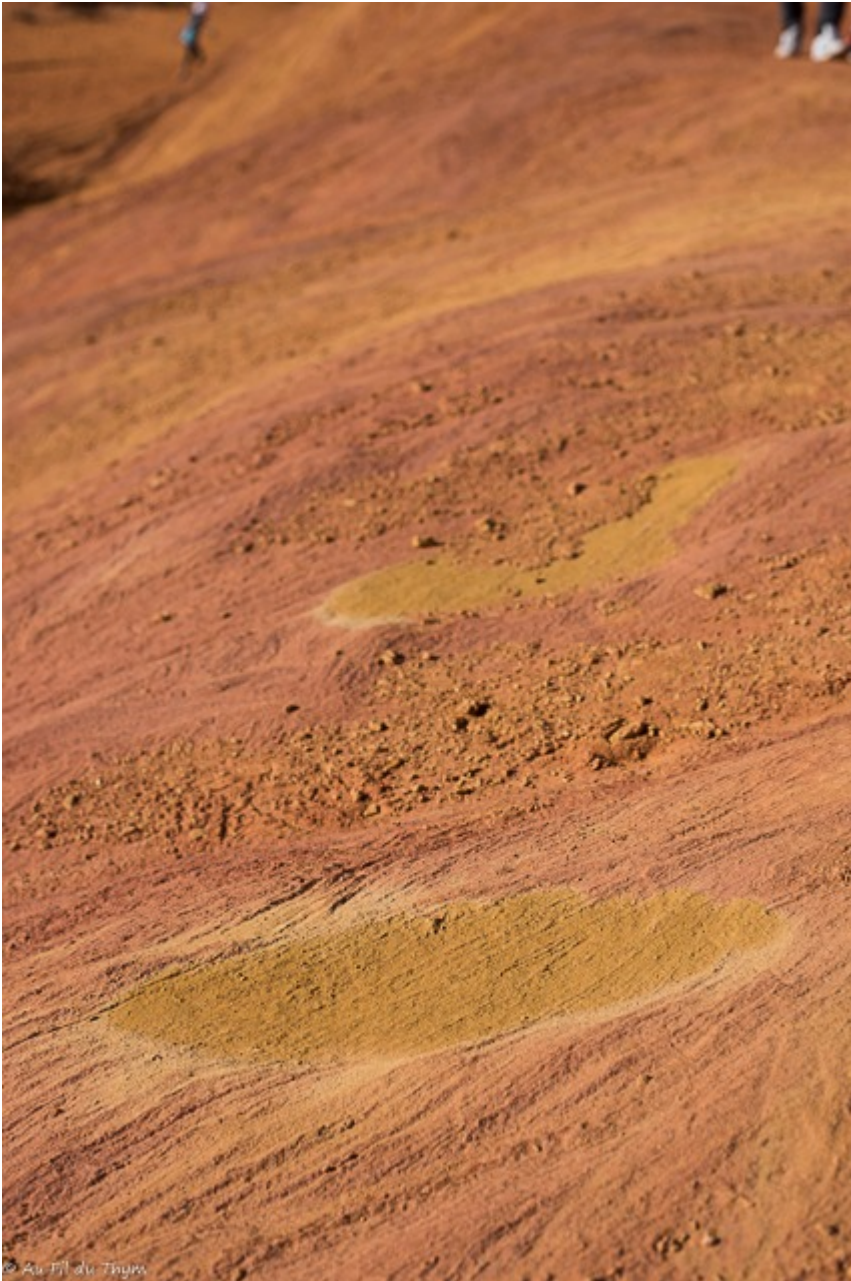
Terres rouges par le sable, blanc des falaises, contraste étonnant de roches..