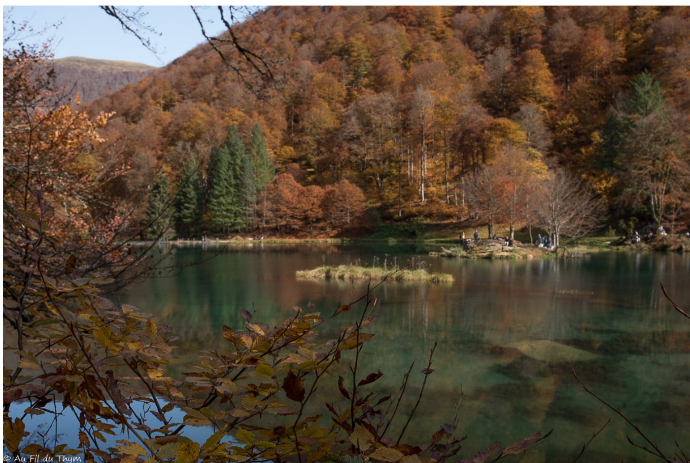
Sous les rayons de soleil, les feuilles de hêtre prennent des teintes dorées.