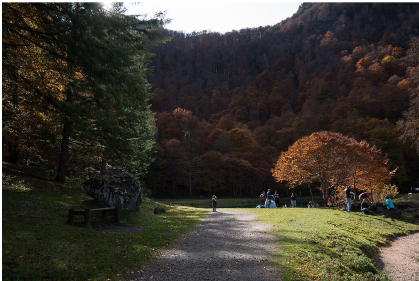
Passer de l'autre côté