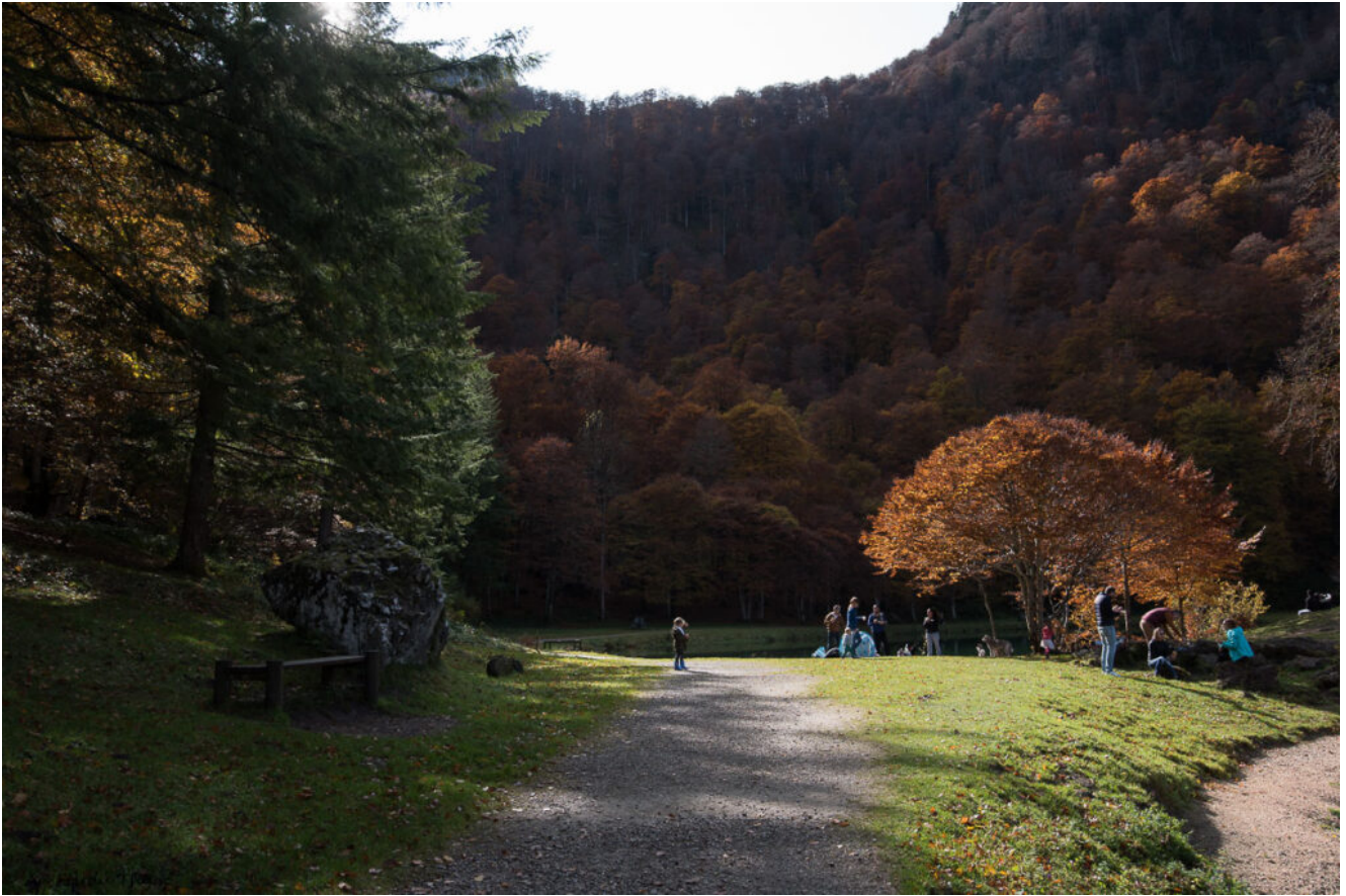
Passer de l'autre côté