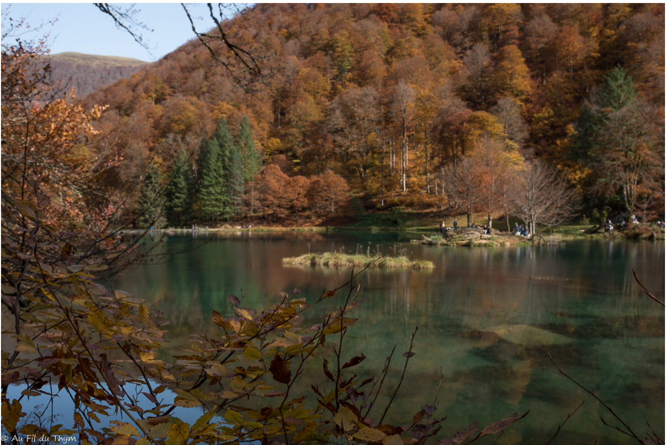
Sous les rayons de soleil, les feuilles de hêtre prennent des teintes dorées.