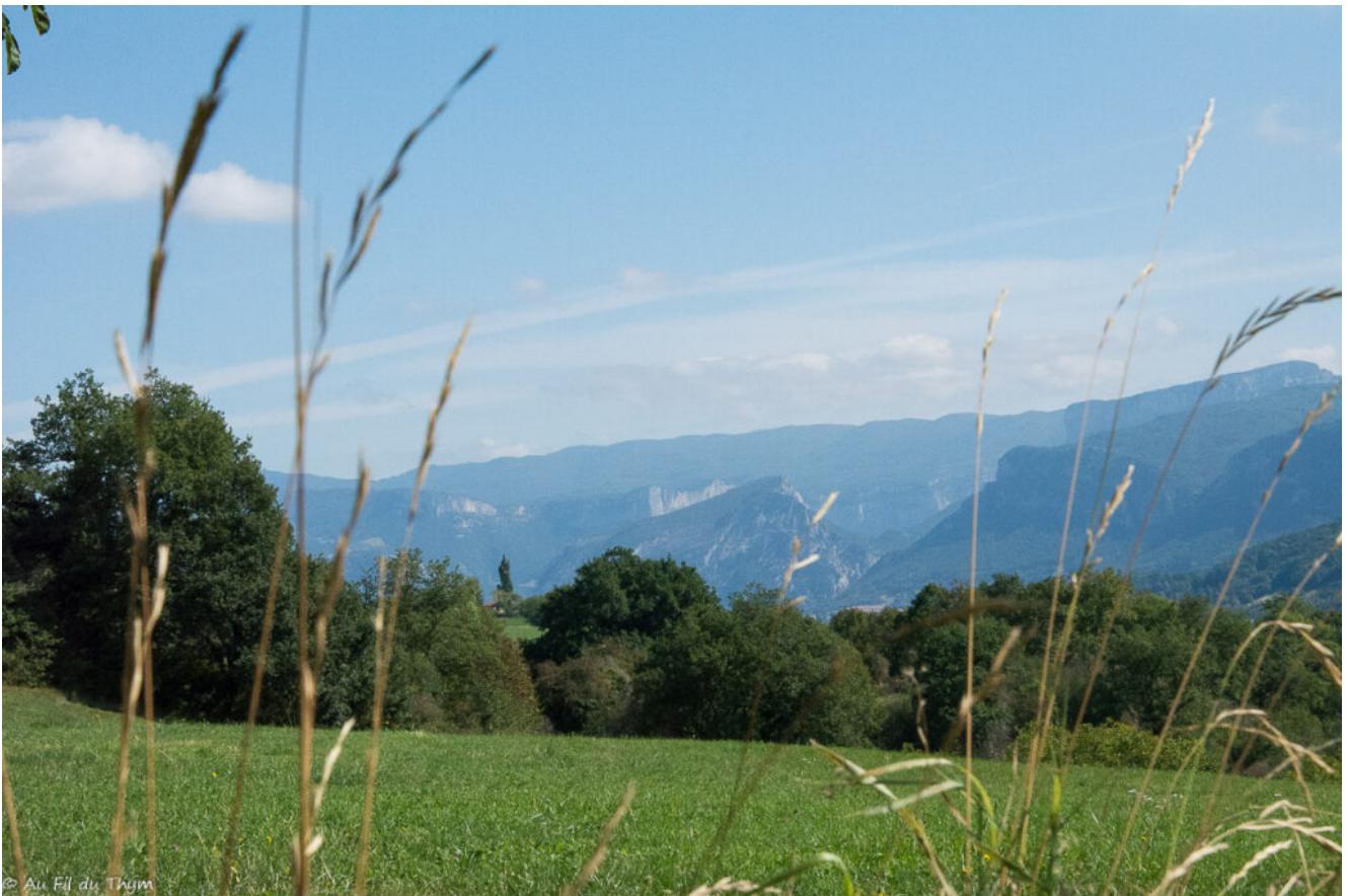
Arbres rangés dans les prairies alors que nous sommes sur les derniers mètres de la balade. Il plane ici une impression de