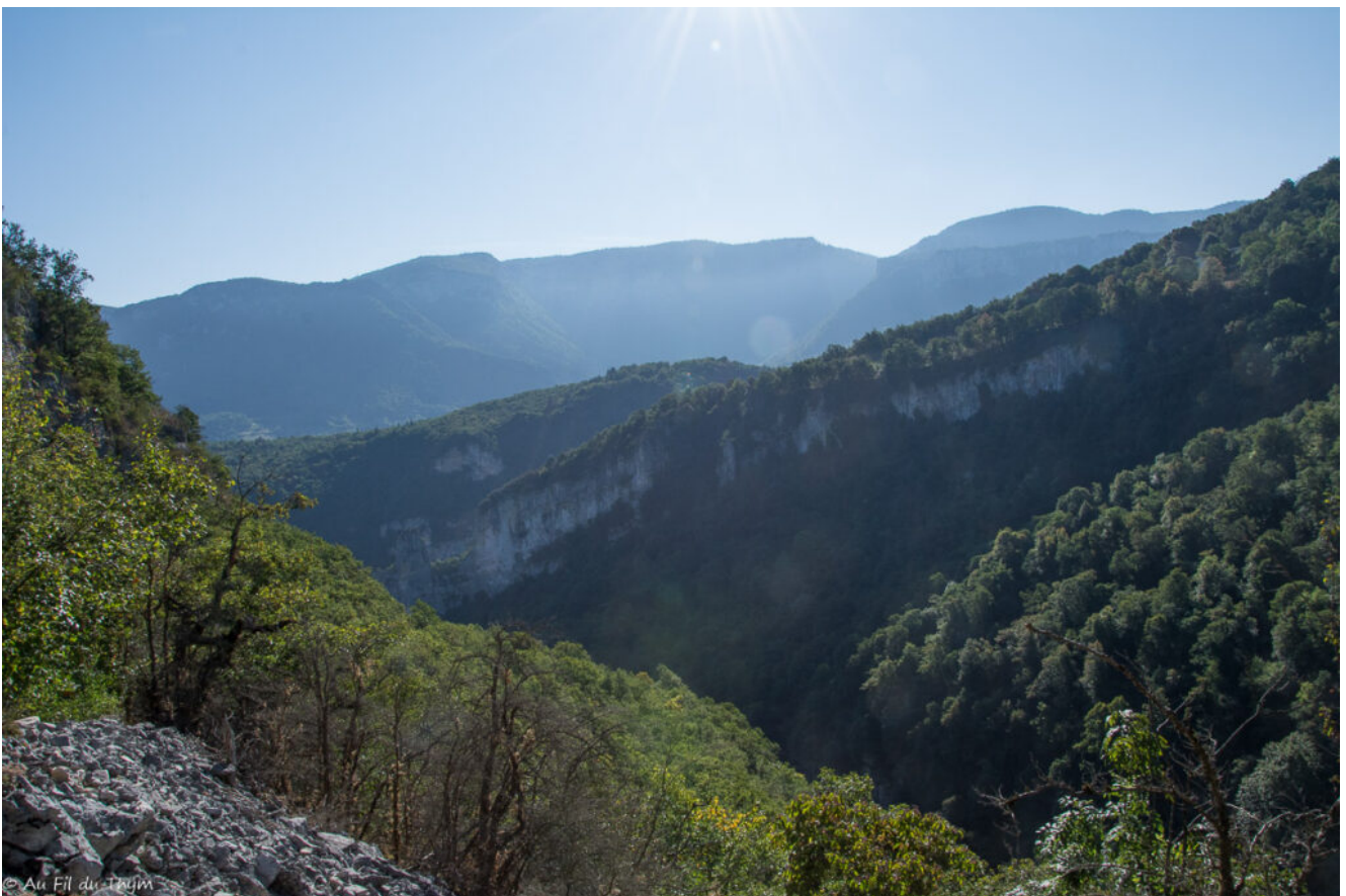
Marcher un moment sur la crête