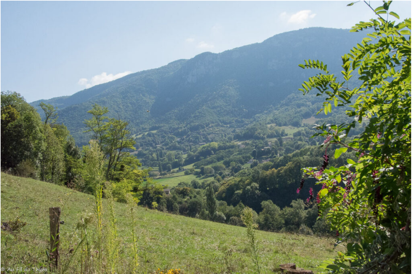
Immensité des paysages sur le vert de la fin d'été..