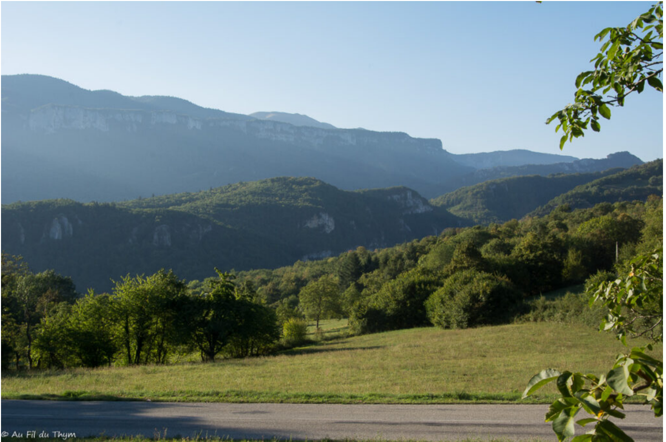
Avant de déboucher devant les falaises