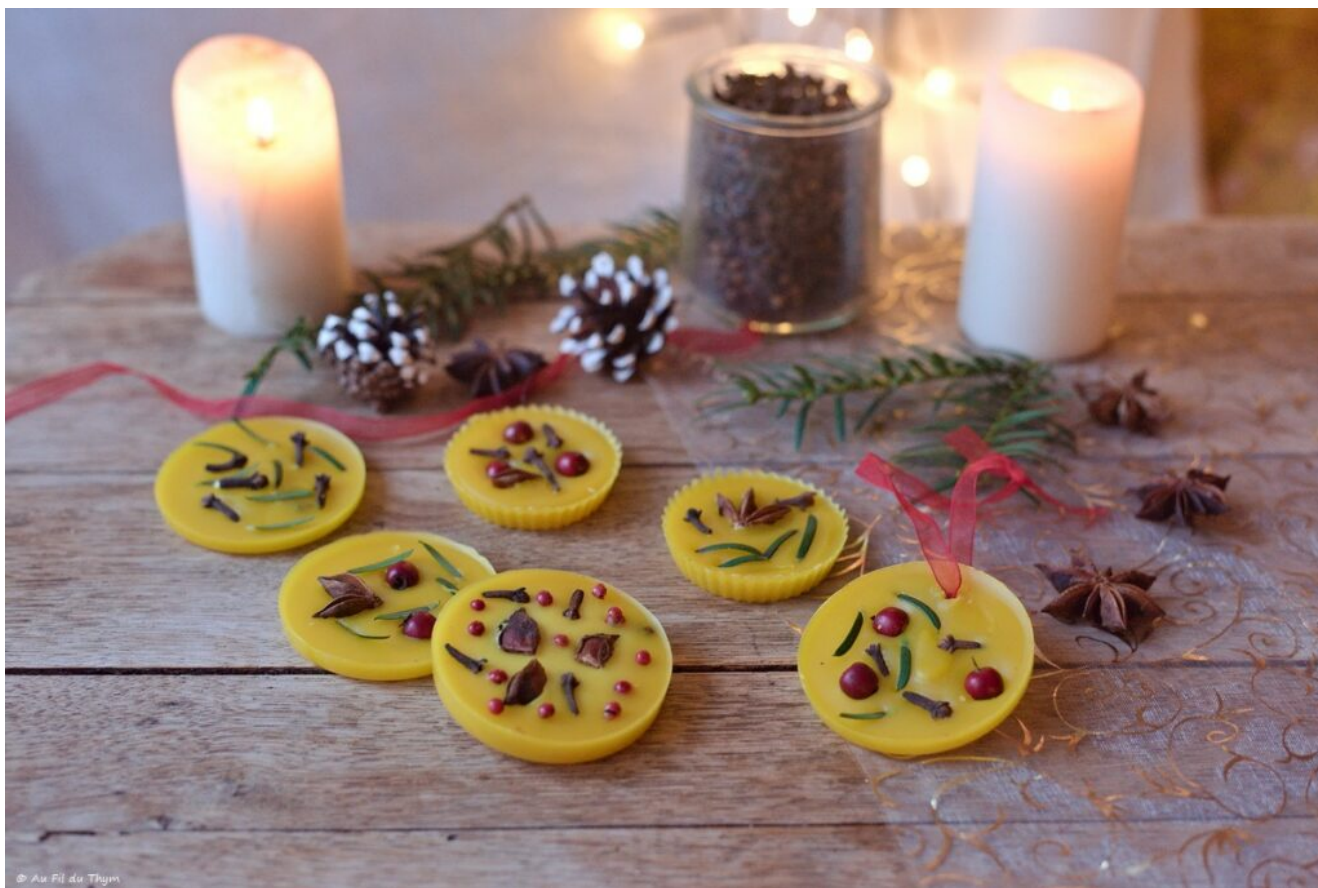
Palets de cire parfumés maison – Au Fil du Thym