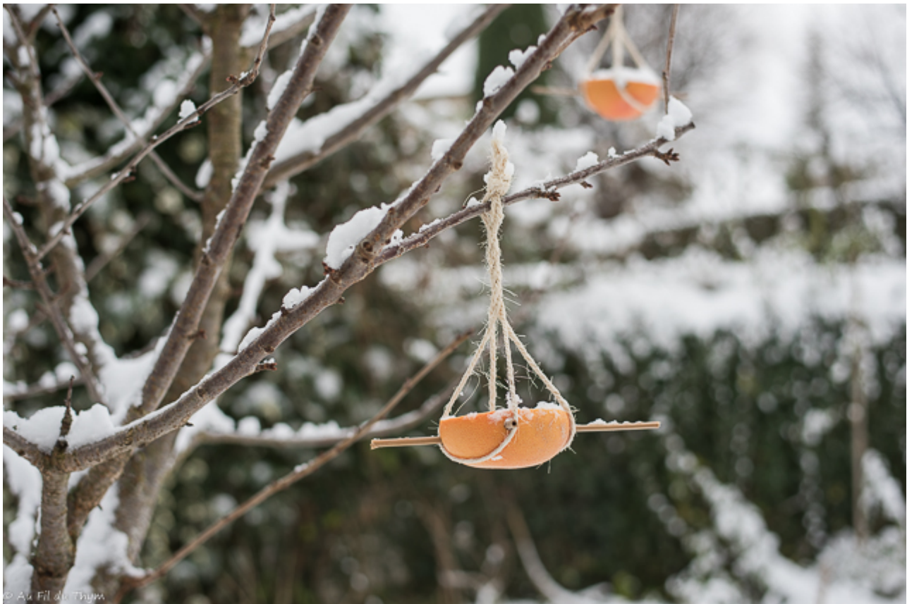
Mangeoire oiseaux facile