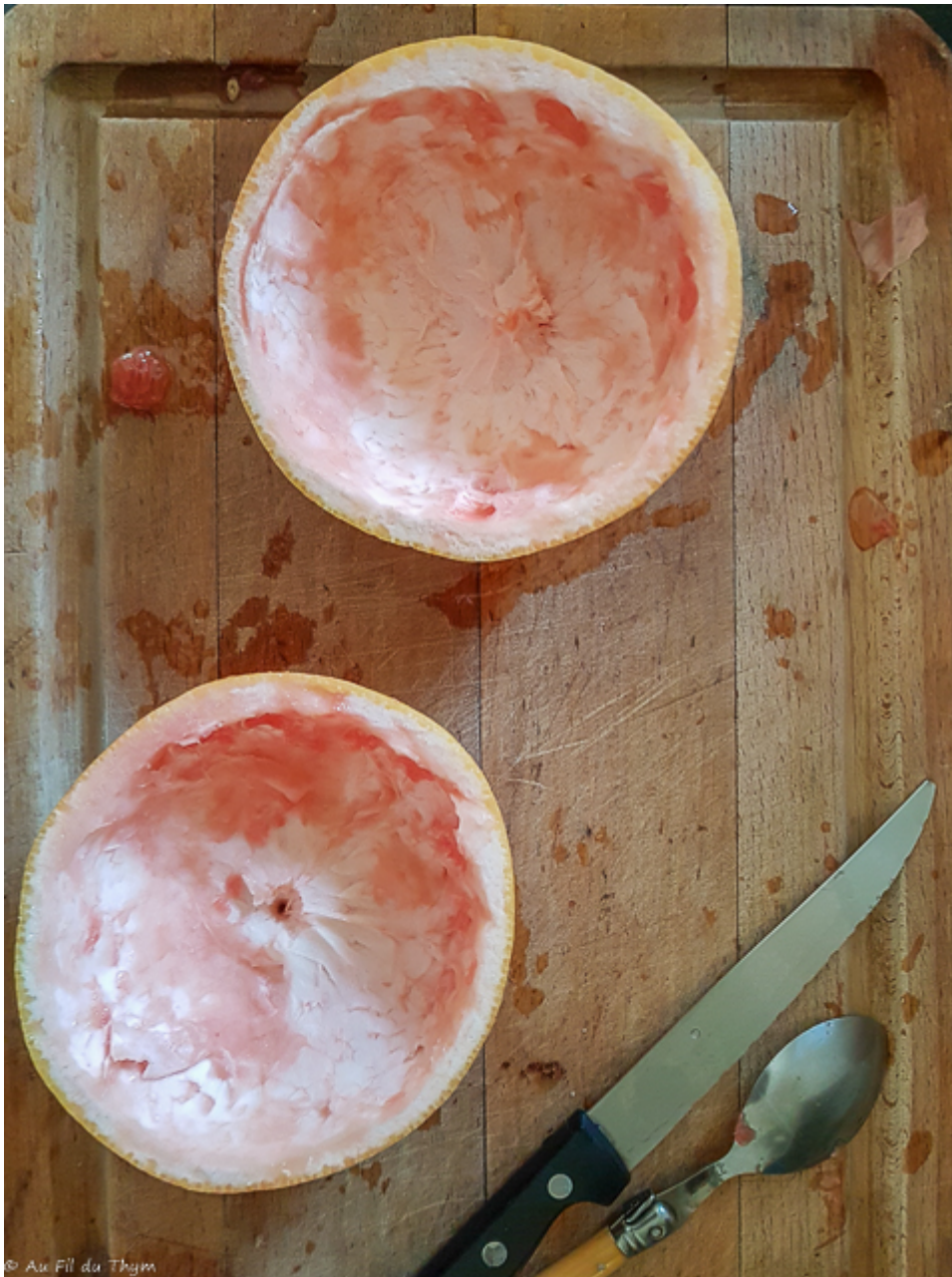
Vider les pamplemousse