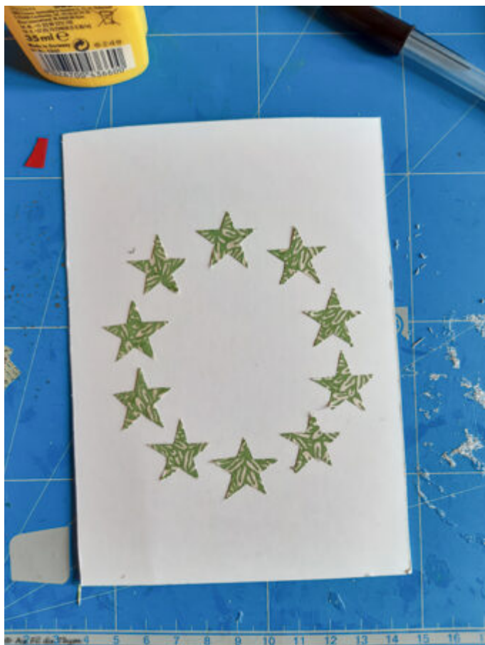
Exemple de collage