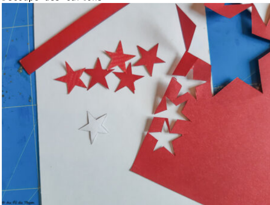
Découpe des motifs