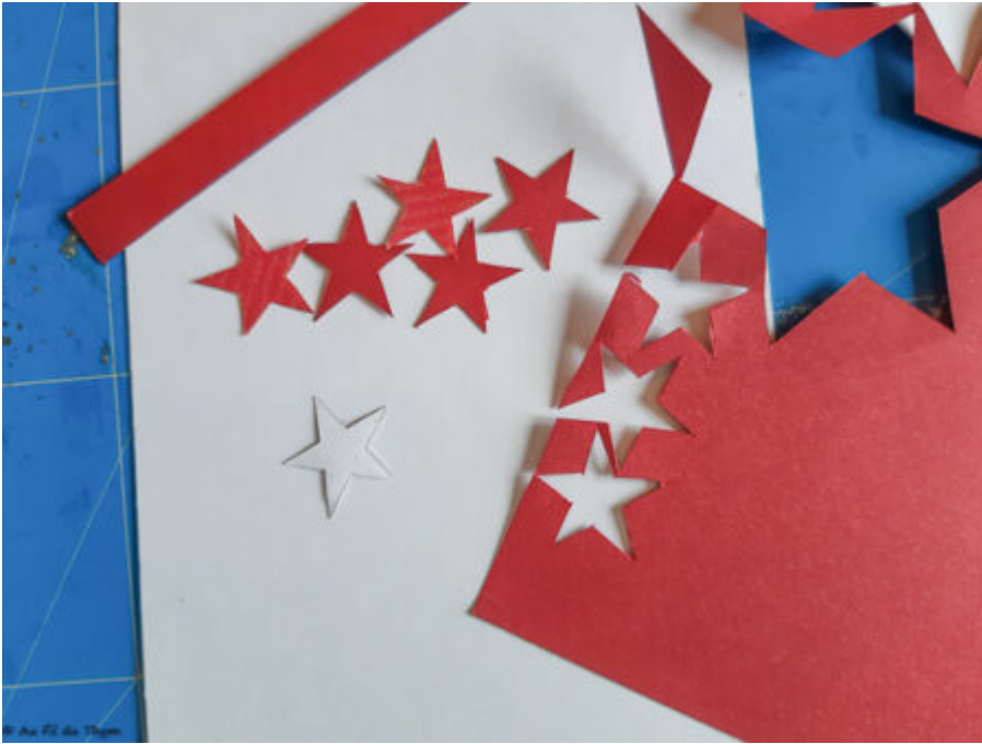
Découpe des motifs