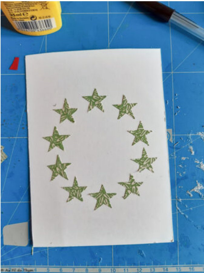
Exemple de collage