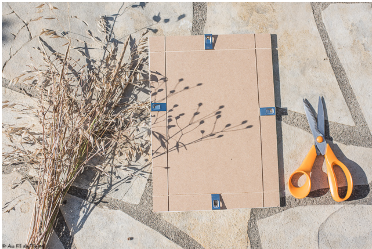
© Au Fil du Temps Matériel