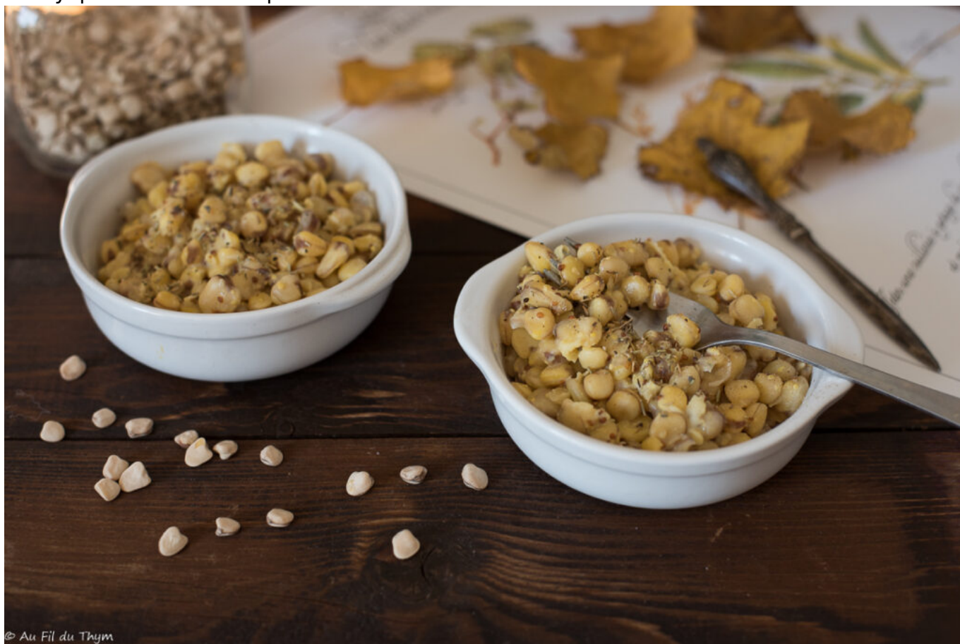
Curry pois carrés et poireaux