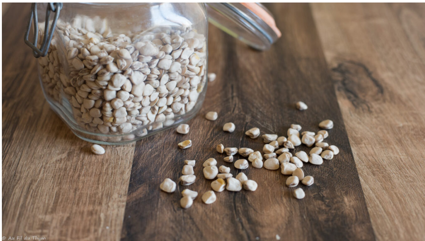
Pois carrés (secs)