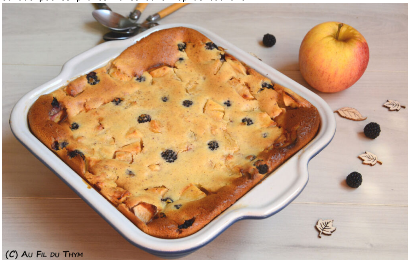
Clafoutis pomme mûre noisette