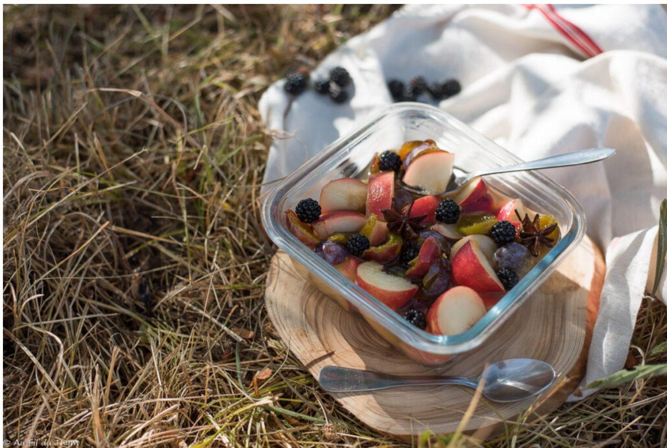
Salade pêches prunes mûres au sirop de badiane