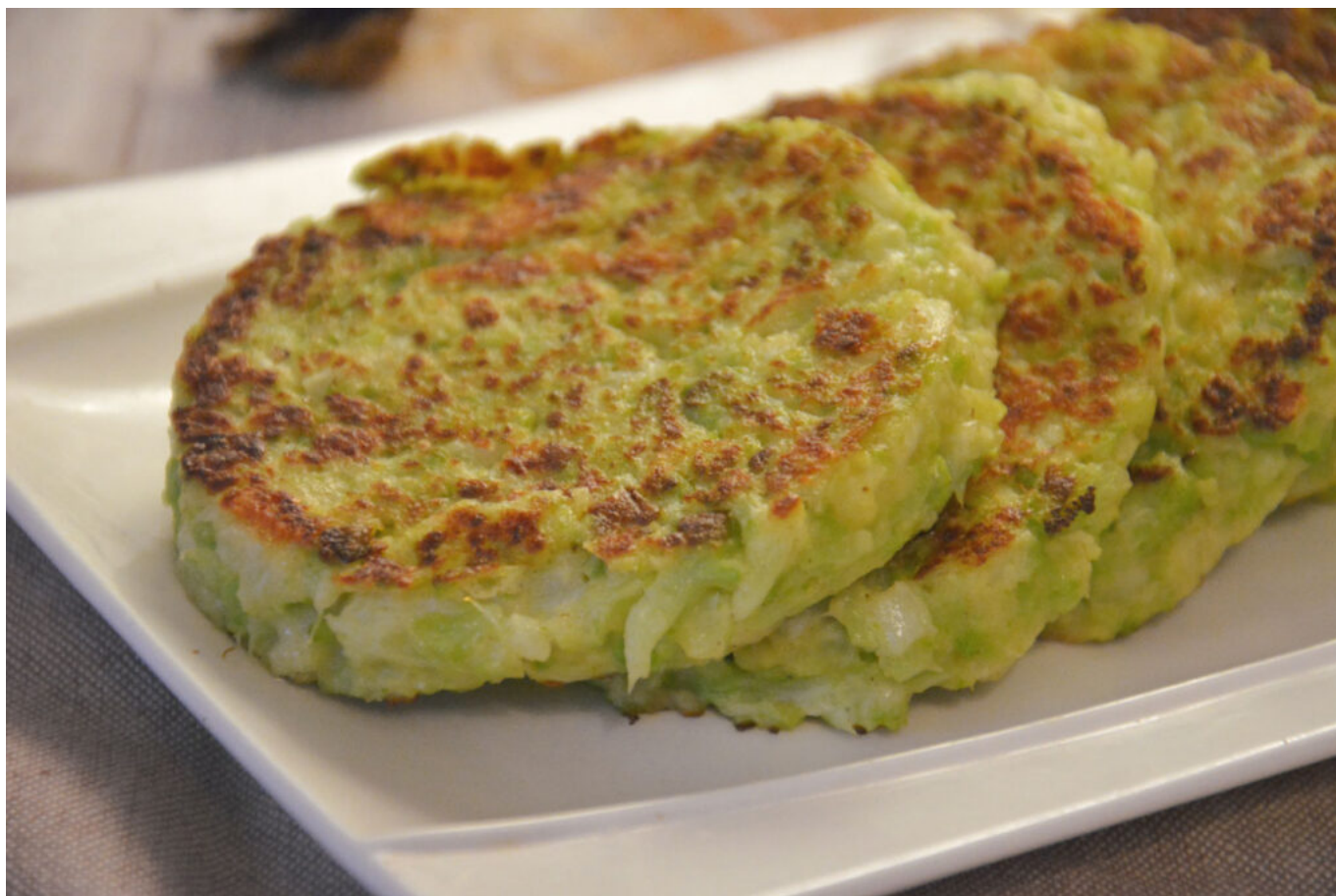
Galettes de chou romanesco –