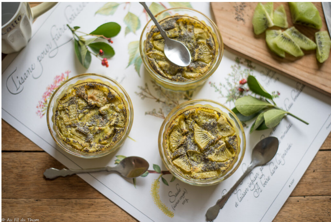
Clafoutis kiwi et graines de pavot