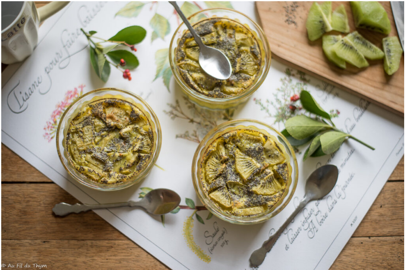
Clafoutis kiwi et graines de pavot