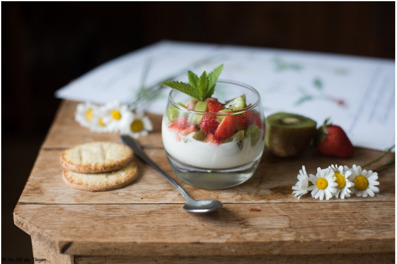
Verrines fraises kiwi et yaourt