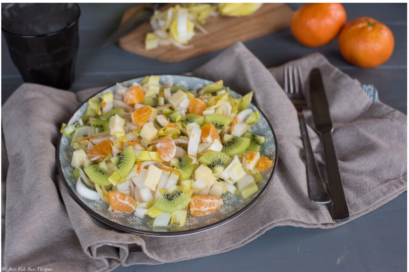
Salade endives, kiwi, clémentine, gruyère