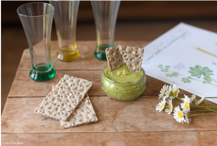
Tartinable de fèves

« houmous », en apéritif printanier garanti.