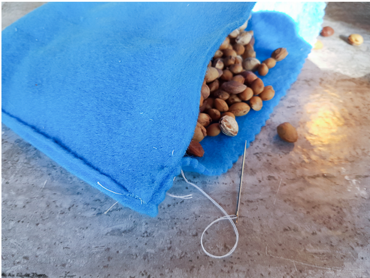
Pochette à noyeux