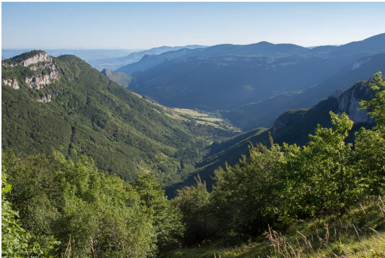
Avec les douces teintes du matin