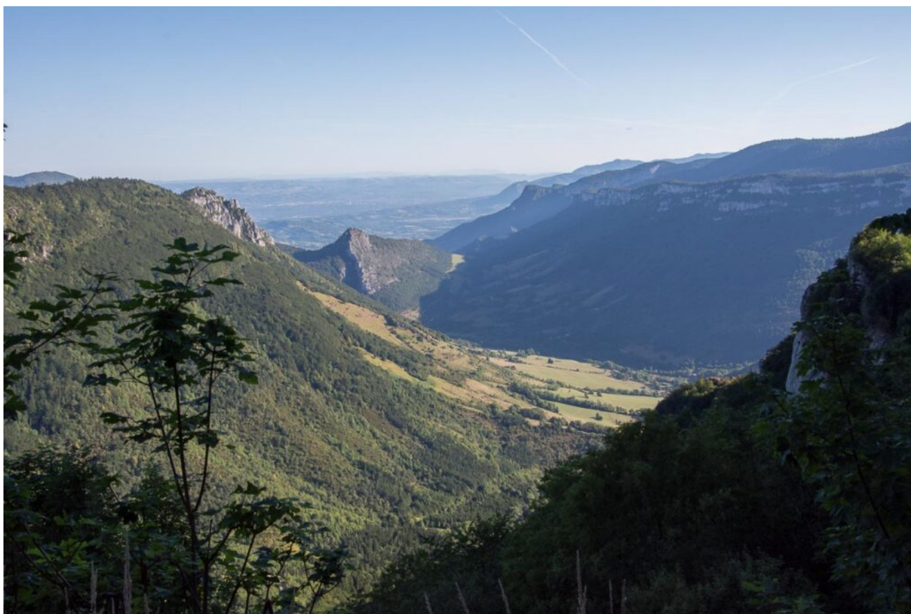
Nous contournons le Roc de Touleau par le sud et entrons dans les bois