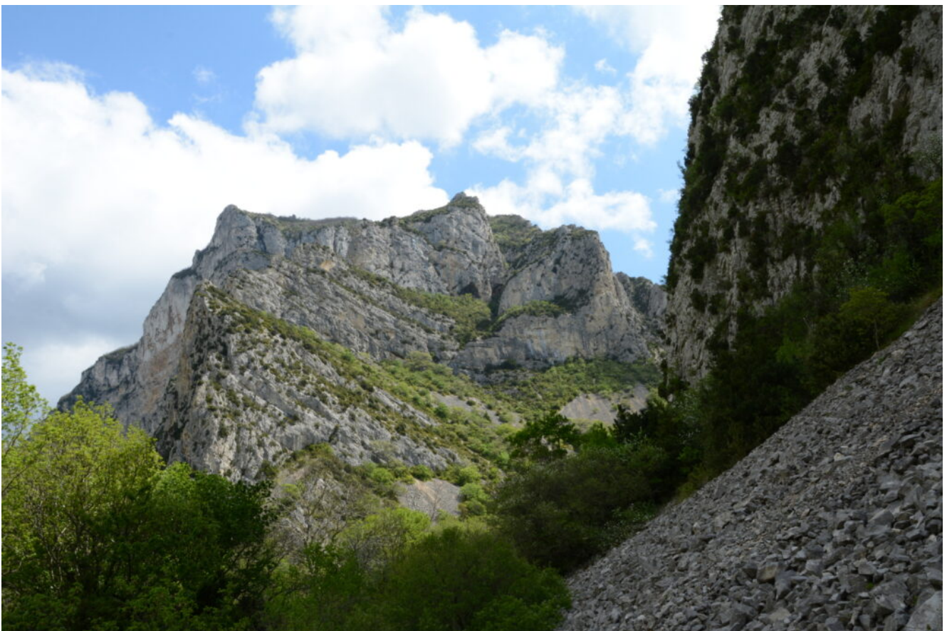
Plus loin, se révèle l'étonnant contraste étonnant entre vert tendre du printemps et le gris des pierres