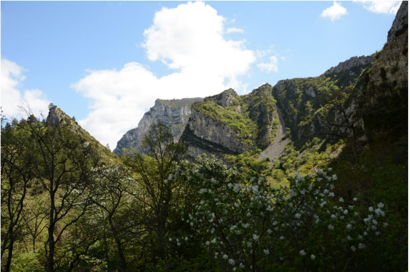
Le chemin s'étend à flanc de falaise, longeant les éboulis