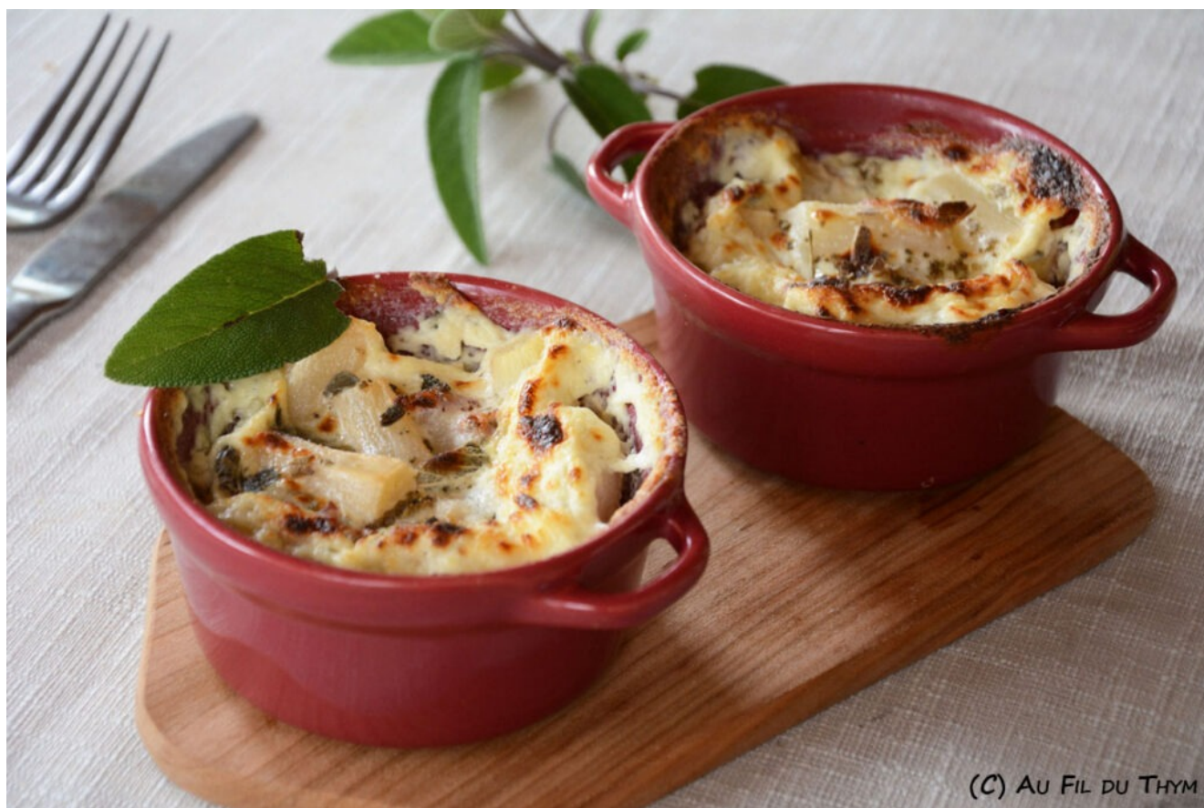
Gratin de salsifis à la sauge et lard fumé

J'avais donc envie de partager cette idée avec vous. Si vous ne trouvez pas de salsifis frais (c'est assez rare), vous pouvez toujours opter pour l'option en boîte de conserve. Cela aura toujours le mérite d'être plus rapide à préparer ; ). Bonne journée