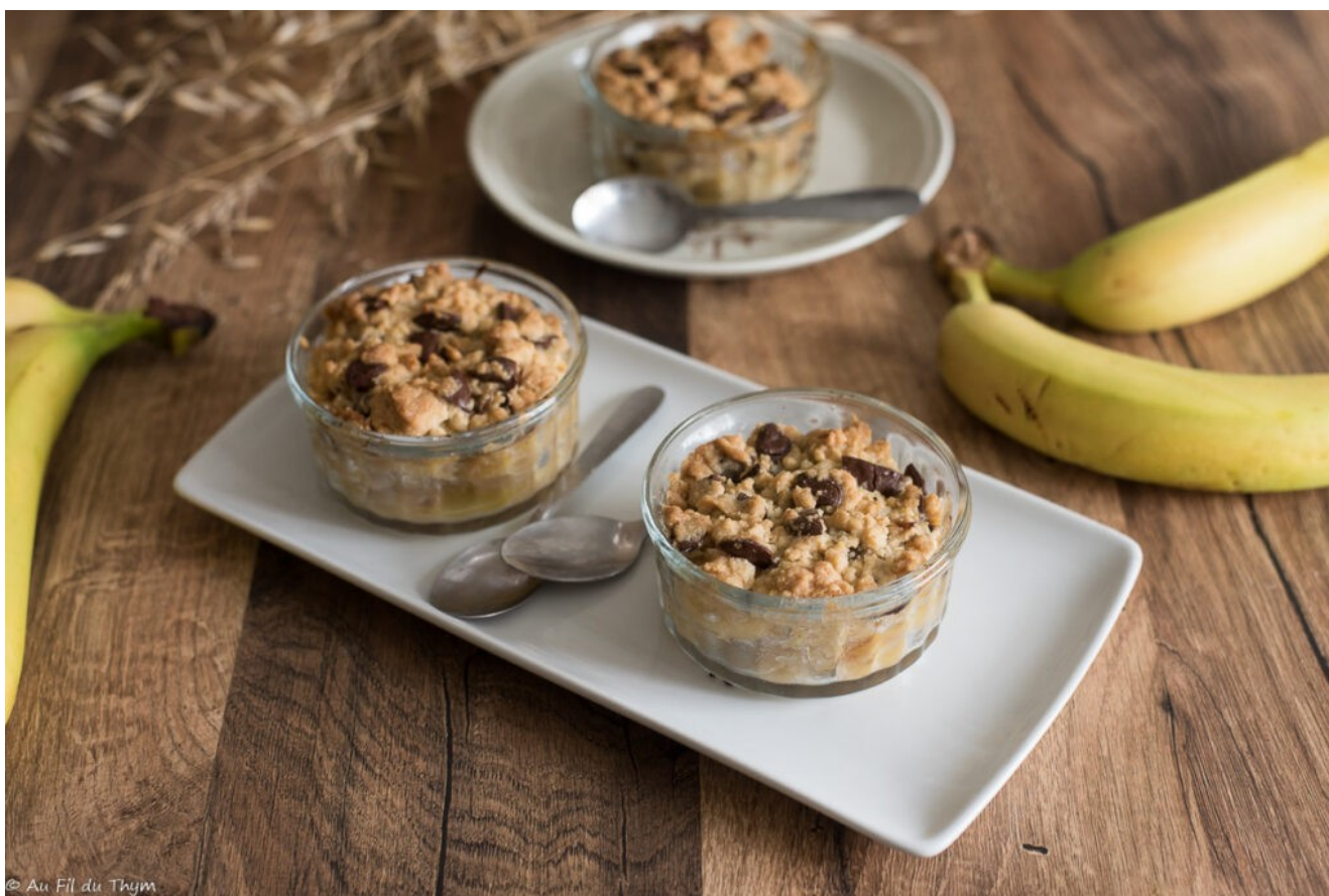
Crumble banane chocolat