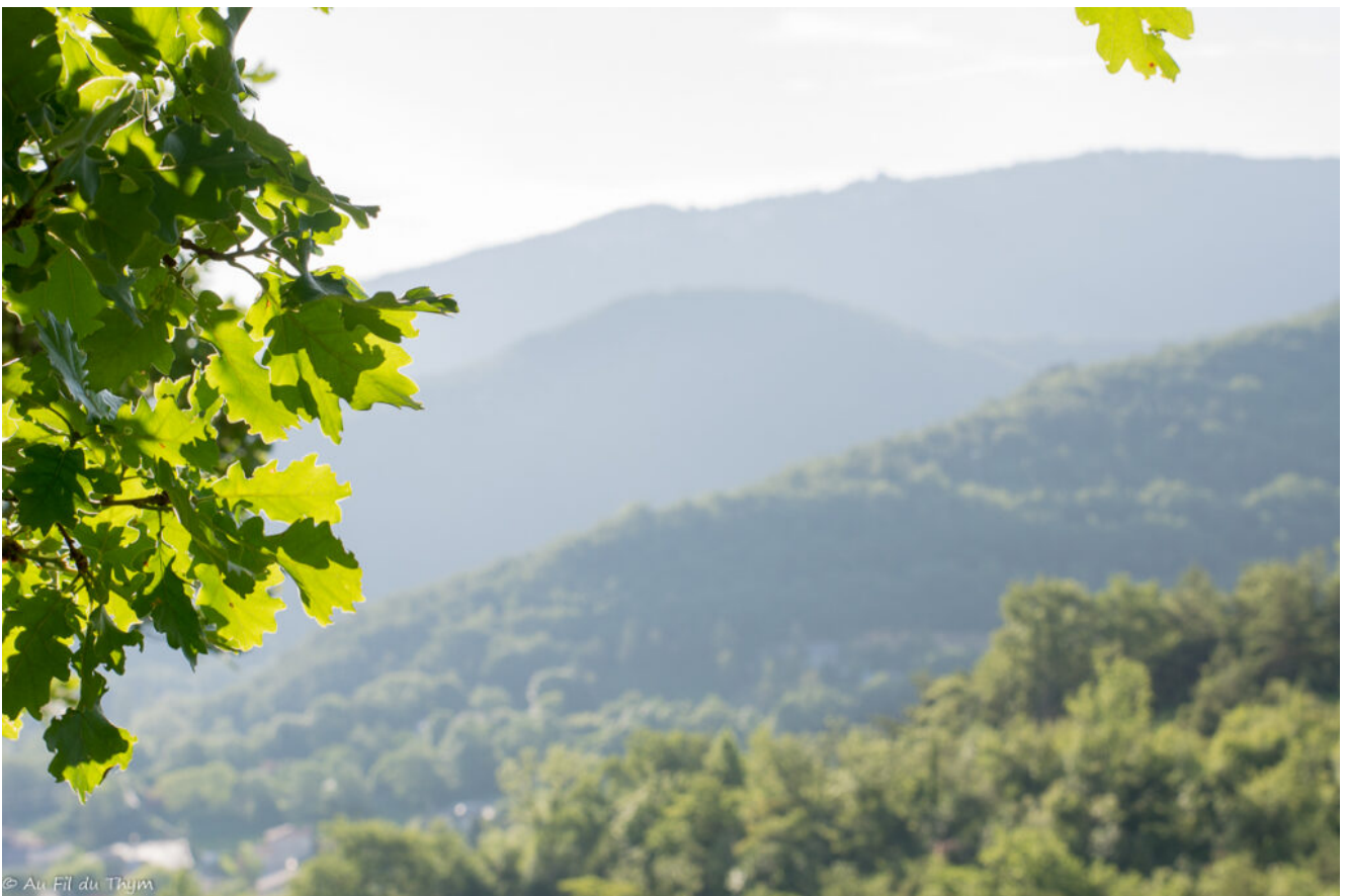
Arrivée en haut, je tombe sur une nouvelle prairie où s'éclatent les orchidées. Comme ces ophrys bécasses