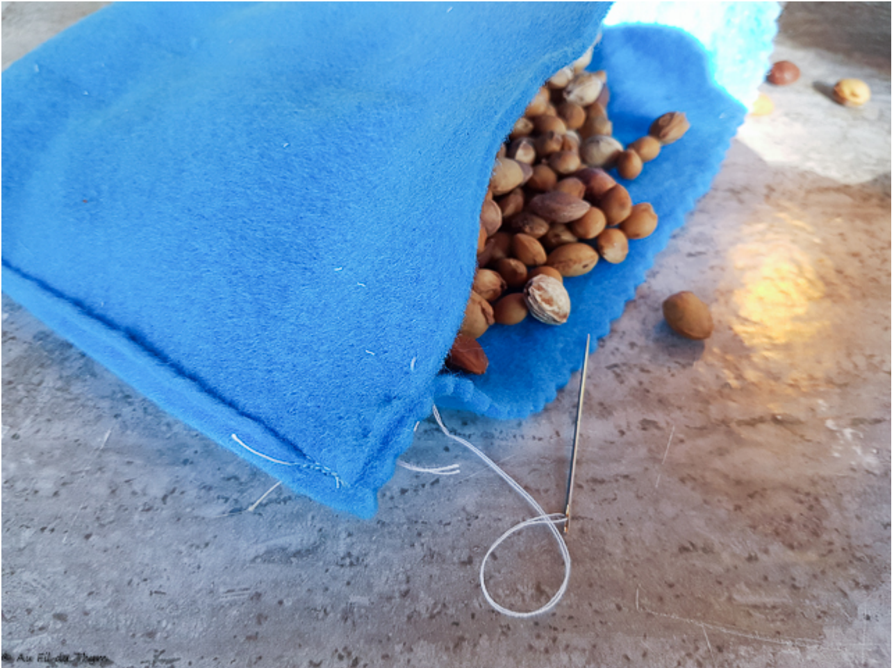
Pochette à noyeux