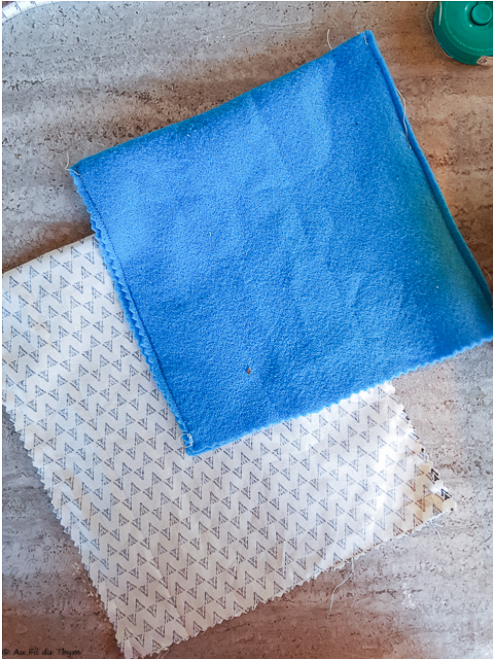
Pliage et couture