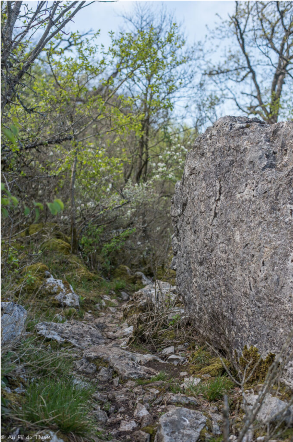
Sous l'œil bienveillant des amélanchiers en fleurs