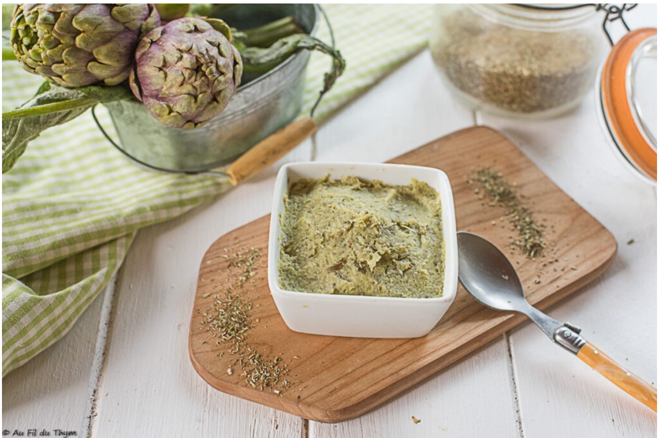
Caviar d'artichauts (tartina)