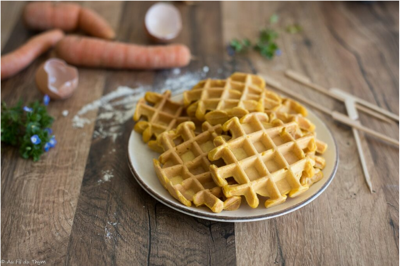
Gaufres aux carottes salées