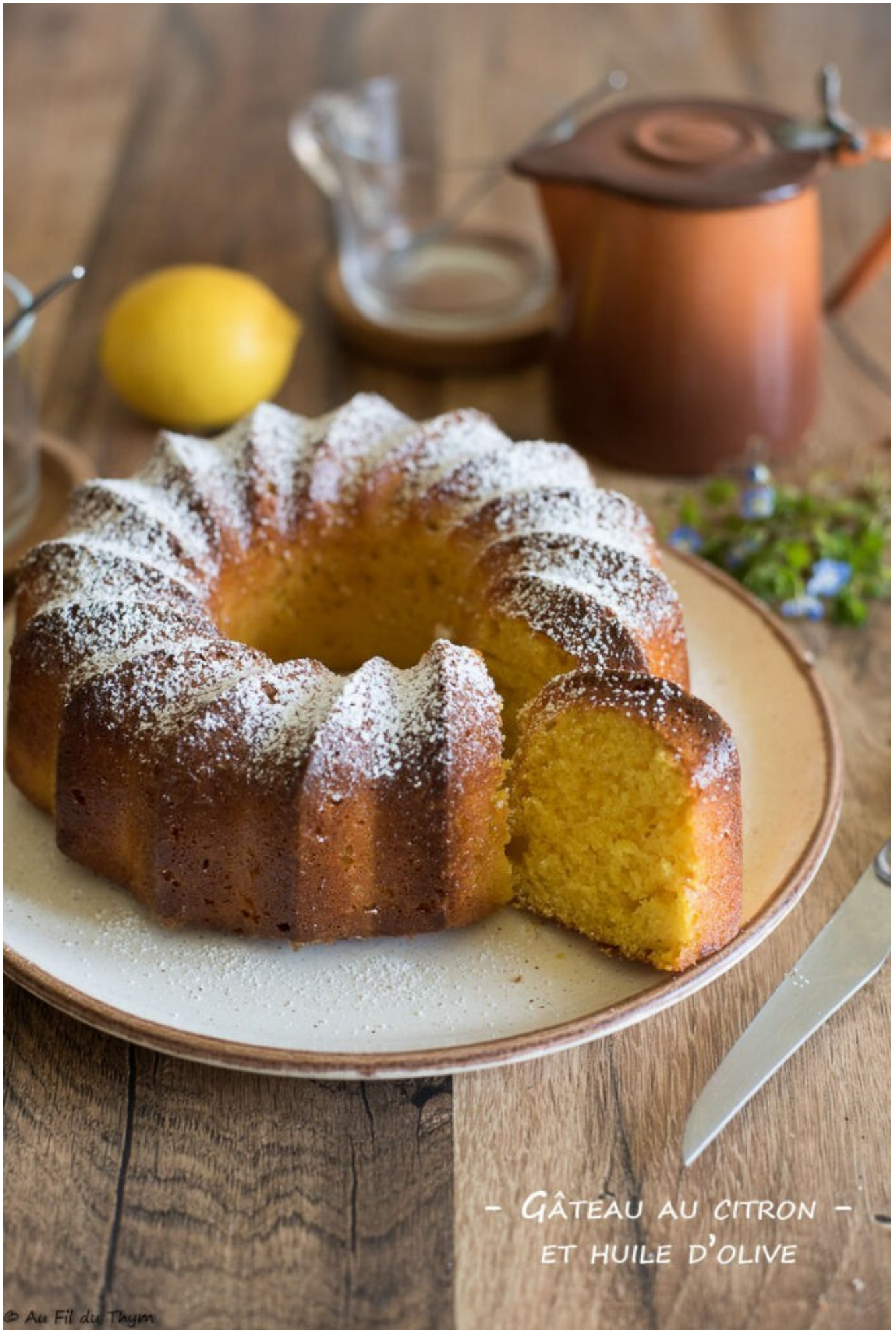
- GÂTEAU AU CITRON - ET HUILE D'OLIVE