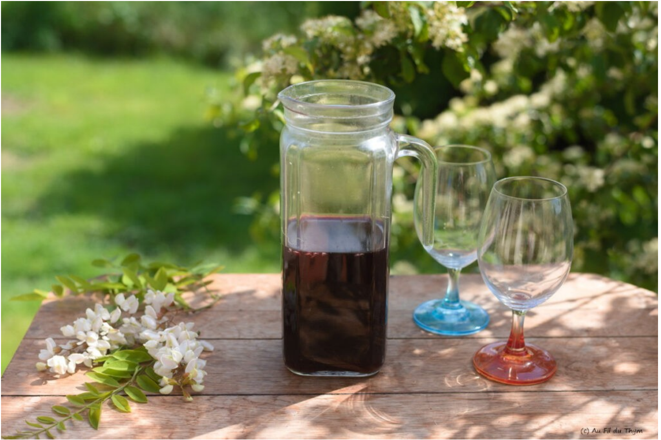
Sirop acacia raisin cru