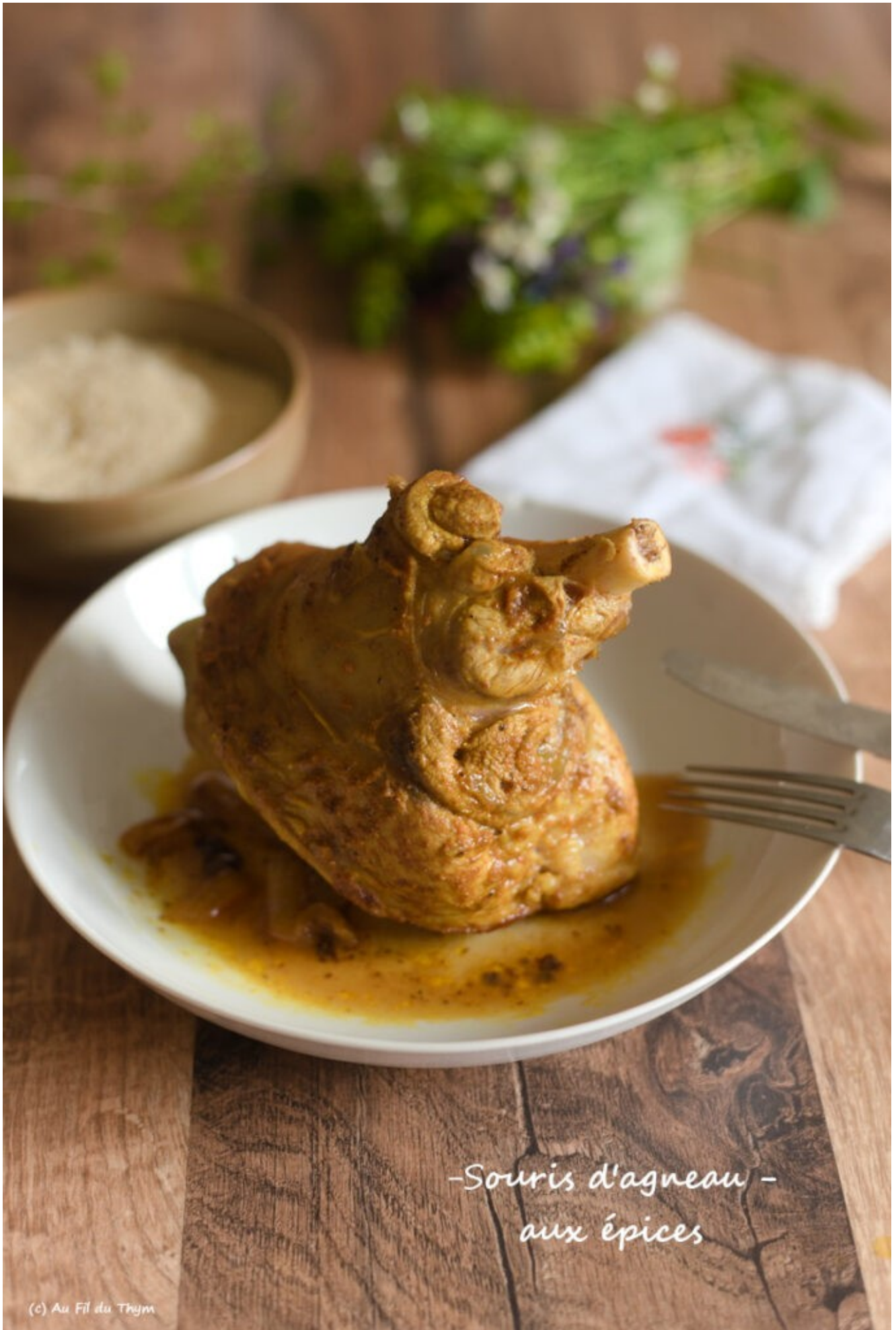
- Souris d'agneau - aux épices