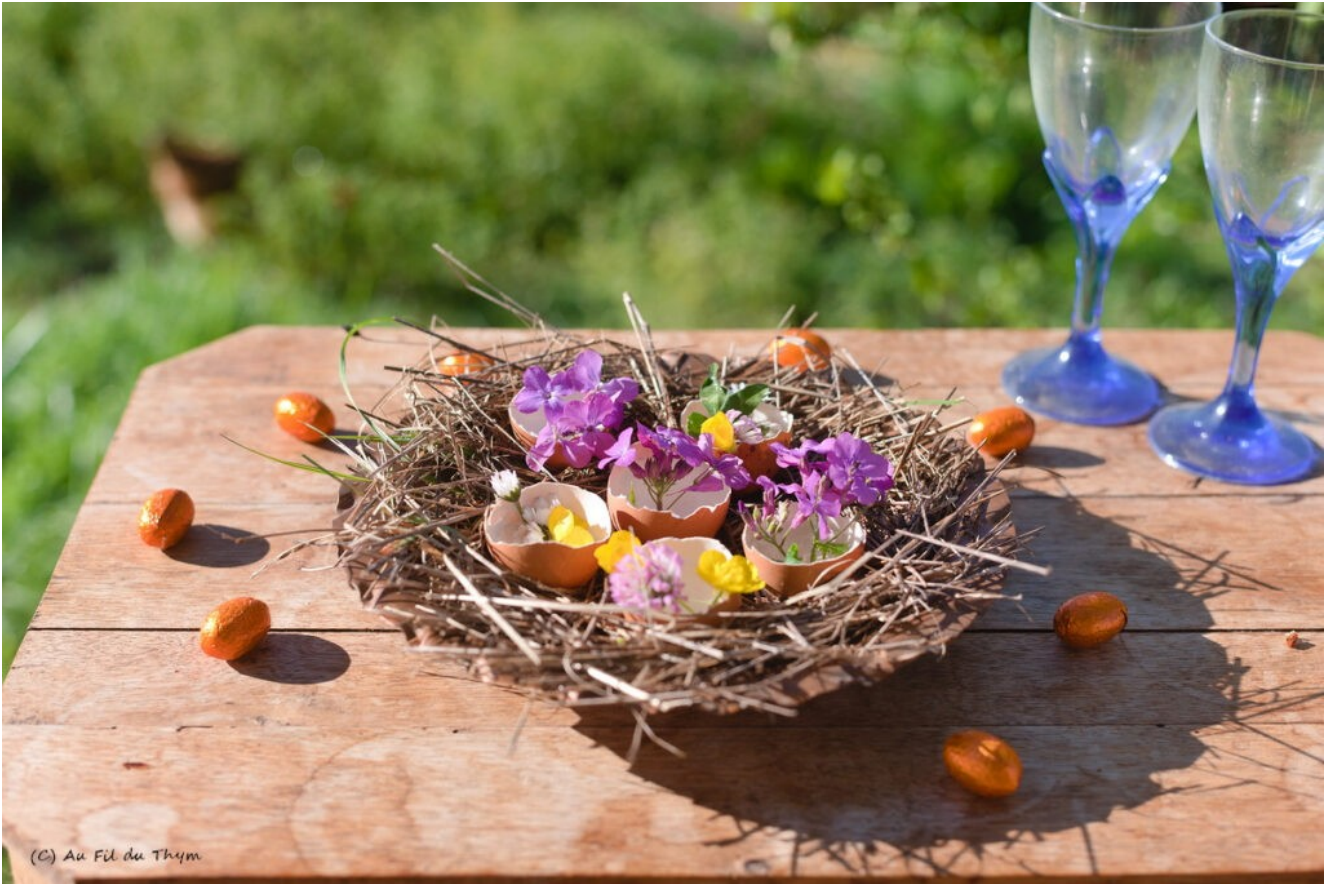
Décoration de table pour Pâques