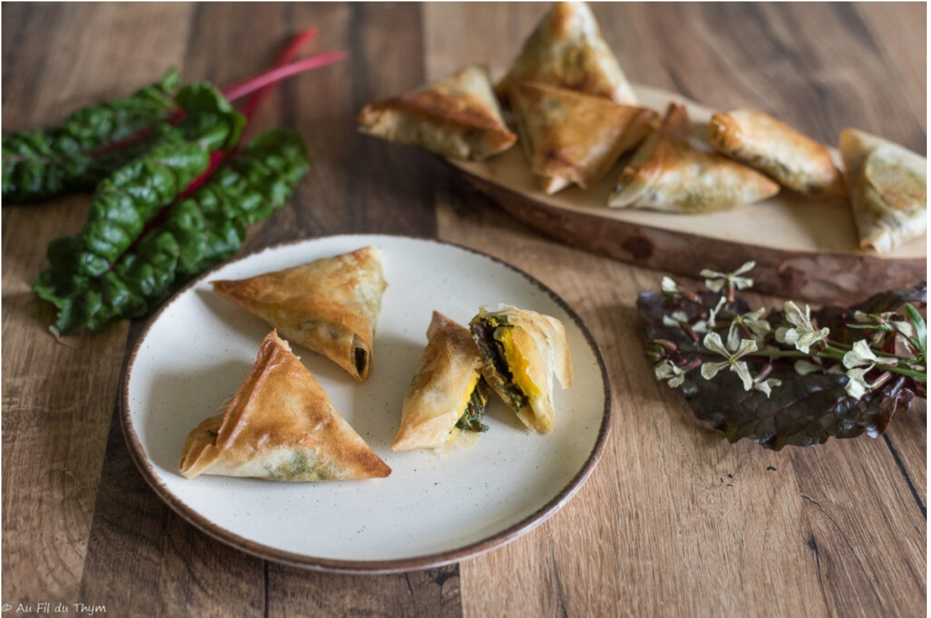
Samoussas blettes œufs