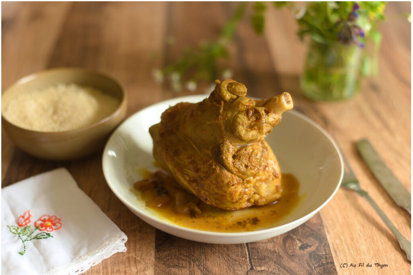
Souris d'agneau à l'orientale

adapter à votre convenance. Pour les plus jeunes, ne mettez pas de piment.