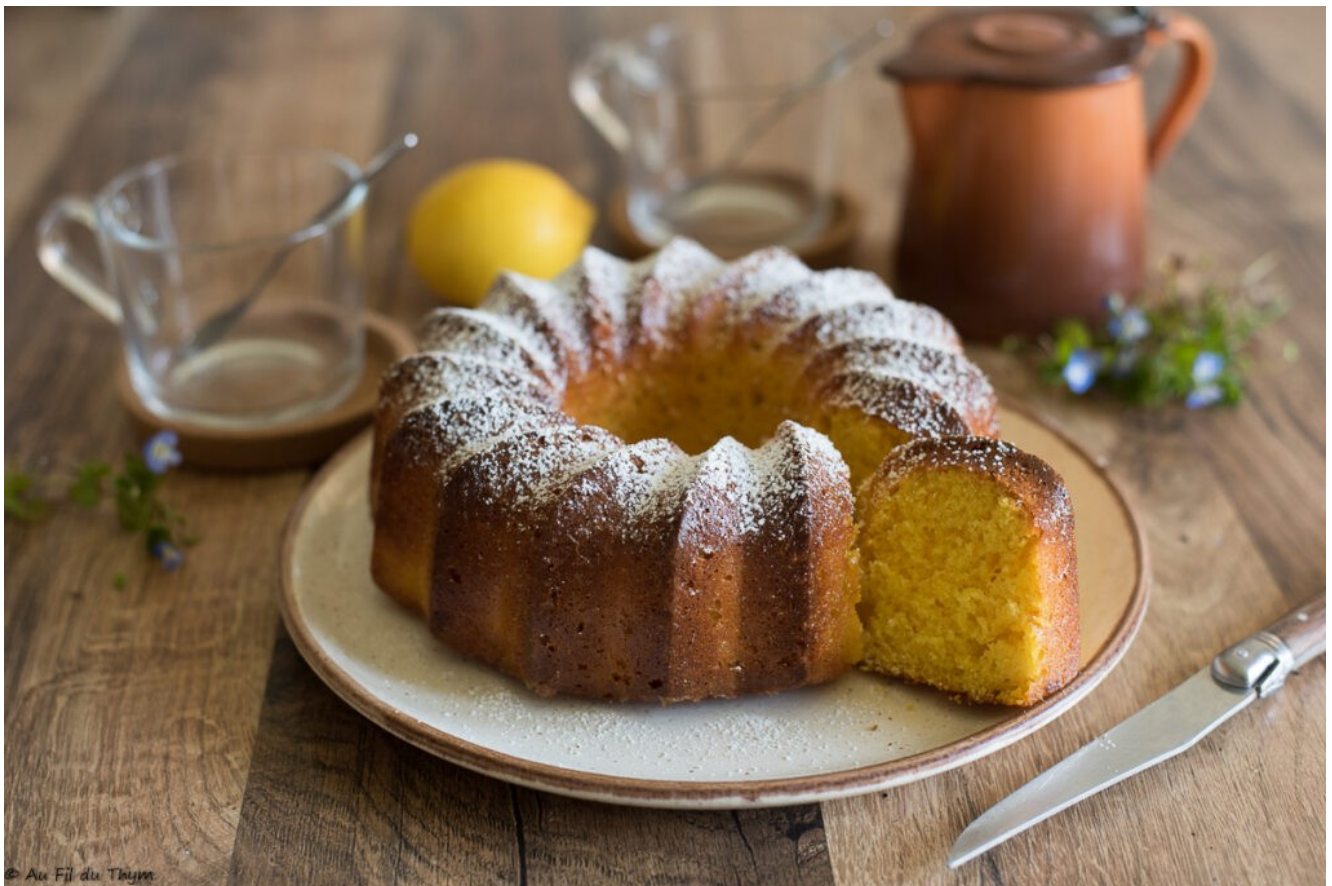
Gâteau citron huile d'olive