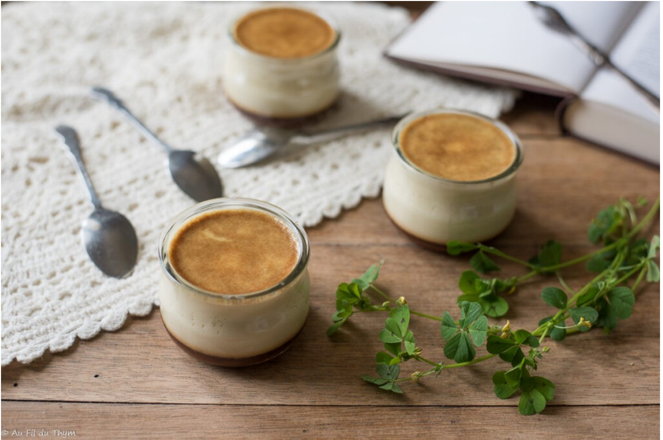
Crème caramel inratable