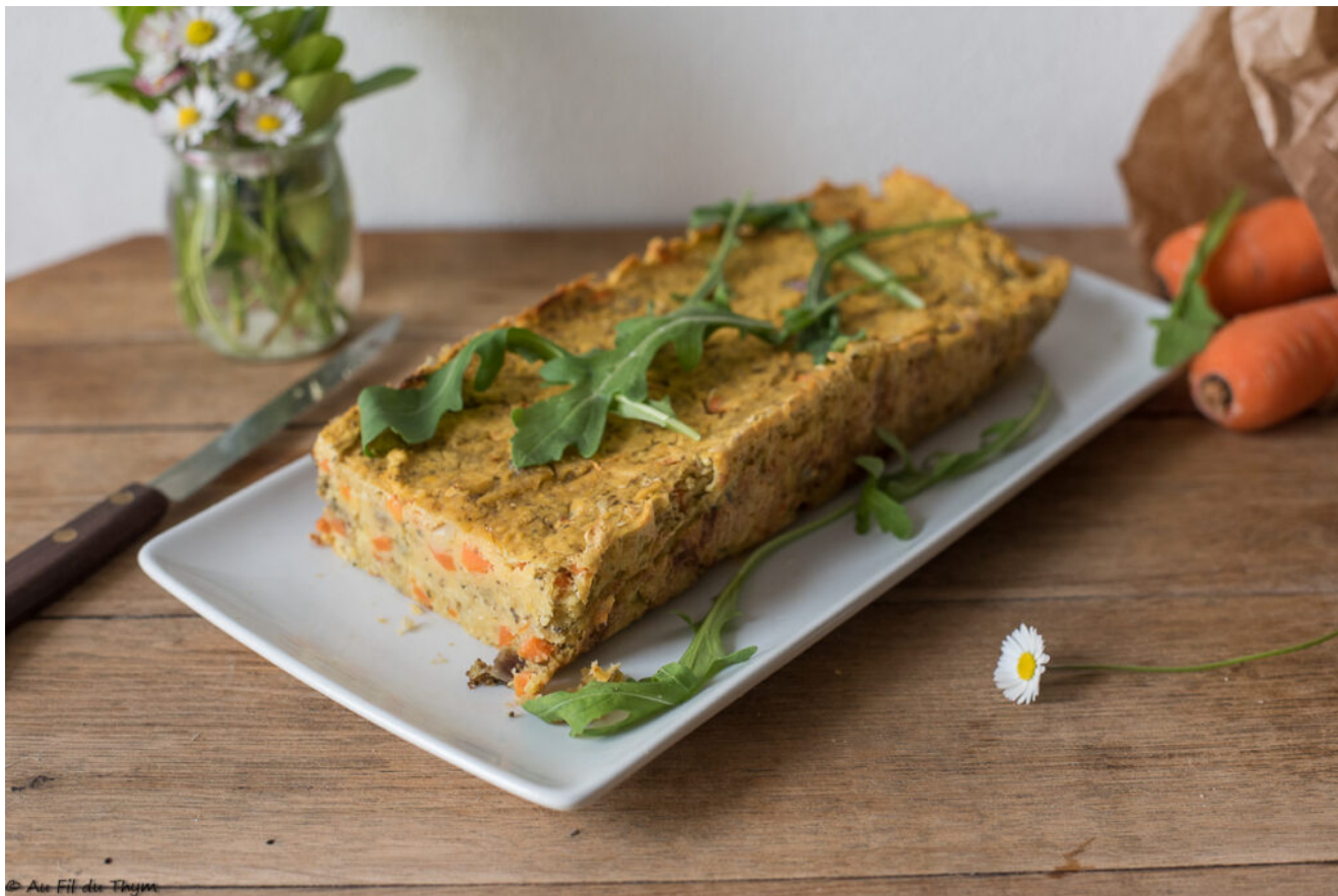
Terrine lentilles corail –