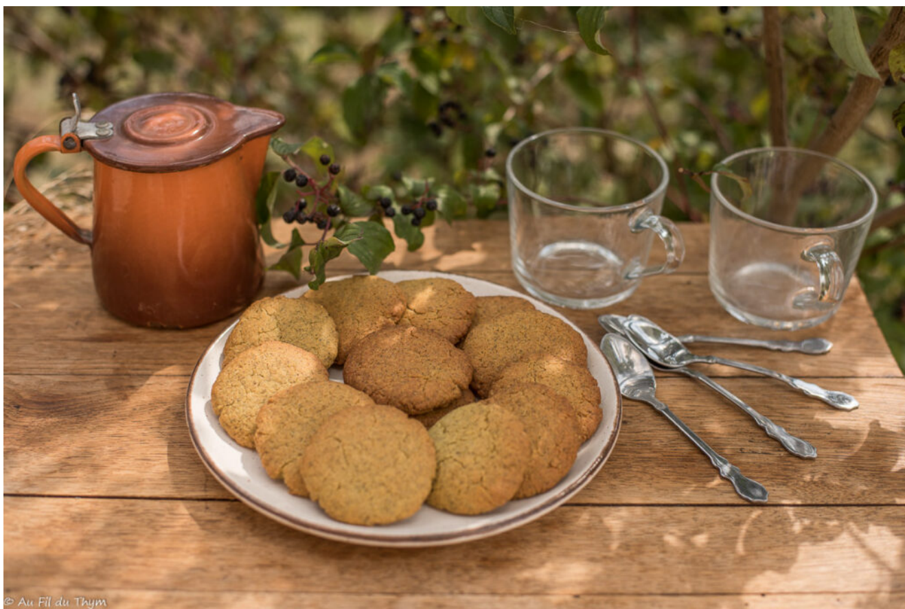
Sablés à la farine de lentilles

Sources de l'article : wikipédia : lentille cultivée