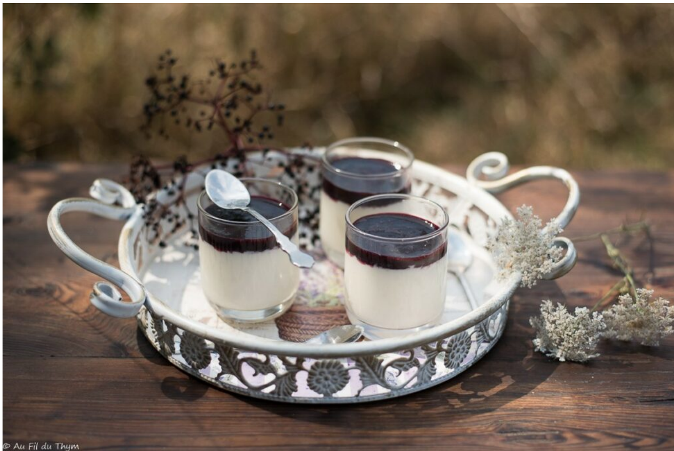
Panna-cotta au coulis de baies de sureau noir – Au Fil du Thym