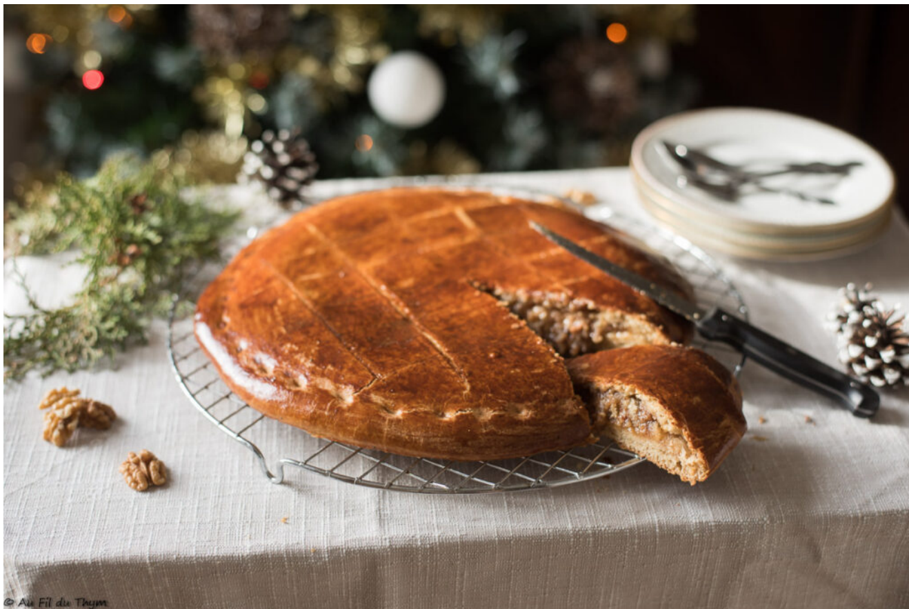
Galette des rois briochée