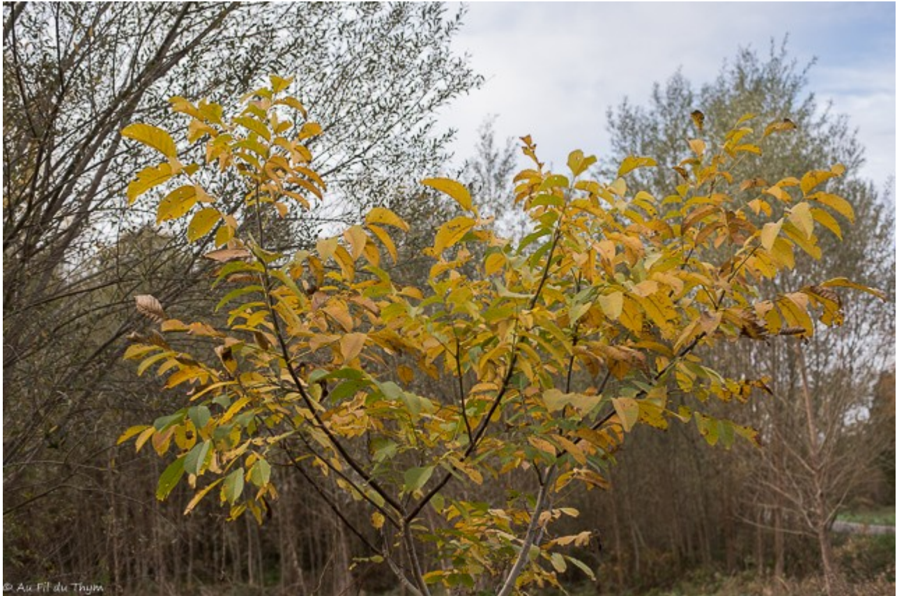
Jeune Noyer en feuillage d'automne