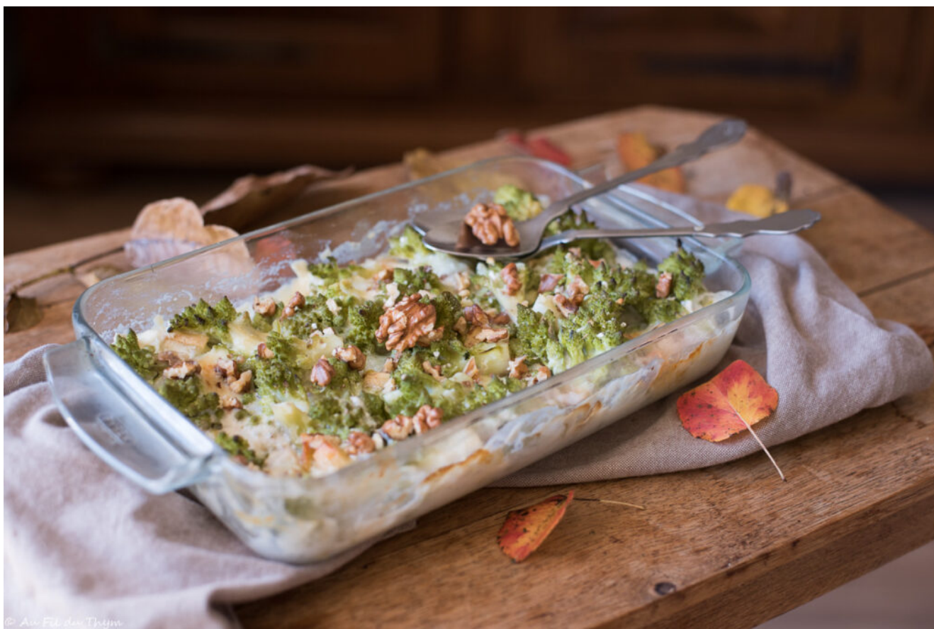
Gratin chou romanesco tomme noix