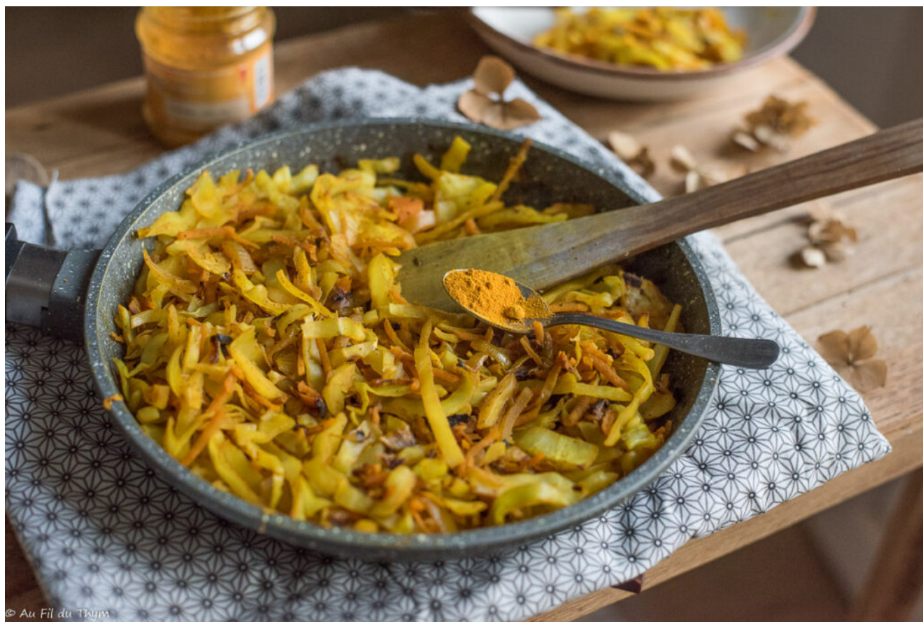
Chou blanc sauté au curcuma

C'est un chou blanc sauté au curcuma , librement inspiré des achards réunionnais. Vous l'avez dorez et déjà adopté. : )