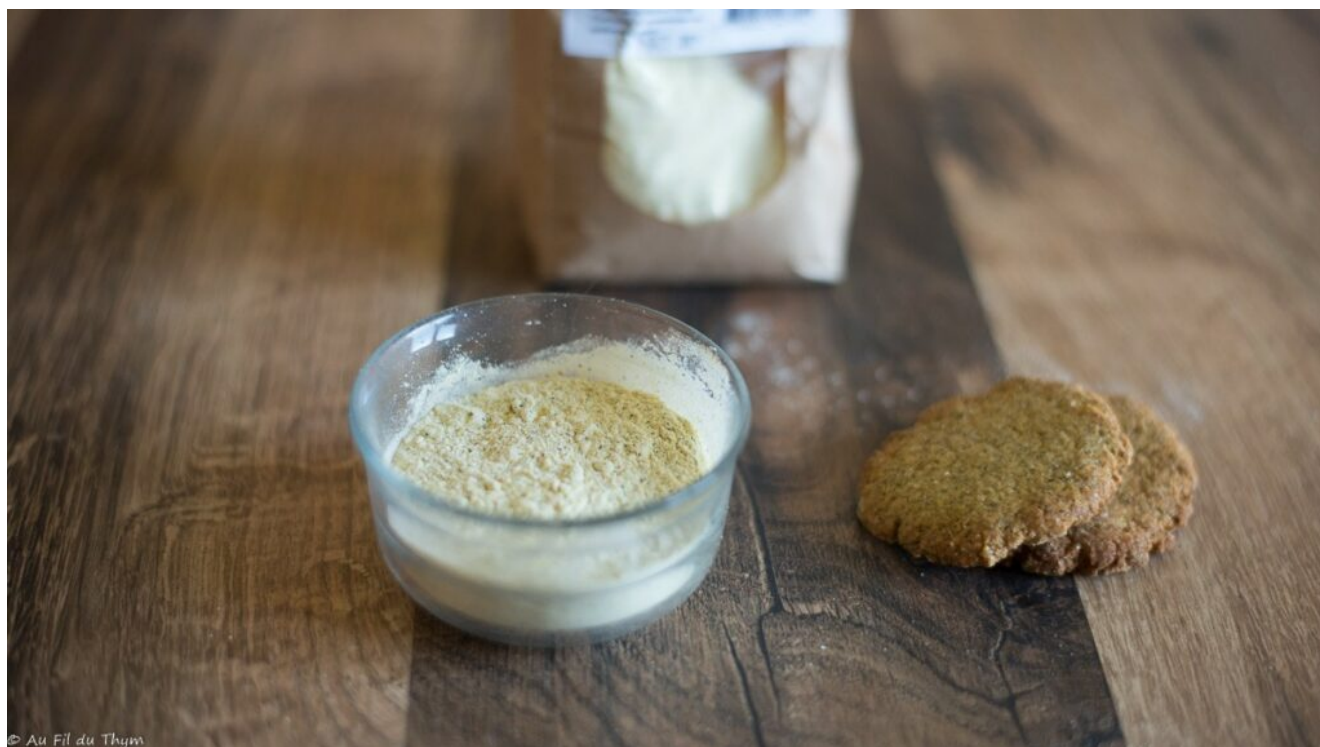
Farine de lentilles (vertes)

producteurs locaux. Elle se présente sous forme de sachets de 500g.