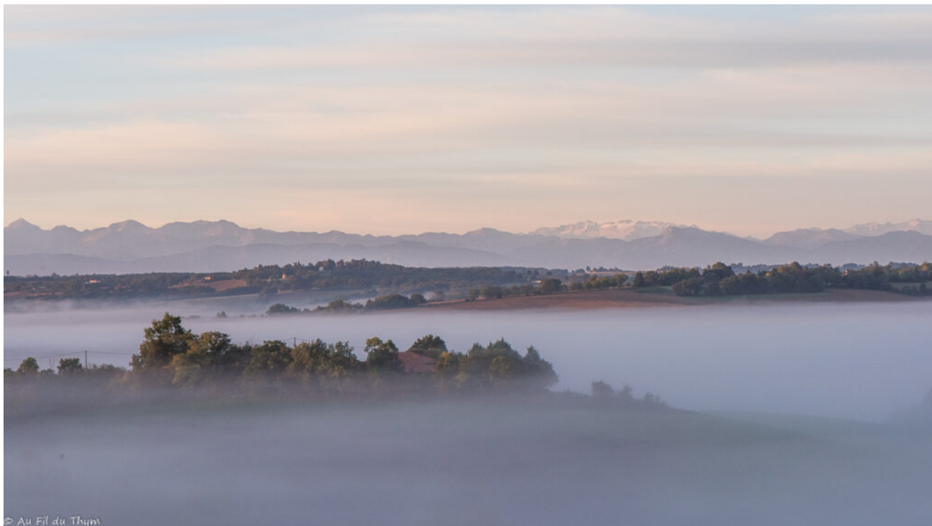
Le Gers sous les brumes