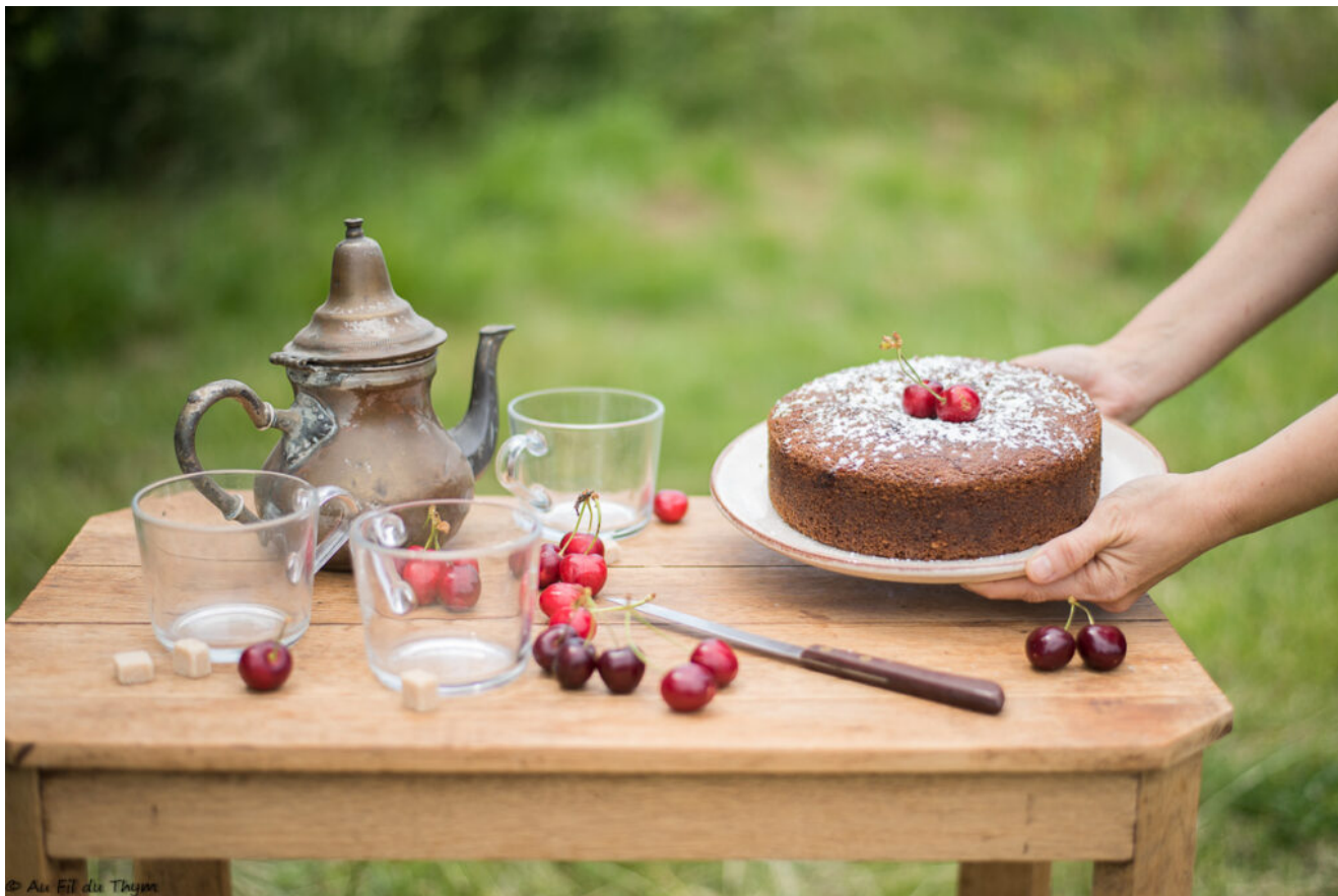
Gâteau cerises amandes façon gâteau au yaourt