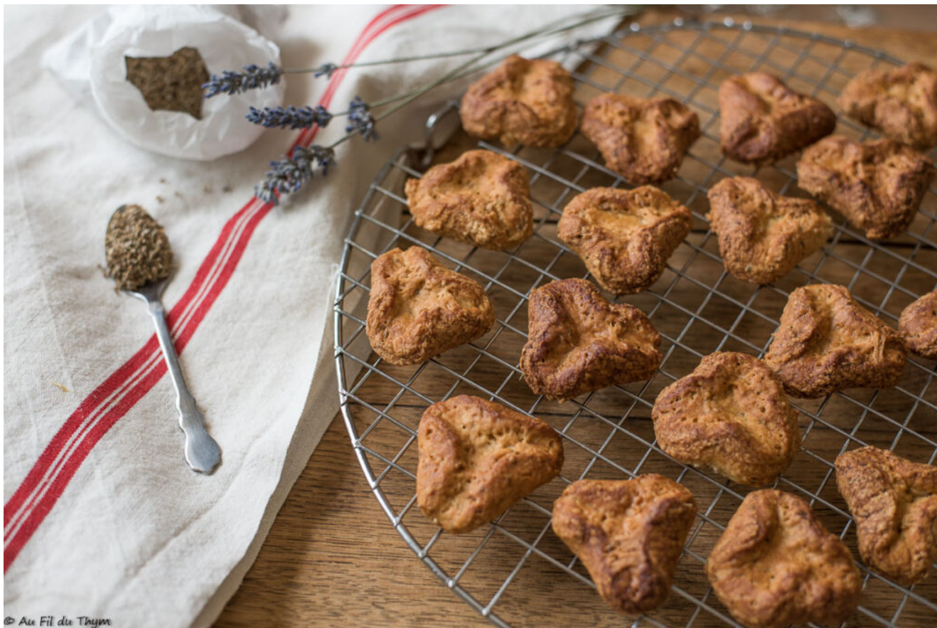
Échaudées (biscuits médiévaux)