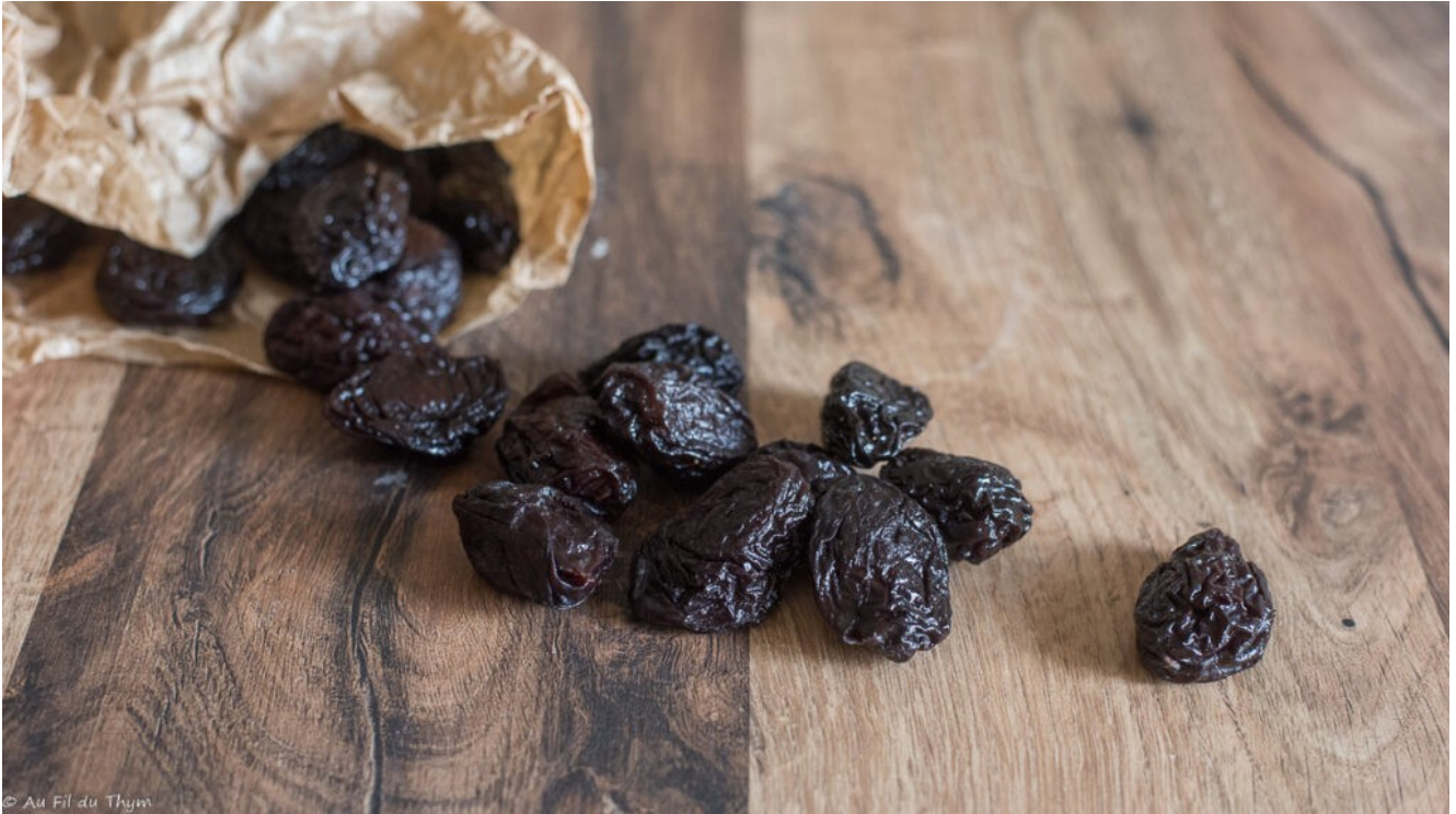
Pruneaux en vrac

Vous pouvez trouver des pruneaux sur les marchés du sud ouest, vendus en vrac, et souvent avec plusieurs calibres (moyens ou gros). On le retrouve aussi en sachet en grande surface. A noter que vous pouvez aussi tout à fait trouver de la prune d'Ente (non séchée) chez certains producteurs de fruits.