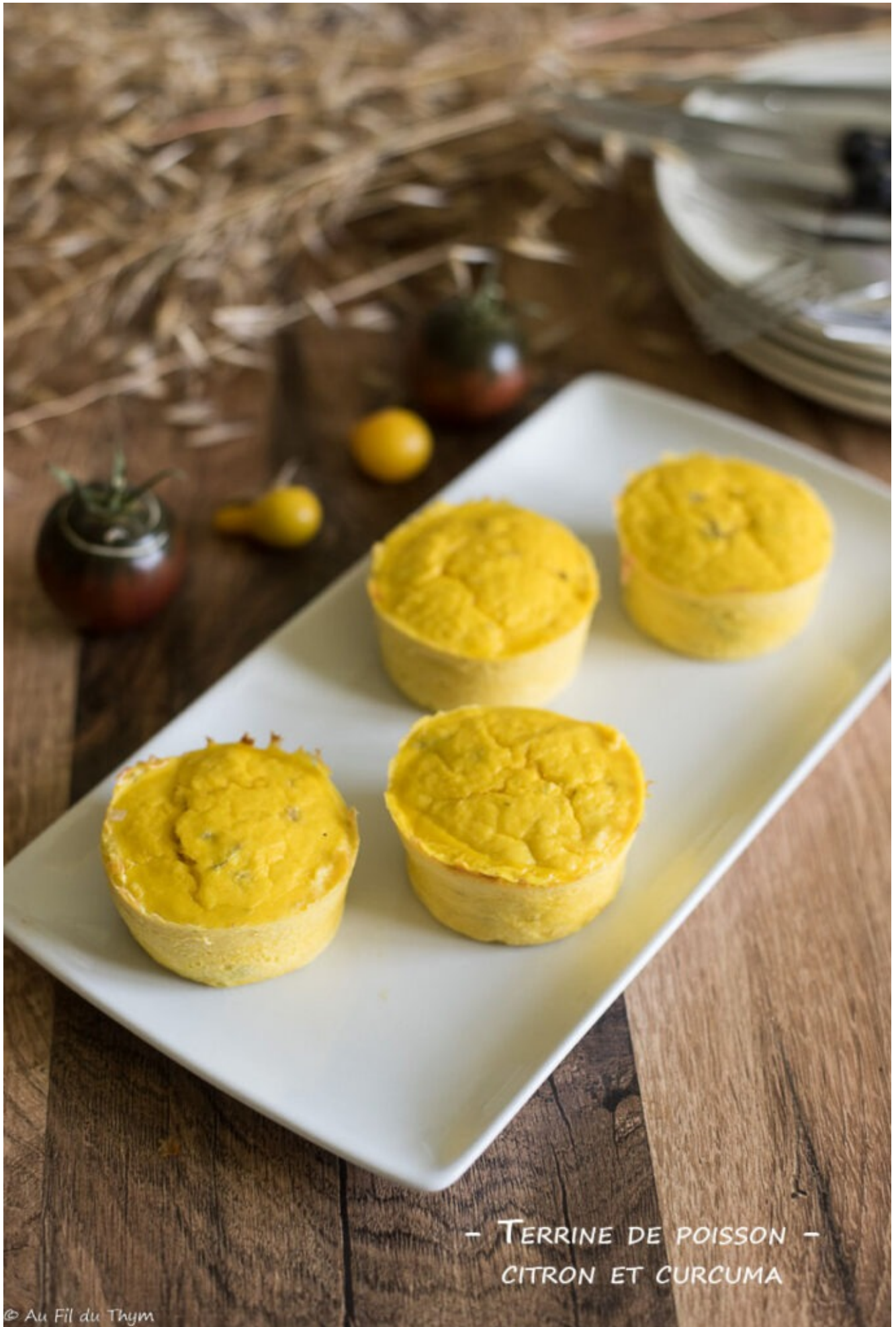
- TERRINE DE POISSON - CITRON ET CURCUMA