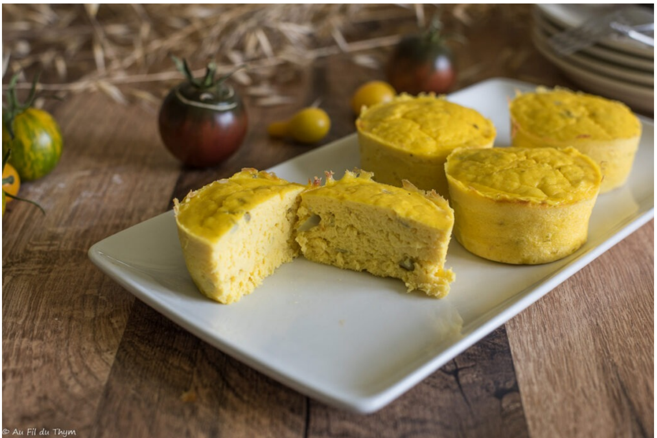
Terrine de poisson citron et curcuma – Zoom

Plat principal Française terriner poisson citron