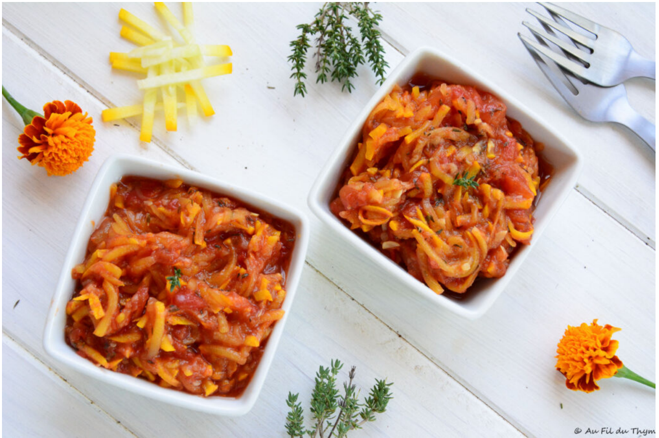
Compotée courgettes tomates