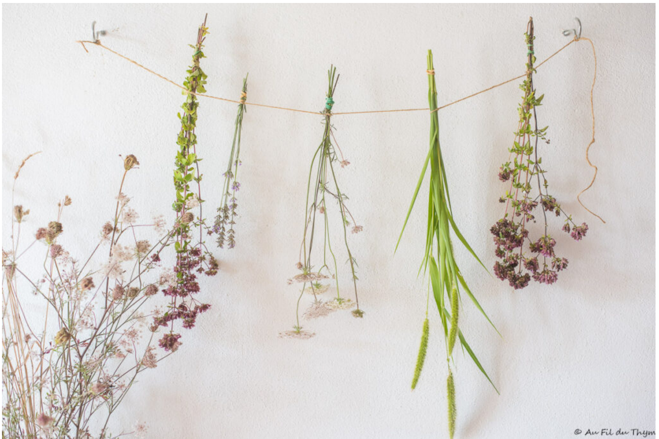
Fleurs séchées maison (en cours de séchage)