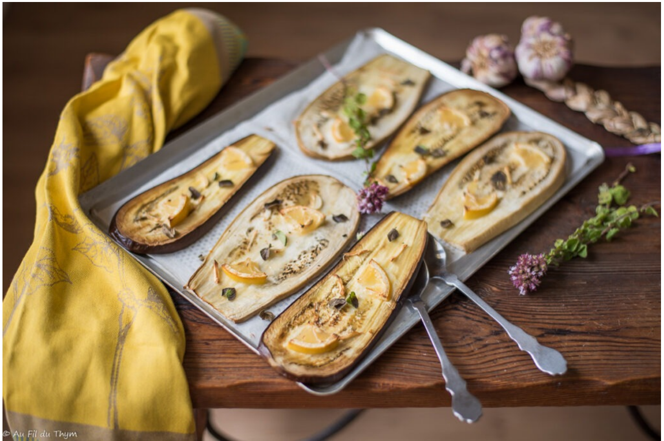
Aubergines confites au citron