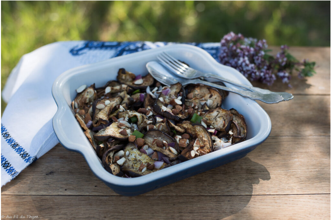
Salade aubergines grillées aux amandes