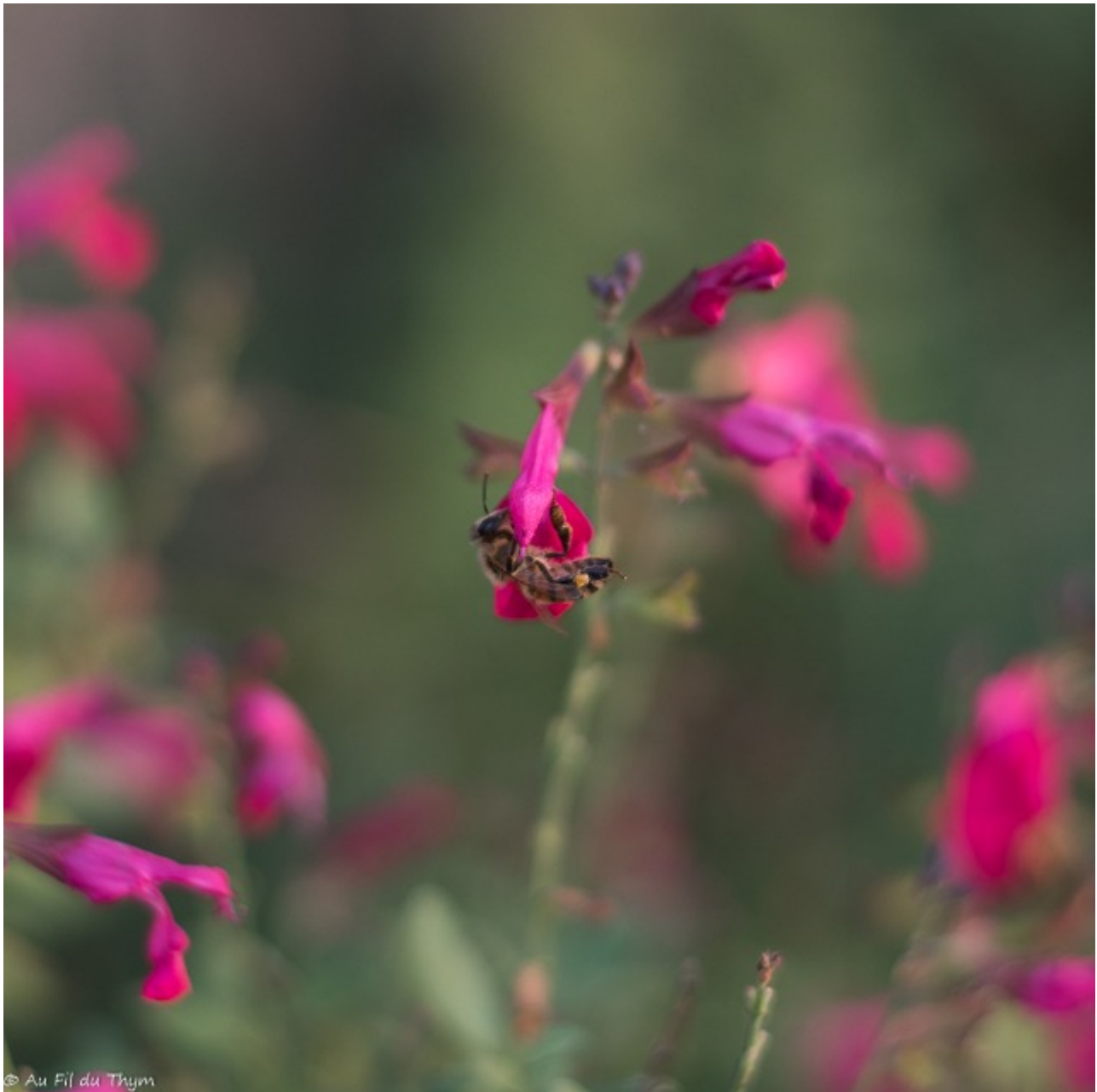
Sauge arbustive (mai, octobre)

4 – S’adapter à son climat et son sol : Dans les foires aux plantes ou les jardinerie, les exposants rivalisent d’ingéniosité pour nous présenter de magnifiques plantes.. mais qui souvent ne s’adapteront pas bien au jardin. Il faut vraiment rester pragmatique et regarder si en terme d’exposition (soleil, ombre..), de type de sol (sec, humide, argileux) la plante coche toutes les cases