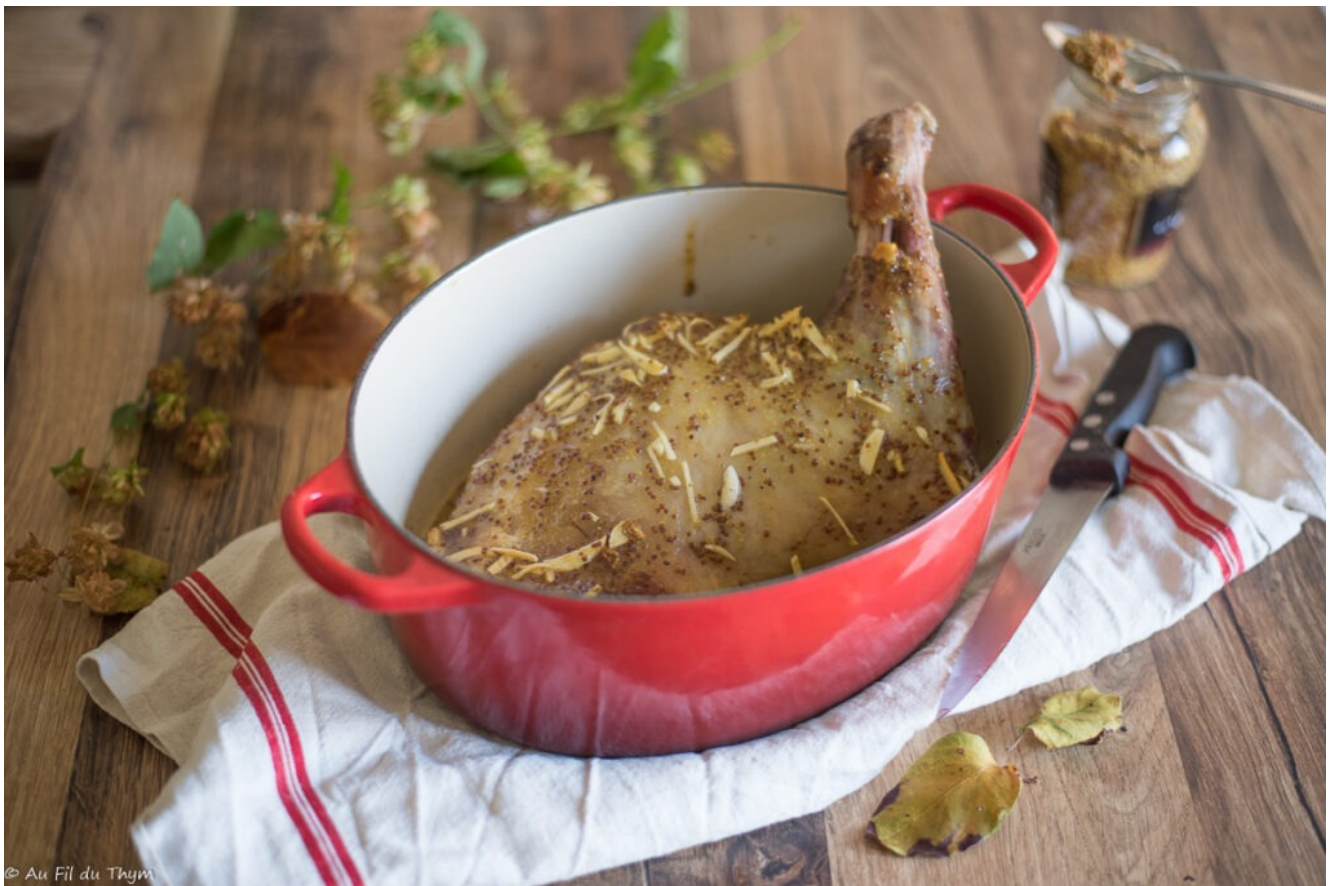
Epaule d'agneau confite, miel moutarde