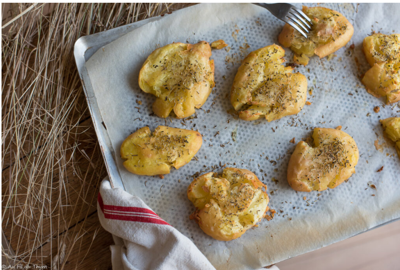
Pommes de terre tapées au thym